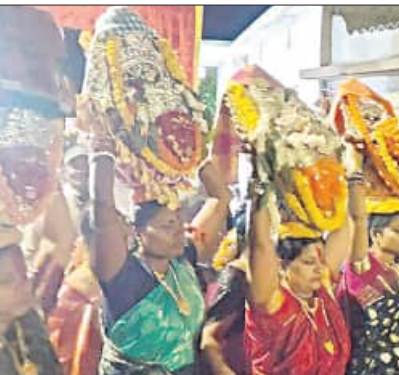
ପୁଲବାଣୀ, ୨୨।୫ (ସମ୍ବିଧ)