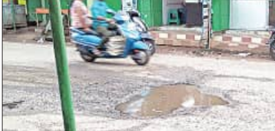
ଏହା ଛୋଟ ଖାଲଖାଲ ବଡ଼ ଖାଲଖାଲରେ ପରିଣତ ହୋଇଛି । ଯାନବାହାନ ଯିବା ଆସିବାରେ ସମସ୍ୟା

ଜି.ଉଦୟଗିରି, ୨୨।୫ (ସମ୍ବିଧ): କନ୍ଧମାଳ ଜିଲ୍ଲା ଜି.ଉଦୟଗିରି ବରାଳିନୀ ମାର୍କେଟ ଦେଇ ଯାଇଥିବା ରାଜ୍ୟ ରାଜପଥ ଅବସ୍ଥା ଶୋଚନୀୟ ହୋଇପଡ଼ିଛି । ଏହି ରାସ୍ତା ଦେଇ ବାଲିଗୁଡ଼ା, ପୁଲବାଣୀ, ବ୍ରହ୍ମପୁର, ପାକୁରିଆ ଆଦି ସ୍ଥାନକୁ ଯାନବାହାନ ଯାତାୟତ କରୁଥିବା ବେଳେ ବ୍ୟସ୍ତବହୁଳ ଜନଗହଳ ପୂର୍ଣ୍ଣ ରାସ୍ତା ହୋଇଥିବାରୁ ସମସ୍ତେ ଅସୁବିଧାର ସମ୍ମୁଖୀନ ହେଉଛନ୍ତି । ରାସ୍ତା ଶୋଚନୀୟ ଯୋଗୁଁ ବିଭିନ୍ନ ସମୟରେ ଦୁର୍ଘଟଣା ଘଟୁଛି । ଠିକ୍ ସମୟରେ ମରାମତି ନ ହେବା ଫଳରେ ଏବେ