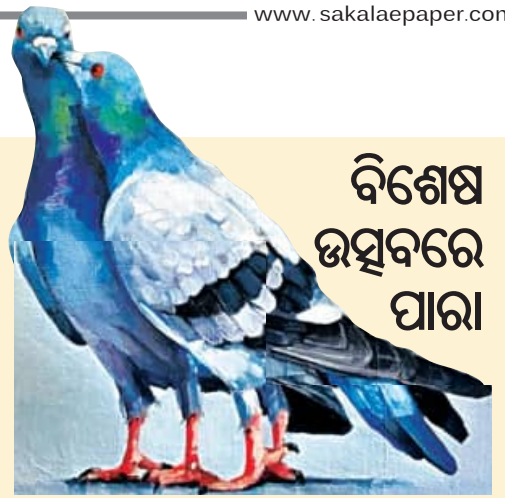
ବିଶେଷ ଉତ୍ସବରେ ପାରା

ବର୍ତ୍ତମାନ ପୁଲିସ ନିକଟରେ ଥିବା କିଛି ପାରାକୁ ବିଶେଷ ଜାତୀୟ ଉତ୍ସବରେ ବ୍ୟବହାର କରାଯାଇଛି । ସାଧାରଣତଃ ଦିବସ ଦିନ, ସାଧାରଣତଃ ଦିବସ ଦିନ, ପୁଲିସ ପ୍ରତିଷ୍ଠା ଦିନ ଏବଂ ଅନ୍ୟ ପ୍ରତିଯୋଗିତାରେ ବ୍ୟବହାର କରାଯାଇଛି । ପାରାର ବ୍ୟବହାର ହେଉ ନ ଥିବାରୁ ଏହାର ସଂଖ୍ୟା କମିଯାଇଛି । ପାରାର ଖାଇବା ଏବଂ ପିଇବା ପାଇଁ ଲକ୍ଷ୍ୟକ ଟଙ୍କା ଖର୍ଚ୍ଚ ହେଉଥିବାରୁ ପୁଲିସ ବିଭାଗ ଏଥିରେ ଟଙ୍କା ଖର୍ଚ୍ଚ କରିବାକୁ ଆବଶ୍ୟକ ମଣ୍ଡୁ ନାହାନ୍ତି । ଯେଉଁଥିପାଇଁ ପାରାର ସଂଖ୍ୟା କମୁଥିବା ଲକ୍ଷ୍ୟ କରାଯାଇଛି ।