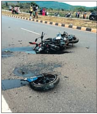
ଯେ ବାଇକ୍ଟି ପୂରା ଦୁଇ ଖଣ୍ଡ ହୋଇଯାଇଥିଲା । ଗୋପାଳ ରାଷ୍ଟ୍ରାକଡ଼ରେ ଥିବା ଏକ ପୋଲ

ବିଶୋଇ,୧୯।୫(ସମିପ): ଶ୍ରୀ ଆଖି ଆଗରେ ଚାଲିଗଲା ସ୍ୱାମୀର ଜୀବନ। ବିଶୋଇ ତନା ଅନ୍ତର୍ଗତ ୪୯୯ ନଂ ଜାତୀୟ ରାଜପଥରେ ଚଟାଣି ଛକ ନିକଟରେ ରବିବାର ଏହି ଅଘଟଣ ଘଟିଛି।