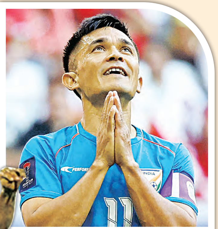
ଭାରତୀୟ ଫୁଟବଲରେ ବଡ଼ ଶୂନ୍ୟସ୍ଥାନ: ଭୂତିଆ