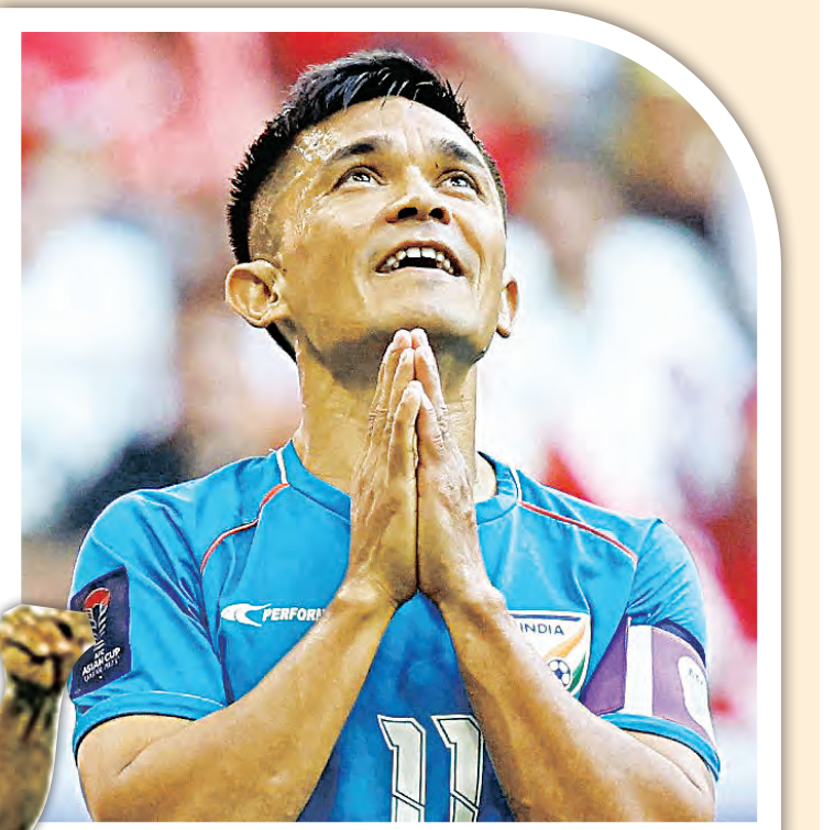
ଭାରତୀୟ ଫୁଟବଲରେ ବଡ଼ ଶୂନ୍ୟସ୍ଥାନ: ଭୂତିଆ