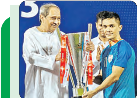
ଭୁବନେଶ୍ୱର, ୧୬।୫ (ସମିପ୍): ଭାରତୀୟ ଫୁଟବଲ କିମ୍ବଦନ୍ତୀ ସୁନୀଲ ଛେତ୍ରୀ ଅବସର ନେବା ପରେ ପୁଣ୍ୟମନ୍ତ୍ରୀ ନବୀନ ପଟ୍ଟନାୟକ ତାଙ୍କୁ ଭୁଜର୍ କରି

ଛେତ୍ରୀ ଅବସର ଘୋଷଣା କରିବା ପରେ ଭାରତୀୟ ବ୍ୟାଟିଂ ସୁପରଷ୍ଟାର ବିରାଟ କୋହଲି ବେଶ୍ ଭାବୁକ ହୋଇ ସାମାଜିକ ଗଣମାଧ୍ୟମରେ ନିଜର ମନକଥା ଉଲ୍ଲେଖ କରିଛନ୍ତି । ଛେତ୍ରୀଙ୍କର ଜଣେ ଅନ୍ତରଙ୍ଗ ବନ୍ଧୁ ଭାବେ କୋହଲି ବେଶ୍ ଜଣାଶୁଣା । 'ଭାରତ ତୁମ ପାଇଁ ଗର୍ବିତ' ବୋଲି କୋହଲି ଉଲ୍ଲେଖ କରିଛନ୍ତି । ବିଭିନ୍ନ ରିଭଲିଟି ଶୋ'ରେ ଉଭୟଙ୍କୁ ଏକାଧିକ ବାର ଦେଖିବାକୁ ମିଳିଛି । କ୍ରୀଡ଼ା ଓ ବ୍ୟକ୍ତିଗତ ଜୀବନ ସମ୍ପର୍କରେ ଦୁହେଁ ଖେଳାଳିଙ୍କର ବହୁତ କଥା କହିଛନ୍ତି ।