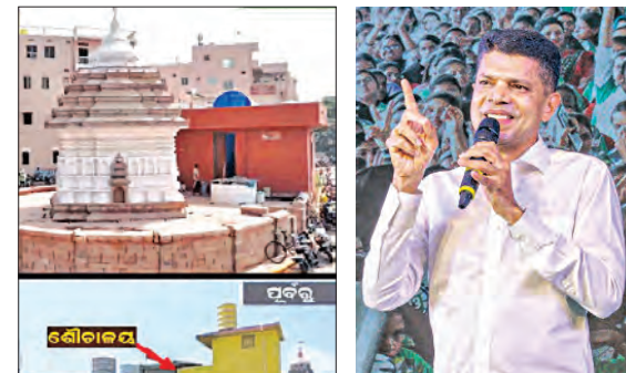
ଗୁରୁ ନାନକ ଏହିଠାରୁ ମହାପ୍ରଭୁଙ୍କୁ ପ୍ରାର୍ଥନା କରିଥିଲେ

ଜବାବଦାଖଲମୁକ୍ତ କରି ମଞ୍ଚ ମଠର ଗରିମା ବଢ଼ାଇଛନ୍ତି ମୁଖ୍ୟମନ୍ତ୍ରୀ ■ ଭୁବନେଶ୍ୱର, ୧୬।୫ (ସମ୍ପାଦକ): ଶ୍ରୀମନ୍ଦିର ପରିକ୍ରମା ନାଁରେ ପୁରାତନ ମଠକୁ ଲାଞ୍ଜି ନଷ୍ଟ କରିଥିବାବେଳେ ବୋଲି ଭୁବନେଶ୍ୱର ସାମ୍ବଦ ପ୍ରାର୍ଥୀ ଅପରାଜିତା ଷଡ଼ଙ୍ଗୀ ସର୍ବସାଧାରଣରେ ବୋଲିଥିବା ବୟାନର କଡ଼ା ଜବାବ ଦେଇଛନ୍ତି ବିଜେପିର ବରିଷ୍ଠ ନେତା ତଥା ସ୍ୱାମୀ ପ୍ରଚାରକ କାର୍ଯ୍ୟକ୍ରମ ପ୍ରଚାର ଉପରା ପରା ହଟାଇବା ସହ ଧାର୍ମିକ ସ୍ଥଳକୁ ନେଇ ସେ କରୁଥିବା ରାଜନୀତିରୁ ଶ୍ରୀ ପାଣ୍ଡିଆନ କଡ଼ା ଜବାବ ଦେଇଛନ୍ତି । ଗୁରୁବାର ଏକ ଭିଡ଼ିଓ ଜାରି କରି ଶ୍ରୀ ପାଣ୍ଡିଆନ ମଞ୍ଚ ମଠର ପୂର୍ବ ଅବସ୍ଥା ଏବଂ ରୂପାନ୍ତରଣ ପ୍ରକଳ୍ପ ସର୍ବସାଧାରଣରେ ଉପସ୍ଥାପିତ କରିଛନ୍ତି । ଏହି ଭିଡ଼ିଓରେ ଶ୍ରୀ ପାଣ୍ଡିଆନ ଶୁଣି ଲାଭେ କହିଛନ୍ତି ଯେ ଶ୍ରୀମନ୍ଦିର ପାଖରେ ଥିବା ମଞ୍ଚ ମଠ ଅତ୍ୟନ୍ତ ପବିତ୍ର ସ୍ଥଳ । ଶ୍ରୀମନ୍ଦିର ସହିତ ଏହି ମଠର ଗଭୀର ସମ୍ପର୍କ ରହିଛି । ଏହିଠାରେ ବସି ଗୁରୁ ନାନକ ମହାପ୍ରଭୁ ଶ୍ରୀକବଳାଧିକାରୀ ଆରାଧନା କରୁଥିଲେ । ତେବେ କାଳକ୍ରମେ ଏହି ପବିତ୍ର ମଠ ଜବରଦଖଲକୁ ଚାଲି ଯାଇଥିଲା । ମଞ୍ଚ ମଠର ଚତୁଃପାଶ୍ୱର୍ଣ୍ଣେ ଲାଞ୍ଜି, ଘର ଆଦି ରହିଥିଲା । ଏହାର ଗଭୀର ଉପରେ ଏକ ଶୈତାନୀୟ ଫୁଲିକରି ରହିଥିଲା । ଉକ୍ତ ହୁକ୍ମା ମଠକୁ ବେଢ଼ି ରହିଥିଲା । ମଠ ଚାରି ପଟେ ଜୋଡ଼ା ଷାଣ୍ଟ ଏବଂ ଅନ୍ୟ ବୋକାନ ରହିଥିଲା । କିନ୍ତୁ ମୁଖ୍ୟମନ୍ତ୍ରୀ ନବୀନ ପଟ୍ଟନାୟକ >ପୃଷ୍ଠା-୧୧