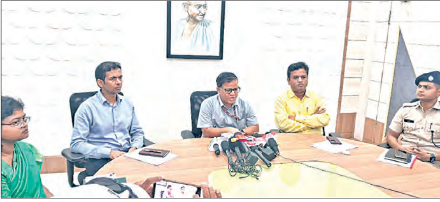
କମିସନି କାମ ଖୁବଶୀଘ୍ର ସରିବାକୁ ଯାଉଛି । ଆଖ୍ୟା କେନ୍ଦୁଝର ଜିଲ୍ଲାରେ ଭଲ ଭୋଟି ହେବ । ଭୋଟରଙ୍କ ଭୋଟି ଅନୁଭୂତିକୁ ସୁଖ୍ୟ କରିବାକୁ ସମସ୍ତ ବ୍ୟବସ୍ଥା ଗ୍ରହଣ କରାଯାଉଛି । ପୋଲି କେନ୍ଦ୍ର ମାନଙ୍କରେ