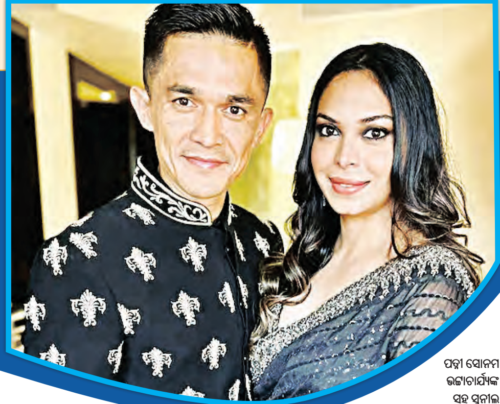
ପତ୍ନୀ ସୋନମ୍ ଭଟ୍ଟାଚାର୍ଯ୍ୟଙ୍କ ସହ ସୁନୀଲ ଛେଟ୍ଟୀ