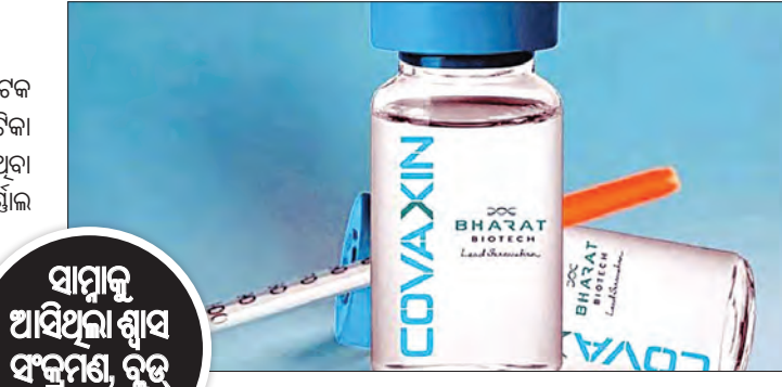
ସାମାନ୍ୟ ଆସିଥିବା ଶ୍ୱାସ ସଂକ୍ରମଣ, ବୁଡ଼ କୁଟି ମାମଲା

କୋଭିଡ଼ିଲୁ ପରେ ଭାରତ ବାୟୋଟେକ ଦ୍ୱାରା ପ୍ରସ୍ତୁତ ସୁଦେଶୀ କରୋନା ଟିକା କୋଭାକ୍ସିନ୍‌ରେ ପାର୍ଶ୍ୱ ପ୍ରତିକ୍ରିୟା ଥିବା ଦାବି କରାଯାଇଛି । ସାଧୁକୁ କର୍ଣ୍ଣାଲ ସ୍ଥିଳରଲିଙ୍କରେ ପ୍ରକାଶିତ ଅଧ୍ୟୟନ ଆଧାରରେ ଲକ୍ଷାନ୍ତମିକ ଟାକ୍ସି ପକ୍ଷରୁ ଏହି ସୂଚନା ଦିଆଯାଇଛି । ବନାରସ ହିନ୍ଦୁ ଯୁନିଭରସିଟି (ବିଏସୟୁ) ପକ୍ଷରୁ ଏହି ଅଧ୍ୟୟନ କରାଯାଇଥିଲା । ଏଥିରେ କୋଭାକ୍ସିନ୍ ନେଇଥିବା ବ୍ୟକ୍ତିଙ୍କ ଉପରେ ଟିକାର ଦାର୍ଢ଼ୀକାମାନ ପ୍ରଭାବର ଆକଳନ କରାଯାଇଥିଲା । ଏହି ଅଧ୍ୟୟନରେ ସାମିଲ ହୋଇଥିବା ପ୍ରାୟ ୩୦ ପ୍ରତିଶତ ଲୋକଙ୍କଠାରେ ପାର୍ଶ୍ୱପ୍ରତିକ୍ରିୟା (ଆଡ଼ଭର୍ସ) ଲକ୍ଷଣ ଅଥା ସ୍ୱେପିଆଳ ଲକ୍ଷଣରେ ତଥା ଏକ୍ସଏସଆ ଦେଖା ଦେଖା ଯାଇଥିଲା । ଏହି ଲୋକଙ୍କଠାରେ ଶ୍ୱାସ