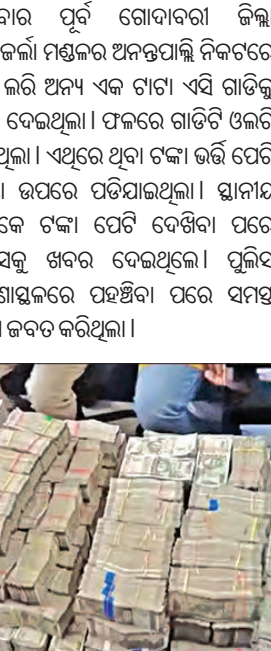
ଦୁର୍ଘଟଣାଗ୍ରସ୍ତ ଗାଡ଼ିରୁ ନଗଦ ୭ କୋଟି ଜବତ

ବିଶାଖାପାଟଣା, ୧୧୫୫ (ଏକେଡ଼ି): ଶନିବାର ପୂର୍ବ ଗୋଦାବରୀ ଜିଲ୍ଲା ନିକ୍ଷାକର୍ମୀ ମଣ୍ଡଳର ଅନନ୍ତପାଲି ନିକଟରେ ଏକ ଲିମ୍ବି ଅନ୍ୟ ଏକ ଗାଡ଼ୀ ଏସି ଗାଡ଼ିକୁ ଚାଲିଥିଲା ବେଳେ ବିଭିନ୍ନ ସ୍ଥାନରେ ପଡ଼ିଥିଲା । ଏଥିରେ ପ୍ରାୟ ୧୦ ଲାକ୍ଷ ଟଙ୍କା ଲୁଟ ହୋଇ ଘଟଣା ସ୍ଥଳରେ ପଡ଼ିଯାଇଥିଲା । ସ୍ଥାନୀୟ ଶନିବାର ଆଞ୍ଚଳିକ ଟ୍ରାଫିକ୍ ପୋଲିସ୍ ଦ୍ୱାରା ଗୋଦାବରୀ ଜିଲ୍ଲାରେ ଏକ ଦୁର୍ଘଟଣାଗ୍ରସ୍ତ ଗାଡ଼ିରୁ ୭ କୋଟି ଟଙ୍କା ଜବତ ହୋଇଛି । ଏହି ଟଙ୍କା ଜବତ କରାଯାଇଥିଲା ବେଳେ ଏହାର ପରିମାଣ ୭ କୋଟି ରହିଥିବା ଜଣାପଡ଼ିଛି । ନିର୍ବାଚନ ଚାଲିଥିବା ବେଳେ ଏହା ପରିମାଣର ଟଙ୍କା କେଉଁଠାକୁ ନିଆଯାଇଥିଲା ତାହାକୁ ନେଇ ପୁଲିସ୍ ଖୋଜିବା ଆରମ୍ଭ କରିଛି । ମିଳିଥିବା ଖବର ଅନୁସାରେ