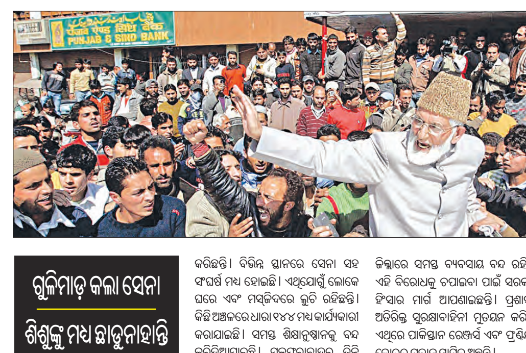
ପାକିସ୍ତାନ ବିରୋଧରେ ରାଷ୍ଟ୍ରରେ ଉତ୍ତର କାଶ୍ମୀରୀ ଜନତା ପିଠକେରେ ଯୁଦ୍ଧ ଭଳି ସ୍ଥିତି

ମୁକ୍ତଚରାବାଦ, ୧୧୫୫ (ଏକେଡ଼ି): ପାକିସ୍ତାନ ଅଧିକାରୀ ବିରୋଧରେ ପିଠକେ ଜନତା ବିପ୍ଳବ ଆରମ୍ଭ କରିଦେଇଛନ୍ତି । ରାଷ୍ଟ୍ରକୁ ଓହ୍ଲାଇ ସରକାର ଏବଂ ସେନା ବିରୋଧରେ ବିରୋଧ ପ୍ରଦର୍ଶନ କରୁଛନ୍ତି । ଏଥିପାଇଁ ଯୁଦ୍ଧ ଭଳି ସ୍ଥିତି ସୃଷ୍ଟି ହୋଇଛି । ଏହି ବିରୋଧକୁ ନିୟନ୍ତ୍ରଣ କରିବା ପାଇଁ ସୁରକ୍ଷାବାହିନୀ ବଳ ପ୍ରୟୋଗ କରିଛି । ଉତ୍ତର କାଶ୍ମୀରୀ ଜନତାଙ୍କ ଉପରେ ସୁନିମାତ୍ର କରାଯାଇଛି । ରିପୋର୍ଟ ଅନୁଯାୟୀ ପାକିସ୍ତାନ ବିରୋଧ କରି ଆରମ୍ଭ ହୋଇଥିବା ବିରୋଧ ପ୍ରଦର୍ଶନ ଶନିବାର ଉତ୍ତର ପ୍ରଦେଶରେ ହୋଇଛି । ଗିରଫ ପରାମର୍ଶନା ଏବଂ ସୂଚନା ବିନା ପିଠକେ ମିରପୁର ଜିଲ୍ଲାକୁ ସେନା ୬୦ ଜଣଙ୍କୁ ଗିରଫ କରିଛି । ବିରୋଧକାରୀଙ୍କୁ ଗିରଫ କରି ନିର୍ଯାତନା ଦେବା ପରେ ଲୋକେ ଉତ୍ତରୀୟ ହୋଇଯାଇଛନ୍ତି । ଲୋକେ ରାଷ୍ଟ୍ରକୁ ଓହ୍ଲାଇ ସୁରକ୍ଷାବାହିନୀ ଉପରକୁ ଉଠିବାକୁ ଚାହୁଁଛନ୍ତି । ବିଭିନ୍ନ ସ୍ଥାନରେ ସେନା ସହ ସଂଘର୍ଷ ମଧ୍ୟ ହୋଇଛି । ଏଥିପାଇଁ ଲୋକେ କ୍ଳାନ୍ତ ହେବା ପାଇଁ ଚାହୁଁଛନ୍ତି । କିଛି ଅଞ୍ଚଳରେ ପାକିସ୍ତାନ ସୂଚନା ସହ ଯୁଦ୍ଧ ଆରମ୍ଭ କରିଛି । ଏଥିରେ ପାକିସ୍ତାନ ସେନା ଏବଂ ପ୍ରଫିଉର କୋର୍ଡର ଯବାନ ସାମିଲ ଅଛନ୍ତି ।