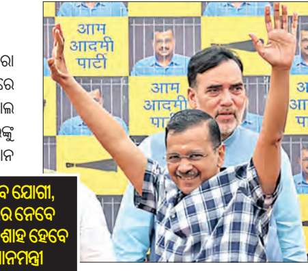
ହରିବେ ଯୋଗା, ଅବସର ନେବେ ମୋଦୀ, ଶାହ ହେବେ ପ୍ରଧାନମନ୍ତ୍ରୀ

ଦିଲ୍ଲୀ ଅବକାରୀ ନାଟି ଦୁର୍ଦ୍ଦାତି ମାମଲାରେ ଲଢ଼ି ଦ୍ୱାରା ଚିରପ ହୋଇ ପ୍ରାୟ ୫୦ ଦିନ ଧରି ତିହାର ଜେଲରେ ରହିବା ପରେ ଦିଲ୍ଲୀ ମୁଖ୍ୟମନ୍ତ୍ରୀ ଅରବିନ୍ଦ କେଜ୍ରିୱାଲ ବାହାରକୁ ଆସିଛନ୍ତି । ସୁପ୍ରିମକୋର୍ଟ କେଜ୍ରିୱାଲଙ୍କୁ ଜୁନ ୧ ତାରିଖ ପର୍ଯ୍ୟନ୍ତ ସର୍ଭିଲୁଲ୍ କାମିନି ପ୍ରଦାନ କରିଥିଲା ବେଳେ ଏହି ସମୟରେ ସେ ନିଜ ଦଳ ଏବଂ ବିରୋଧୀ ଲଢ଼ିଆ ମେଣ୍ଟ ପାଇଁ ନିର୍ବାଚନ ପ୍ରଚାର କରିବେ ବୋଲି ଘୋଷଣା କରିଛନ୍ତି । ଶନିବାର କେଜ୍ରିୱାଲଙ୍କୁ ଆମ୍ ଆଦମୀ ପାର୍ଟି ମୁଖ୍ୟ କାର୍ଯ୍ୟକ୍ରମରେ ଦଳ ପକ୍ଷରୁ ସ୍ୱାଗତ କରାଯାଇଛି । ପରେ ପରେ ଏକ ସାମୁଦ୍ରିକ ସମ୍ମିଳନୀରେ କେଜ୍ରିୱାଲ ପ୍ରଧାନମନ୍ତ୍ରୀ ନରେନ୍ଦ୍ର ମୋଦୀଙ୍କ ଉପରେ କୋରସୋଫ୍ଟ ବର୍ଷିଛନ୍ତି । ପ୍ରଧାନମନ୍ତ୍ରୀ ମୋଦୀ ଦେଶରେ ଏକଛତ୍ରବାଦୀ ଶାସନ ପରମ୍ପରା ଚଳାଇଥିଲା ବେଳେ ଏକ ରାଷ୍ଟ୍ର ଏକ ନେତା ରାତିରେ ଦେଶକୁ ଶାସନ କରିବାକୁ ଚାହୁଁଛନ୍ତି । ତାଙ୍କ ଦଳ ଆମ ଆଦମୀ ପାର୍ଟିକୁ ସମ୍ପୂର୍ଣ୍ଣ ଭାଙ୍ଗି ଦେବାକୁ ବିଜେପି ସ୍ୱତନ୍ତ୍ର କରିଛି । କିନ୍ତୁ ବଜରଙ୍ଗ ବାଲିକ କୁପାୟ ସେ ସବୁ ସମ୍ଭବ ହେବ ନାହିଁ । କେବଳ ତାଙ୍କ ଦଳ ନୁହେଁ, ମୋଦୀ ଯେଉଁ ବିପଜ୍ଜନ ଆଭିମୁଖ୍ୟ ନେଇ କାର୍ଯ୍ୟ କରୁଛନ୍ତି ତଦ୍ୱାରା ଦେଶରେ ଗଣତନ୍ତ୍ର ଲୁଚିପଡ଼ି ପଡ଼ିବା ସହିତ ଅନ୍ୟ କୌଣସି ଦଳାୟ