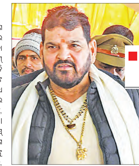
ବିକଳୁଷଣଙ୍କ ବିରୋଧରେ ମାମଲା ଚାଲିବ ଓ ତାଙ୍କୁ ଦଣ୍ଡ ଦିଆଯିବ ନ୍ୟାୟୋଚିତ ହେବ ବୋଲି ଚାର୍ଜିସ୍ଥିରେ ଉଲ୍ଲେଖ