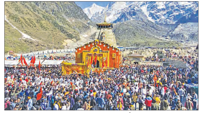
ଖୋଲିଲା ବାବା କୋରାନ୍ନାଥଙ୍କ ପହଡ଼ା ଦିନକରେ ଦର୍ଶନ କଲେ ୨୯ ହଜାର ୩୦ ଭକ୍ତ

ସୁରକ୍ଷାବାହିନୀକୁ ସଫଳତା ୧୩୧ ଦିନରେ ୧୦୩ ମାଓବାଦୀ ସମା