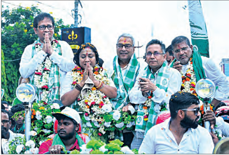
ନାମାଙ୍କନ ଦାଖଲ ପୂର୍ବରୁ ବାଲେଶ୍ଵରରେ ବିଜେଡିର ଲୋକସଭା ଓ ବିଧାନସଭା ପ୍ରାର୍ଥୀଙ୍କ ଶୋଭାଯାତ୍ରା

କଣ୍ଠାବାଞ୍ଜିରେ ଖାଲି ବିଜେଡିରେ ମିଶିଲେ କଂଗ୍ରେସର ୨ ବୁକ୍ ଅଧିକ୍ଷା