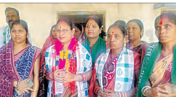
ବର୍ଷର କାର୍ଯ୍ୟ ଓ ନବୀନ ସରକାରଙ୍କ ଯୋଜନା ଉପରେ ଲୋକଙ୍କୁ ଅବଗତ କରି ଭୋଟ ଡିଆଁ କରୁଛନ୍ତି। ବିଧାୟକ ପ୍ରାର୍ଥୀଙ୍କ ପରିବାର ସହ ବିଜେଡି ପରିବାରର ଜଣେ ସକ୍ରିୟ ସଦସ୍ୟା