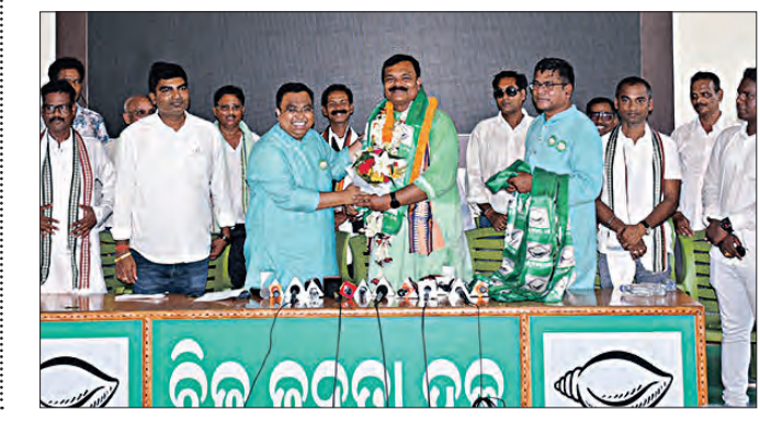
କୋଭିଡ଼ମୁଖୀ କାର୍ଯ୍ୟ, ସ୍ଵଚ୍ଛ ଶାସନ, ନିର୍ମଳ ଭାବମୂର୍ତ୍ତି ଓ ନୀତି ଆଦିରେ ଅନୁପ୍ରାଣିତ ହୋଇ ଆଜି ବିଧିବଦ୍ଧ ଭାବେ ବିଜେଡିରେ ଯୋଗ ଦେଇଛି।