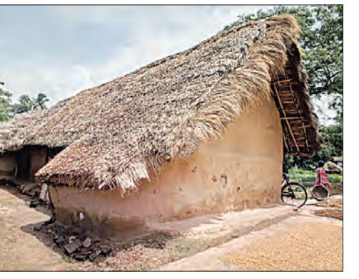
ପାଇନାହିଁ । ଏ ନେଇ ହିତାଧିକାରୀ ବିଭାଗର ଅଧିକାରୀଙ୍କ ନିକଟକୁ ଗଲେ କାର୍ଯ୍ୟାଦେଶ ଯାଞ୍ଚ ହେବା ପାଇଁ ଜିଲ୍ଲା କାର୍ଯ୍ୟାଳୟକୁ ପଠାଯାଇଛି ବୋଲି କହୁଛନ୍ତି । ବିଶୋଇ ବ୍ଲକର ଗ୍ରାମୀଣ ଗୃହ

ବିଶୋଇ, ୯।୫ (ସମ୍ବିଧ) ଗ୍ରାମାଞ୍ଚଳର କଳା ଘରେ ଦିନ କାର୍ଯ୍ୟକ୍ରମ ଚଳିବା ଅଧିବାସୀଙ୍କୁ ପଞ୍ଚାୟତ ଦେବା ପାଇଁ ପ୍ରଧାନମନ୍ତ୍ରୀ ଆବାସ ଯୋଜନା କାର୍ଯ୍ୟକାରୀ ହେଉଛି; ହେଲେ ମୟୂରଭଞ୍ଜ ଜିଲ୍ଲାରେ ଏହି ଯୋଜନା ଦିଗହରା ହୋଇଛି । ଜିଲ୍ଲାରେ ୨୪୬୧ ହିତାଧିକାରୀ କାର୍ଯ୍ୟାଦେଶ ପାଇଥିଲେ ମଧ୍ୟ ଆଜିଯାଏ ପ୍ରଥମ କିଛି ଟଙ୍କା ପାଇନାହିଁ । ଫଳରେ ହିତାଧିକାରୀ ବିଭିନ୍ନ ଅସୁବିଧାର ସମ୍ମୁଖୀନ ହେଉଛନ୍ତି । ଏନେଇ ହିତାଧିକାରୀମାନେ ବୁଦ୍ଧି ବିଭାଗର ଅଧିକାରୀଙ୍କ ନିକଟକୁ ବୋଧୁଥିଲେ ମଧ୍ୟ କୌଣସି ଫଳ ମିଳୁ ନ ଥିବା ଅଭିଯୋଗ ହେଉଛି । ସରକାରୀ ତଥ୍ୟ ଅନୁଯାୟୀ ମୟୂରଭଞ୍ଜ ଜିଲ୍ଲାର ବର୍ତ୍ତମାନ ସୁଦ୍ଧା ବିଶୋଇ ବ୍ଲକରେ ୨୦୨୩ ଜୁଲାଇ ମାସର ପ୍ରଥମ କିଛି ଟଙ୍କା ପାଇଥିବା ୧୦୬୫ ହିତାଧିକାରୀ ଗୃହ ନିର୍ମାଣ ଶେଷ କରିଛନ୍ତି । ତେବେ ଏହି ସମୟରେ ୮୦ ଜଣ ହିତାଧିକାରୀ ଆବାସ ଯୋଜନାରେ ଘର ନିର୍ମାଣ ପାଇଁ କାର୍ଯ୍ୟାଦେଶ ପାଇଥିଲେ ସୁଦ୍ଧା ପ୍ରଥମ କିଛି ଟଙ୍କା