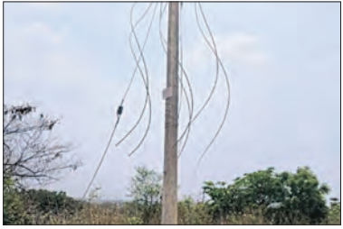
ଟଙ୍କାକୁ ଉଠାଇ ଦେବାକୁ ଚୋରମାନେ ଆସିଥିଲେ।

କାମଗୋଳା, ୯।୫ (ସମ୍ପାଦକ): ମୟୂରଭଞ୍ଜ ଜିଲ୍ଲାର ସାରସକଣ୍ଠା ବ୍ଲକ୍ ଝାରପୋଖରୀଆ ଥାନା ଅନ୍ତର୍ଗତ ଚୁଙ୍ଗୁରିଡିହି ସୁବର୍ଣ୍ଣରେଖା କେନାଲ ରାସ୍ତା ଦେଇ ଯାଇଥିବା ୧୧ କେଜି ବିଦ୍ୟୁତ୍ ତାର ରୁଧିରା ରାତିରେ ଚୋରି କରିବାକୁ ଚୋରମାନେ ଆସିଥିଲେ; ହେଲେ ସ୍ଥାନୀୟ ଲୋକେ ଦେଖିବା ପରେ ବୋଲି ଦେଖିବା ପରେ ଚୋରମାନେ ଚାଲିଯାଇଥିଲେ।