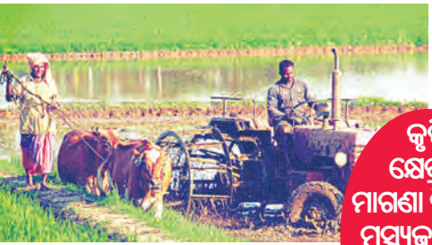
ଚାଷୀମାନଙ୍କୁ ବିଜେଡି ସରକାର ୧.୫ ଲକ୍ଷ ଟଙ୍କା ପର୍ଯ୍ୟନ୍ତ ବିନାସୁଧରେ ରଣ ପ୍ରଦାନ କରିବ । କୃଷକ ପରିବାର ପିଲାମାନଙ୍କର ଶିକ୍ଷା ପାଇଁ ଛାତ୍ରବୃତ୍ତି

ଏବଂ ନିର୍ଭରଶୀଳ ଝିଅ ବିବାହ ପାଇଁ ୨୫ ହଜାର ସହାୟତା ସହିତ କାଳିଆ ଅନୁଦାନ ଜାରି ରହିବ ଏବଂ ବିସ୍ତାର କରାଯିବ । ସମସ୍ତ ଯୋଗ୍ୟ ପରିବାରକୁ ରେସନ କାର୍ଡ ଯୋଗ୍ୟତା ଢିଲିରେ ନିଶ୍ଚିତ ଯୋଗାଇ ଦିଆଯିବ, ଯାହା ସମସ୍ତ ପରିବାରକୁ ଅନ୍ତର୍ଭୁକ୍ତ ନିଶ୍ଚିତ କରିବ । କୃଷକମାନେ ରାଜ୍ୟର ଖାଦ୍ୟ ନିରାପଣରେ ମେରୁଦଣ୍ଡ ଅଟନ୍ତି । କୃଷିର ସମଗ୍ର ଇକୋସିଷ୍ଟମ ମଜବୁତ ହେବ । କୃଷି ଉଦ୍ଦେଶ୍ୟରେ ମାଗଣା ବିଦ୍ୟୁତ୍ ପ୍ରଦାନ କରାଯିବ, ଯାହା ସାରା ରାଜ୍ୟରେ କୃଷକମାନଙ୍କୁ ଉପକୃତ କରିବ । ଏହା ଉପାଦାନ ବୃଦ୍ଧି ଏବଂ ସେମାନଙ୍କର ଭାର ହ୍ରାସ କରିବାରେ ସହାୟକ କରିବ । ମୌସୁମୀ ଅନିଶ୍ଚିତତାକୁ ଦୂର କରିବା ପାଇଁ ମସୂଜାବା ସମ୍ପ୍ରଦାୟକୁ ବାର୍ଷିକ ୧୫,୦୦୦ ପ୍ରଦାନ କରାଯିବ ।