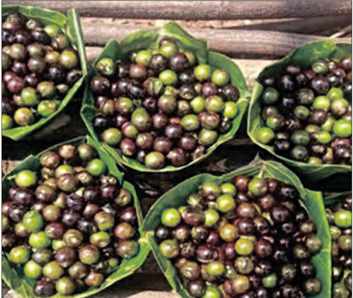
କରୁଛନ୍ତି। ଦନା ପ୍ରତି ୧୦ ଟଙ୍କା ମୂଲ୍ୟରେ ବିକ୍ରି ହେଉଛି। ସକାଳ ୬ରୁ ୧୦ଟା ପର୍ଯ୍ୟନ୍ତ ବଣରେ ବୁଲିବୁଲି ଗଛରୁ କୋଳି ଚଳି ଆଣି ବିକ୍ରି କରିଥାନ୍ତି ଆଦିବାସୀ ପରିବାର।

ମୟୂରଭଞ୍ଜ ଜିଲ୍ଲା ଗୋପବନ୍ଧୁ ନଗର ବ୍ଲକ୍ ଆଦିବାସୀ ଅଧ୍ୟୁଷିତ ଅଞ୍ଚଳ ଭାବେ ଜଣାଶୁଣା। ଏହି ବ୍ଲକ୍ରେ ୭୦ ପ୍ରତିଶତ ଲୋକେ ଆଦିବାସୀ ସମ୍ପ୍ରଦାୟର ହୋଇଥିବାବେଳେ ସମସ୍ତେ ଖିରିଖିଆ।