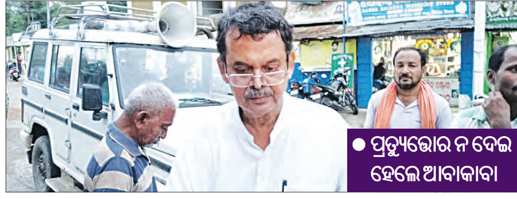
● ପ୍ରତ୍ୟୁତ୍ତୋର ନ ଦେଇ ହେଲେ ଆବାକାବା