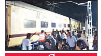
ଅଜ୍ଞତେ ବର୍ତ୍ତିଲେ ଯାତ୍ରୀ

କାଶୀନଗର, ୨୪ (ସମ୍ବିଧ): ରାଜପଥ ଜିଲ୍ଲା କାଶୀନଗର