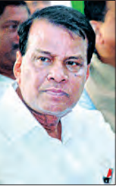
ରେମୁଣା, ଜଳେଶ୍ୱର ଓ ସୋର ବିଧାନସଭା ପ୍ରାର୍ଥୀଙ୍କୁ ନେଇ ଚେକ୍ଚୁକି ଅସନ୍ତୋଷ

ବାଲେଶ୍ୱର, ୬/୪ (ସମ୍ବିଧ): ନିର୍ବାଚନ ପୂର୍ବରୁ ଗୋଟିଏ ପରେ ଗୋଟିଏ ଶକ୍ତ ଧକ୍କା ବାଲେଶ୍ୱର ଜିଲ୍ଲା ବିଜେପି ସଂଗଠନକୁ ଦୁର୍ବଳ କରିବାରେ ଲାଗିଛି।