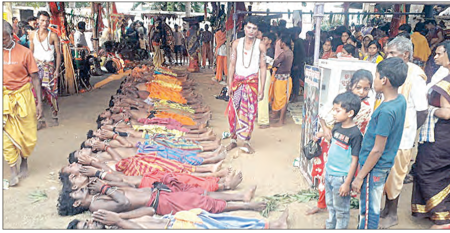
ଶେଷ ହୋଇଥିଲା। ସେହିପରି ଲାଲନପଡ଼ାର ମଳିକ ଗାଁ ଦଣ୍ଡର ମେରୁଯାତ୍ରାରେ ମଧ୍ୟ ସାହସ୍ୱାଧିକ ଭକ୍ତଙ୍କ ସମାଗମ ହୋଇଥିଲା। ସମସ୍ତ ଭକ୍ତ ଫକ୍ତାଦି ମେରୁ ଅବସରରେ ଭକ୍ତିପୂର୍ଣ୍ଣ ଭାବେ ରହି ମା ରୁଦ୍ରକାଳୀଙ୍କ ପୂଜାର୍ଚ୍ଚନା କରିଥିଲେ। ଦୀର୍ଘ ତେର ଦିନ ବାହାରେ ଭ୍ରମଣ କରିବା ପରେ ମା ଆଜି ଠାରୁ ମନ୍ଦିରରେ ରହି ପୂଜା ପାଇବେ।

କନ୍ଧମାଳ ଜିଲ୍ଲା ଚକାପାଦ ବ୍ଲକରେ ୧୨ ଦଣ୍ଡ ଦଳର ମେରୁ ଫକ୍ତାଦି ଉତ୍ସବ ପାଳିତ ହେବା ସହିତ ତେର ଦିନ ଧରି ଚାଲିଥିବା ଦଣ୍ଡଯାତ୍ରା ଶେଷ ହୋଇଛି। ଶନିବାର ମାସକ ଦିବସ ଅବସରରେ ଲୁକ୍ତରାମୁଣ୍ଡା, ପାଣ୍ଡୁପାମା, ବାହାଳି, ବାହୁଣ୍ଡପାଦ, ନନ୍ଦିନୀ, ସୁନାପାଜୀ, ଶିଶିବାଳି, ସୁନାଗୁଡ଼ା ମେରୁ ଯାତ୍ରା ଅନୁଷ୍ଠିତ ହୋଇଥିଲା। ଫକ୍ତାଦି ଦିନ ଲାଲନପଡ଼ାର ମଳିକ ଗାଁ, ସିରିକାକୁଟି ଏବଂ ପସରା ଦଣ୍ଡ ଦଳର ମେରୁଯାତ୍ରା ହୋଇଥିଲା। ମାସକ ମେରୁ ଅବସରରେ କନ୍ଧମାଳ ଜିଲ୍ଲାର ପ୍ରସିଦ୍ଧ ତଥା ବହୁ ପ୍ରତୀକ୍ଷା ମୁକ୍ତକାଳୀ ଲୁକ୍ତରାମୁଣ୍ଡା ଏବଂ ଚକାପାଦର ପାଣ୍ଡୁପାମା, ଲାଲନପଡ଼ା, ଶିଶିବାଳି ଏବଂ ସୁନାଗୁଡ଼ା ମେରୁ ଯାତ୍ରାରେ ହଜାର ହଜାର ଭକ୍ତଙ୍କର ଗହଳ ଦେଖିବାକୁ ମିଳିଥିଲା। ଧୂଳି ଦଣ୍ଡ, ପାଣି ଦଣ୍ଡ କାର୍ଯ୍ୟକ୍ରମ ଦିନବେଳା ହୋଇଥିବା ବେଳେ ରାତିରେ ମେରୁଝୁଲି ଏବଂ ଝୁଣା ଦଣ୍ଡ, ପରଭା କାଠି ନୃତ୍ୟ ହୋଇଥିଲା। ସକାଳେ ଯଥା ରୀତି ବାଣୀକାର ନୃତ୍ୟ ପରେ ଯାତ୍ରା କାର୍ଯ୍ୟକ୍ରମ