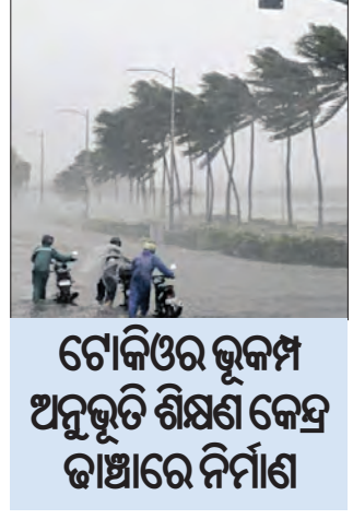
ଟୋକିଓର ଭୂକମ୍ପ ଅନୁଭୂତି ଶିକ୍ଷଣ କେନ୍ଦ୍ର ଜାଣିରେ ନିର୍ମାଣ

ଭୁବନେଶ୍ୱର, ୧୪/୪ (ଏନିସି): ବିପର୍ଯ୍ୟୟ ପରିଚାଳନାରେ ସର୍ବୋତ୍କୃଷ୍ଟ ପାରଦର୍ଶିତା ପାଇଁ ଓଡ଼ିଶା ଦେଶରେ ଶ୍ରେଷ୍ଠ ବିବେଚିତ ହୋଇଛି। ବିପର୍ଯ୍ୟୟ ମୁକାବିଲା ପାଇଁ ଓଡ଼ିଶା ରାଜ୍ୟ ବିପର୍ଯ୍ୟୟ ପରିଚାଳନା କଳ୍ପପତ୍ର (ଓସପିଆ) ଗୁରୁତ୍ୱପୂର୍ଣ୍ଣ ବୋଧ ଆପଦ ପ୍ରବନ୍ଧନ ପୁରାତ୍ମାର ଭଳି ମର୍ଯ୍ୟାଦାଜନକ ସମ୍ମାନ ପାଇଛି। ପ୍ରତିବର୍ଷ ବନ୍ୟା, ବାତ୍ୟା ସହ ଲଢ଼ି ଆଗକୁ ବଢ଼ୁଥିବା ଓଡ଼ିଶା ଆଇ ଏକ କାର୍ତ୍ତିମାନ ସ୍ତାପନ ପାଇଁ ଯୋଜନା ପ୍ରସ୍ତୁତ କରିଛି। ରାଜ୍ୟରେ ଅତ୍ୟାଧୁନିକ 'ବାତ୍ୟା ଓ ଅନ୍ୟାନ୍ୟ ବିପର୍ଯ୍ୟୟ ଅନୁଭୂତି ଶିକ୍ଷଣ କେନ୍ଦ୍ର' ପ୍ରତିଷ୍ଠା କରି ଓଡ଼ିଶା ଦେଶର ଅନ୍ୟ ରାଜ୍ୟଗୁଡ଼ିକ ପାଇଁ ରୋଲ୍ ମଡେଲ୍ ହେବାକୁ ଯାଉଛି। ରୋପାଟିଂଆରେ ନିର୍ମାଣାଧୀନ ରାଜ୍ୟ ଇନ୍ଫ୍ରେସ୍ଟ୍ରକ୍ଚର୍ ଏସ୍ ଡିକାସ୍ତର ମ୍ୟାଜେକମେଣ୍ଟ (ଏସ୍ଆଇଡିଏମ୍) ଠାରେ ଏହି କେନ୍ଦ୍ର ପ୍ରତିଷ୍ଠା ପାଇଁ ନିଷ୍ପତ୍ତି ହୋଇଛି। ଏଥିପାଇଁ ବିଶ୍ୱବ୍ୟାଙ୍କ ପକ୍ଷରୁ ସହାୟତା ଯୋଗାଇ ଦିଆଯିବ ବୋଲି ଜଣାପଡ଼ିଥିବା