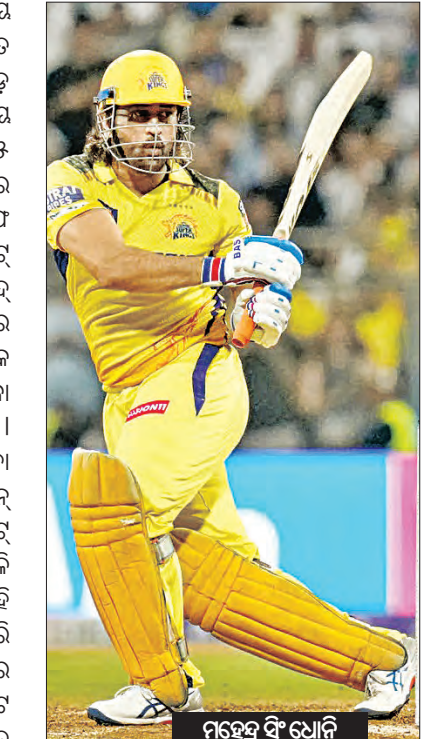
ମହେନ୍ଦ୍ର ସିଂ ଧୋନି

ମୁମ୍ବାଇ ରଣଶୀଳ ଖେଳାଳି ଶିବମ ଦୁବେ। ଉଭୟ କେବଳ ବଡ଼ ସ୍କୋର ନଥିଲେ ବରଂ ଦ୍ରୁତ ରନ୍ ଫଗ୍ରହ କରି ଚେନ୍ନାଇ ଲାଗି ଏକ ବଡ଼ ସ୍କୋରର ମୂଳଦୁଆ ପକାଇଥିଲେ। ତୃତୀୟ ଡିକେଟ୍ ଗାଗାଦାରିରେ ଏମାନେ ମାତ୍ର ୪୫ ବଲ୍‌କୁ ୯୦ ରନ୍ ଉଠାଇଥିଲେ। ଚେନ୍ନାଇ ପାଳିର ୧୬ତମ ଓଭରରେ ହାଦିକ ପାଣ୍ଡାଙ୍କ ଏକ ଅପ କଟରକୁ ହାଲକା ଭାବେ ମାରି ବା ମିସ୍ ହିଟ୍ କରି ଗାବ୍‌ଖାଡ଼ ଲକ୍ଷ୍ମୀ ଅଞ୍ଚଳରେ ମହତ୍ତ୍ୱ ନବିକ୍ ହାତରେ ଧରାପଡ଼ିଥିଲେ। ଏକ ବଲ୍‌କୁର ଗାଗାଦାରିରେ ଶେଷ ହୋଇଥିଲା ଏହି ଅଧିନାୟକ ୩୮ ବଲ୍‌ର ସାମାନ୍ୟ କରି ୫ଟି ଲେଖାଏଁ ଟୋକା ଓ ଛକା ସହାୟତାରେ ୬୯ ରନ୍ କରିଥିଲେ। ଏହି ସମୟରେ ୨୮ ବଲ୍‌କୁ ୫୦ ରନ୍ କରିଥିବା ଦୁବେ ଓ ତାରିକ ମିତେଲ ୪ ଓଭରରେ ୩୬ ରନ୍ ଫଗ୍ରହ କରିଥିଲେ। ମିତେଲଙ୍କ ବ୍ୟାଟିଂରୁ ବଡ଼ ସ୍କୋର ଦେଖିବାକୁ ମିଳି ନ ଥିଲା ଓ ସେ ୧୪ ବଲ୍ ଖେଳି ଗୋଟିଏ ଟୋକା ସହ ୧୬ ରନ୍ କରିଥିଲେ। ଏହି ସମୟରେ ଯଶପ୍ରାଭ୍ କୁମ୍ଭାର ୨ ଓଭର ବୋଲି କରି ରନ୍ ନିୟନ୍ତ୍ରଣ କରିଥିଲେ। ପାଳିର ଶେଷ ଓଭର ଅର୍ଥାତ୍ ୨୦ତମ ଓଭରର ଦ୍ୱିତୀୟ ବଲ୍‌ରେ ଆଉଟ ହୋଇଥିଲେ ମିତେଲ। ଗାବ୍‌ଖାଡ଼ଙ୍କ ଭଳି ମିତେଲ ମଧ୍ୟ ପାଣ୍ଡାଙ୍କୁ ଦୁର୍ବଳ ସ୍କୋର ଲକ୍ଷ୍ମୀ ଅଞ୍ଚଳରେ ନବିକ୍ ହାତରେ ଧରାପଡ଼ିଥିଲେ। ଚେନ୍ନାଇ ପାଳିରେ ଆଉ ୪ଟି ବଲ୍ ବାକିଥିଲାବେଳେ ବ୍ୟାଟିଂ କରିବାକୁ ଆସିଥିଲେ ଏମ୍‌ଏସ୍ ବି ଏ ମହେନ୍ଦ୍ର ସିଂ ଧୋନି। ତାଙ୍କୁ ପାଣ୍ଡା ବୋଲି କରିଥିବା ପ୍ରଥମ ୩ଟି ବଲ୍‌କୁ ଛକା ମାରି ଷ୍ଟାଡ଼ିୟମ୍‌ରେ ଉନ୍ମାଦନା ଖେଳାଇଦେଇଥିଲେ। ଶେଷ ବଲ୍‌ରେ ମଧ୍ୟ ୨ ରନ୍ ଉଠାଇଥିଲେ। ପକ୍ଷରେ ଏଠାରେ ସମସ୍ତଙ୍କ ଶେଷ ଆଇପିଏଲ୍ ମ୍ୟାଚ୍ ଖେଳୁଥିବା ଧୋନି ମାତ୍ର ୪ଟି ବଲ୍‌ରେ ୩ଟି ଛକାମାରି ୨୦ ରନ୍ କରିବା ସହ ଚେନ୍ନାଇର ସ୍କୋରକୁ ୨୦୬ରେ ପହଞ୍ଚାଇଥିଲେ। ଏହି ଓଭରରେ ପାଣ୍ଡା ୨ଟି ଖାଇଟ୍ ସହ ୨୬ ରନ୍ ବ୍ୟୟ କରିଥିଲେ। ଶେଷ ସମୟରେ ଆଉ ବ୍ୟାଟିଂ କରିବାର ସୁଯୋଗ ପାଇ ନ ଥିବା ଦୁବେ ୬୬ ରନ୍‌ରେ ଅପରାଜିତ ରହିଥିଲେ। ଏଥିପାଇଁ ସେ ୩୮ଟି ବଲ୍ ଖେଳି ୧୦ଟି ଟୋକା ଓ ୨ଟି ଛକା ମାରିଥିଲେ।