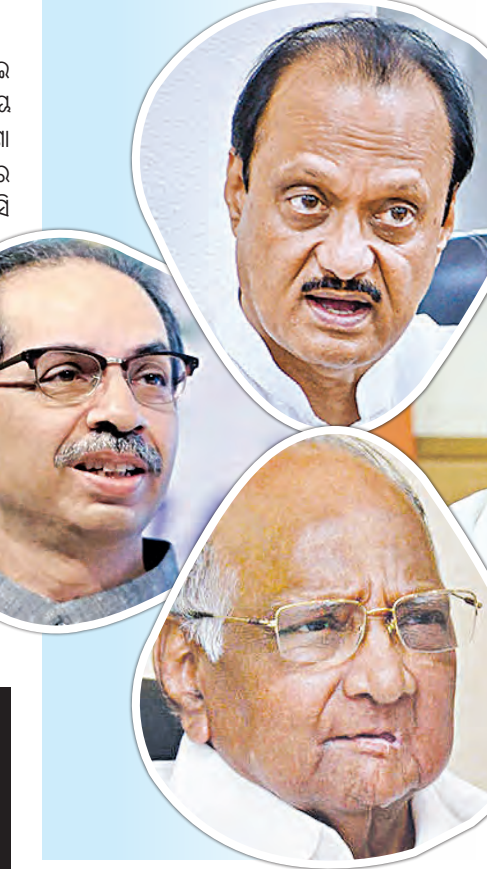
ରାଜନୀତିରେ ଏଭଳି ଘଟଣା ଦେଖିବାକୁ ମିଳିଥିଲା । ଶିବସେନାର ସିଦ୍ଧେ ଗୋଷ୍ଠୀ ଏବଂ ଏନ୍‌ସିପିର ପାଞ୍ଚାୟ

ଯଦି ସେ ନିଜ ଇଚ୍ଛାରେ କୌଣସି ରାଜନୈତିକ ଦଳକୁ ଛାଡ଼ିଯାଏ ତେବେ କୌଣସି ସ୍ୱାଧୀନ ସଦସ୍ୟ ରାଜନୈତିକ ଦଳରେ ସାମିଲ ହେଲେ, କୌଣସି ସଦସ୍ୟ ଦଳ ବିରୋଧରେ ଭୋଟ କଲେ, ନିଜ ଆଜ୍ଞା ମତଦାନରୁ ବିରତ ରହିଲେ, କୌଣସି ରାଜନୈତିକ ଦଳରେ ସାମିଲ ହେଲେ ନିର୍ବାଚିତ ପ୍ରତିନିଧିଙ୍କୁ ଅଯୋଗ୍ୟ ଘୋଷଣା କରାଯାଇପାରିବ ।