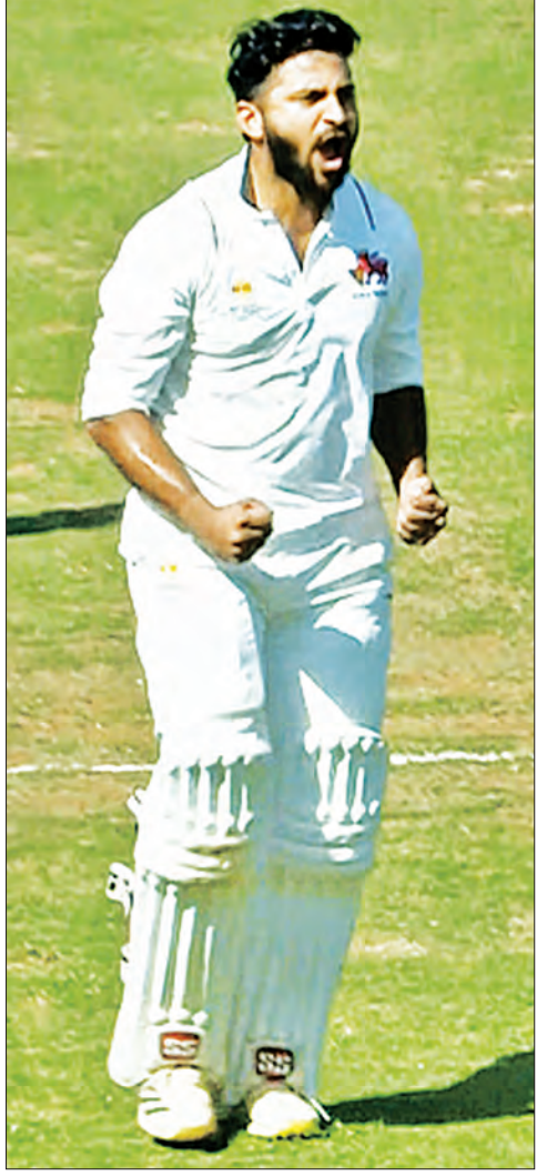
ମୁମ୍ବାଇ, ୩୩ (ଏକେଡ଼ି)

ରଣଜୀ ଟ୍ରଫି ସେମିଫାଇନାଲ ରବିବାର ଦିନ ଦିବସରେ ପହଞ୍ଚିଛି। ସ୍ଥାନୀୟ ବାକ୍ସା କ୍ଲବ୍ କମ୍ପେକ୍ସରେ ଚାଲିଥିବା ଚାମିଲନାଟୁ ବିପକ୍ଷ ଦ୍ୱିତୀୟ ସେମିଫାଇନାଲରେ ମୁମ୍ବାଇ ପ୍ରଥମ ପାଳିରେ ଅଗ୍ରଣୀ ହାସଲ କରିଛି। ଟପ୍ କିଟି ଚାମିଲନାଟୁ ପ୍ରଥମ ପାଳିରେ ୨୪.୧ ଓ ୨୫.୨ ରନ କରି ଅଲଆଉଟ ହୋଇଥିଲା। ଜବାବରେ ମୁମ୍ବାଇ ପ୍ରଥମ ପାଳି ଆରମ୍ଭ କରି ଦ୍ୱିତୀୟ ଦିନ ଖେଳ ଶେଷ ସୁଦ୍ଧା ୧୦୦ ଓଭରରେ ୯ ଓଭେଟ୍ ହରାଇ ୩୫୩ ରନ ସଂଗ୍ରହ କରିଛି। ଫଳରେ ମୁମ୍ବାଇ ୨୦୭ ରନର ଅଗ୍ରଣୀ ହାସଲ କରିଥିଲା। ଷ୍ଟମ୍ପ ଅପସାରଣ ବେଳକୁ ଡବ୍ଲୁ କୋଟିଆର୍ ୭୪ ଓ ଡବ୍ଲୁ ବେଶପାଣ୍ଡେ ୧୭ ରନ କରି ଅପରାଜିତ ରହିଛନ୍ତି।