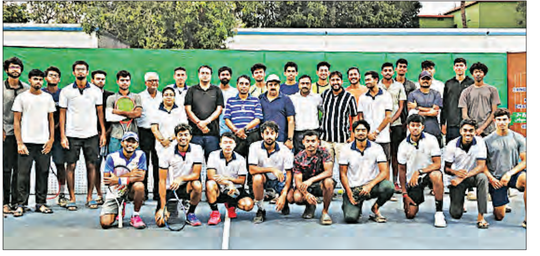
ଭୁବନେଶ୍ୱର, ୩୩ (ସମିପ)

ମେଜର ସମାପ ମହାପାତ୍ର ସ୍ମାରକୀ ଟେନିସ ପ୍ରତିଯୋଗିତା ସର୍ବଭାରତୀୟ ଟେନିସ ପ୍ରତିଯୋଗିତା ରବିବାର ଉଦ୍‌ଘାଟିତ ହୋଇଛି। ଗୁରୁକୁଳ ଟେନିସ ରିଭର୍ସ ଓ କର୍ଣ୍ଣ କୁର୍ ପରିସରରେ ଯୋଗବାରତରୁ ଖେଳାୟିତାଙ୍କୁ ଥିବା ଏହି ସର୍ବଭାରତୀୟ ପ୍ରତିଯୋଗିତାକୁ ଅବସରପ୍ରାପ୍ତ ପ୍ରଶାସନିକ ଅଧିକାରୀ