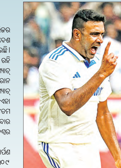
ଟେଷ୍ଟ ପୂର୍ବରୁ ଅର୍ଦ୍ଧନ ତାଙ୍କ ଜାତୀୟମନ୍ତ୍ର କ୍ୟାରିୟରରେ ହାସଲ କରିଥିବା କିଛି ରେକର୍ଡ୍ ଉପରେ ନଜର ପକାଇବା ।

ଘରୋଇ ଭାରତ ଓ ଇଂଲଣ୍ଡ ମଧ୍ୟରେ ଚାଲିଥିବା ଟେଷ୍ଟ ସିରିଜର ଅନ୍ତିମ ତଥା ୫ମ ମ୍ୟାଚ୍ ମାର୍ଚ୍ଚ ୬ରୁ ସ୍ଥାନୀୟ ହିମାଚଳ ପ୍ରଦେଶ କ୍ରିକେଟ୍ ଆସୋସିଏସନ ଷ୍ଟାଡ଼ିୟମରେ ଆରମ୍ଭ ହେବାକୁ ଯାଉଛି । ରୋହିତ୍ ଶର୍ମାଙ୍କ ନେତୃତ୍ୱାଧୀନ ଭାରତ ୩-୧ରେ ଅଣ୍ଟେଲିଆ ରହି ସିରିଜକୁ ଆଗ୍ରା କବ୍ଜା କରିନେଇଛି । ଟେଷ୍ଟ ଏହି ମ୍ୟାଚ୍ ଭାରତୀୟ ଦୃଷ୍ଟିରୁ ଗୁରୁତ୍ୱ ହରାଇଛି । ଚେଚେ ରେଟେରାନ ଭାରତୀୟ ସ୍କିନର ରବିଚନ୍ଦ୍ର ଅର୍ଦ୍ଧନଙ୍କ ପାଇଁ ଏହି ମ୍ୟାଚ୍ ମାଇଲଖୁଣ୍ଟ ହେବାକୁ ଯାଉଛି । ଟେଷ୍ଟ କ୍ରିକେଟ୍‌ରେ ଅର୍ଦ୍ଧନଙ୍କ ଏହା ହେବ ୧୦୦ତମ ମ୍ୟାଚ୍ । ବିଶ୍ୱର ୬୭ତମ ଓ ଭାରତର ୧୪ତମ ଖେଳାଳି ଭାବେ ଅର୍ଦ୍ଧନ ୧୦୦ତମ ଟେଷ୍ଟ ମ୍ୟାଚ୍ ଖେଳିବାର ସୌଭାଗ୍ୟ ଲାଭ କରିବେ । ଶେଷ ଭାରତୀୟ ଭାବେ ଚେଚେର ପୂଜାରୀ ଏହି ମାଇଲଖୁଣ୍ଟ ଛୁଇଁଥିଲେ । ୨୦୧୧ରେ ଝେଣ୍ଡିକଣ୍ଡି ବିପକ୍ଷରେ ଖେଳି ଟେଷ୍ଟ ପଦାର୍ପଣ କରିଥିବା ଅର୍ଦ୍ଧନ ବର୍ତ୍ତମାନ ୯ ଟେଷ୍ଟରେ ୧୪୦ ପାଳିରୁ ୩୩୦୯ ରନ ସଂଗ୍ରହ କରିଛନ୍ତି । ଯେଉଁଥିରେ ୫ ଶତକ ଓ ୧୪ ଅର୍ଦ୍ଧଶତକ ସାମିଲ ରହିଛି । ସେହିଭଳି ୩୬ ବର୍ଷୀୟ ଏହି ଚେଚେରାନ ସ୍କିନରଙ୍କ ନାମରେ ଟେଷ୍ଟରେ ୫୦୬ ଡିକେଟ୍ ଲିପିବଦ୍ଧ ରହିଛି । କପିଳ ଦେବ (୫୨୪୮ ରନ ଓ ୪୩୩ ଡିକେଟ୍)ଙ୍କ ପରେ ଅର୍ଦ୍ଧନ ଦେଶର ୨ୟ ଅଲରାଉଣ୍ଡର ଭାବେ ଟେଷ୍ଟରେ ୩୦୦୦ ରନ ସହ ୩୦୦ରୁ ଉର୍ଦ୍ଧ୍ୱ ଡିକେଟ୍ ନେବାର ସୌଭାଗ୍ୟ ଲାଭ କରିଛନ୍ତି । ୧୦୦