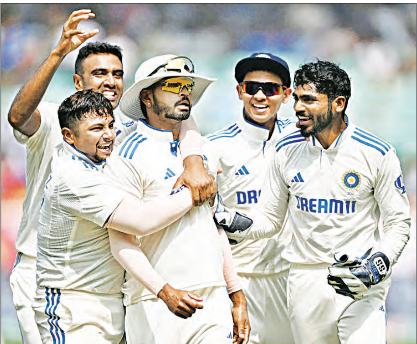
ବିଶ୍ୱ ଟେଷ୍ଟ ଚାମ୍ପିଅନସିପ୍ ପଏଣ୍ଟ ସାରଣୀ

ବିଶ୍ୱ ଟେଷ୍ଟ ଚାମ୍ପିଅନସିପ୍ରେ ଗୋଟିଏ ବିଜୟ ଲାଭି ୧୨, ଟାଇ ଲାଭି ୬ ଓ ଅମାତ୍ୟସିତ ଲାଭି ୪ ପଏଣ୍ଟ