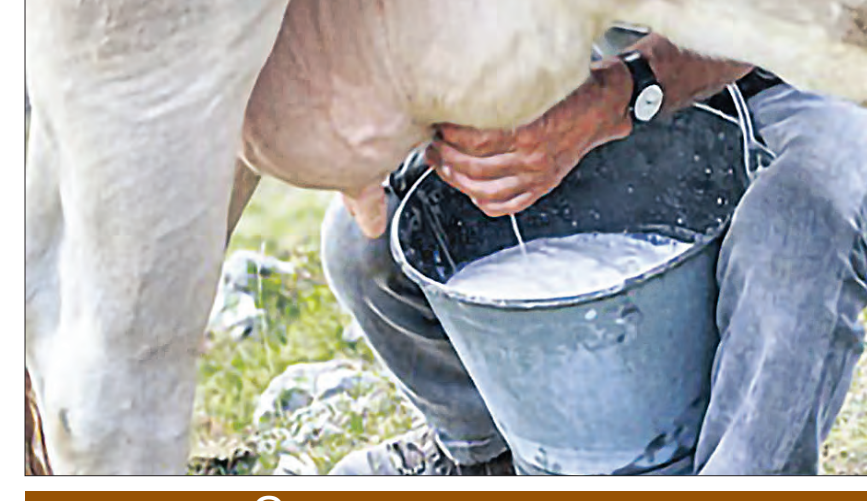
ଅଣଓଡିଆଙ୍କ କବ୍ଜାରେ ଗୋଷାଦ୍ୟ ଦର

ତାଳଚେର, ଗାମ୍ବା(ସମିପ) ବକାରରେ ଗୋଷାଦ୍ୟ ଦର ହୁ ହୁ ହୋଇ ବହୁଥିବାବେଳେ ସେହି ଅନୁପାତରେ ଦୁଗ୍ଧ ଦର ବହୁନଥିବାରୁ ତାଳଚେର ଦୁଗ୍ଧଚାଷୀମାନେ ଏବେ କ୍ଷତି ସହୁଛନ୍ତି। ତେଣୁ ଗାଁ ଗହଳରେ ଥିବା ଦୁଗ୍ଧଚାଷୀଙ୍କ ସାଥୀକୁ ଦୃଷ୍ଟିରେ ରଖି ଦୁଗ୍ଧ ଦର ବୃଦ୍ଧି ପାଇଁ ଦୁଗ୍ଧ ଚାଷୀମାନଙ୍କ ପକ୍ଷରୁ ଦାବି କରାଯାଇଛି। ଦୀର୍ଘଦିନ ହେଲା ଓପପେଟ୍ ଦୁଗ୍ଧଦର ବୃଦ୍ଧି କରୁନାହିଁ। ଚାଷୀଙ୍କ ଠାରୁ ଲିଟର ପିଛା ୩୫ ରୁ ୪୦ ଟଙ୍କା ମଧ୍ୟରେ କିଣି ଲୋକଙ୍କୁ ୫୨ ଟଙ୍କାରେ ବିକ୍ରି କରୁଛି। ତେବେ ସଂଖ୍ୟାଧିକ ଚାଷୀଙ୍କ ଦୁଗ୍ଧ ଦର ଲିଟର ପ୍ରତି ୩୫ ଟଙ୍କାକୁ କମ ରହୁଥିବାରୁ ଚାଷୀମାନେ ଏବେ ଘରୋଇ କମ୍ପାନୀ ମୁହାଁ ହୋଇଛନ୍ତି। ଓପପେଟ୍ ଯେତିକି ଦରରେ ଦୁଗ୍ଧ କିଣି ଘରୋଇ କମ୍ପାନୀମାନେ ତାହାଠାରୁ ଲିଟର ପ୍ରତି ପ୍ରାୟ ୨୯ଟଙ୍କା ଅଧିକ ଦରରେ କିଣି ଚାଷୀଙ୍କୁ ନିଜ ଆଡ଼କୁ ଟାଣୁଛନ୍ତି। କେତେକ ଘରୋଇ ଦୁଗ୍ଧ ବେପାରୀ ଲିଟର ପ୍ରତି ସରକାରୀ ଦର ଠାରୁ ୪/୫ ଟଙ୍କା ଅଧିକ ଦେଉଛନ୍ତି। ଦୁଗ୍ଧଚାଷୀମାନଙ୍କ ଲାଗି ସବୁଠାରୁ ବଡ଼ ସମସ୍ୟା ହୋଇଛି ଗୋଷାଦ୍ୟ ଦର ହୁ ହୁ ହୋଇ ବଢ଼ିବା। ସରକାରୀ ଗୋଷାଦ୍ୟ କାରଖାନା ବନ୍ଦହୋଇ ଯିବାପରେ