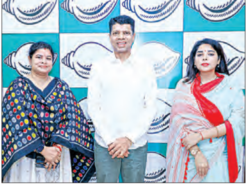
ଟିକଟ ପାଇବା ପରେ ନବୀନ ନିବାସରେ ମୁଖ୍ୟମନ୍ତ୍ରୀ ନବୀନ ପଟ୍ଟନାୟକ ଓ 'ନବୀନ ଓଡ଼ିଶା ଅଧ୍ୟକ୍ଷ' କାର୍ତ୍ତିକ ପାଣିଆନଙ୍କୁ ଭେଟୁଛନ୍ତି ଦଳୀୟ ନେତା