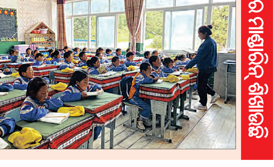
ଶିଶୁଙ୍କୁ ତିବତୀୟ ବଦଳରେ ମାଣ୍ଡାରିନ ଶିକ୍ଷାରେ

ବିଶେଷକରି ଅନୁଯାୟୀ ଚୀନ ତିବତୀୟ ସାମାଜିକ କ୍ଷମତାକୁ ହ୍ରାସ କରିବା ପାଇଁ ଶିକ୍ଷାକୁ ଅଧିକ ଭାବେ ବ୍ୟବହାର କରୁଛି । କେହି ଏହାକୁ ବିରୋଧ କରିପାରିବେ ନାହିଁ । ବିଦେଶୀ ମାନବାଧିକାର ସଂଗଠନଗୁଡ଼ିକ ଦକ୍ଷିଣ ହେଲା ତିବତରେ ଚୀନ ଚଳାଇଥିବା ଆମାନବାୟ କାର୍ଯ୍ୟକଳାପକୁ ପ୍ରଘଟ୍ କରିଥିଲା । କିନ୍ତୁ କିଛି ବର୍ଷ ହେଲା ଏପରି ଆଉ ହେଉନାହିଁ । ଚୀନର ଉନ୍ନତ-ପଶ୍ଚିମ କ୍ଷେତ୍ରର ଶିଳ୍ପିଆଙ୍କ ପ୍ରଦେଶରେ ଉଚ୍ଚତର