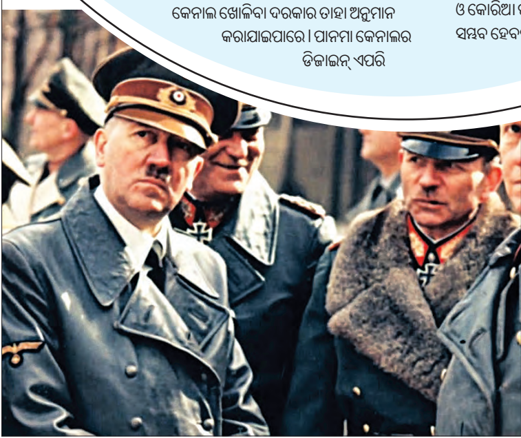
ଆଦେଶରେ ସିଦ୍ଧାନ୍ତର ଦିଆଯାଇ ପାରିବି ଆମେରିକାରେ ।

କେନାଲକୁ ଉପରକୁ ଚୋକିକରି ଗୋଟିଏ ସ୍ତରକୁ ଅନ୍ୟ ସ୍ତରକୁ ନିଆଯାଏ । ଜାହାଜ ପ୍ରଥମେ ଗୋଟିଏ ଜଳ ସ୍ତରର ଲକ୍ଷ୍ୟକୁ ପ୍ରଦେଶ କରେ । ତାପରେ କେନାଲର ସେହି ସ୍ତରର ଆଗ ଓ ପଛ ଲକ୍ଷ୍ୟ କରିବି ଆକାଶ ପାଣି ସେତେବେଳେ ଯାଏ ଡକାଯାଏ ଯେପରି ଜଳସ୍ତର ଆଗରେ ଉଚ୍ଚରେ ଥିବା ଲକ୍ଷ୍ୟର ସମାନ ସ୍ତରରେ ପହଞ୍ଚିବ । ତା'ପରେ ଆଗ ଲକ୍ଷ୍ୟ ଖୋଲାଇବା ଓ ଜାହାଜ ଅଗ୍ରସର ହୁଏ । ସମୁଦ୍ର ଜଳ ପତ୍ନ କରି କେନାଲର ଜଳ ସ୍ତର ବଦଳାଇବା ପାଇଁ ବିଦ୍ୟୁତ୍ ସେତୁ ପାଇଁ ବହୁତ ବଡ଼ ଏକକ ଯୋଗ୍ୟ ଦରକାର ଯାହା ଅତ୍ୟନ୍ତ ବ୍ୟୟଭାରୀ । ତେଣୁ କେନାଲ ତିଆରି କରାଯାଇପାରେ ଥିବା କେନାଲର ପରିସର ଅଧିକ ଉଚ୍ଚରେ ଥିବା ବର୍ଷାକଳରେ ପୂର୍ଣ୍ଣଗର୍ଭା ନଦୀ ଓ ହ୍ରଦ ମଧ୍ୟରୁ ପାନୀନ ଯୋଗୁଁ ଯୋଗ୍ୟ ଅଣାଯାଇ କେନାଲ ଜଳ ସ୍ତରକୁ ବଦଳାଇଥାଏ । ଆମେରିକାର ୪୦% କାର୍ଗୋ ପାନୀନ ଦେଇ ସରବରାଜ କରାଯାଇଥାଏ । କଳକାରୀ ପରିବହନ, ଅନାବୃତ୍ତ କାରଖାନା ପାନୀନକୁ ଜଳ ଯୋଗାଉଥିବା ପ୍ରାୟ ୫୦୦ ନଦୀ ଓ ହ୍ରଦ ଯଦି ଶୁଷ୍କ ହୋଇଯାଆନ୍ତି ତେବେ ପାନୀନ କେନାଲ ଦେଇ କାର୍ଗୋ ଷିପ୍ ଚଳାଚଳ ବନ୍ଦ ହୋଇଯିବ । ଆମେରିକା କରାଯାଉଛି । ଯଦି ସେପରି ସଙ୍କଟ ଆସେ ତେବେ ଆମେରିକାର ପଶ୍ଚିମ ଉପକୂଳ ସହ ଯୁକ୍ତରାଷ୍ଟ୍ର ଜଳପଥରେ ଯାତ୍ରା କି ମାଲ ପ୍ରେରଣ ଆପାତତଃ ଅସମ୍ଭବ ହୋଇପଡ଼ିବ । କାରଣ ସେଥିପାଇଁ ଜାହାଜକୁ ଅଧିକ ବ୍ୟୟ ହେବ । କିଲୋମିଟର ସମୁଦ୍ରଯାତ୍ରା କରିବାକୁ ପଡ଼ିବ ଓ ସେଥିପାଇଁ ଜାହାଜର ଆକାର ଓ ପ୍ରକାର ଅନୁଯାୟୀ ଯୋଗ୍ୟ ବ୍ୟୟ ଯାଏ ଅଧିକ ସମୟ ଲାଗିବ । ଯୁକ୍ତରାଷ୍ଟ୍ର ମାଲ ପାନୀନ ଦେଇ ସହଜରେ ଯେପରି ଚୀନ, ଜାପାନ ଓ କୋରିଆ ପହଞ୍ଚିପାରୁଛି ତାହା ସମ୍ଭବ ହେବ ନାହିଁ ।