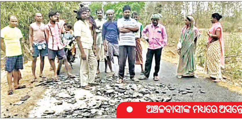
ଅଞ୍ଚଳବାସୀଙ୍କ ମଧ୍ୟରେ ଅସନ୍ତୋଷ

ଠିକାଦାର ନିମ୍ନମାନର ରାସ୍ତା ନିର୍ମାଣ କରି ଲକ୍ଷାଧିକ ଟଙ୍କା ହତୁଡ଼ କରିଥିବାର ଅଭିଯୋଗ ଆସିଛି ଆଠଗଡ଼ ବ୍ଲକ ରାଧାକିଶୋରପୁର ପଞ୍ଚାୟତ ସତ୍ୟଜିତ ଗ୍ରାମ ରାସ୍ତାରେ । ରାଧାକିଶୋରପୁର ମହାପୁର ରାସ୍ତାର ସତ୍ୟଜିତ ଗ୍ରାମ ଠାରୁ ପାଦପଥର ପର୍ଯ୍ୟନ୍ତ ରାସ୍ତାର ନିର୍ମାଣ କାର୍ଯ୍ୟରେ ଏଭଳି ନିମ୍ନମାନର କାମ ହୋଇଛି ଯେ ରାସ୍ତା ଉପରୁ ପିଚୁ ଉଠି ଯାଉଥିବା ଦେଖିବାକୁ ମିଳୁଛି । ଆଠଗଡ଼ ଗ୍ରାମ୍ୟ ଉନ୍ନୟନ ବିଭାଗ ପକ୍ଷରୁ ହେଉଥିବା ୮୦୦ ମିଟରର ଏହି ରାସ୍ତା ପାଇଁ ୧୭ ଲକ୍ଷ ଟଙ୍କା ବ୍ୟୟବରାଦ କରାଯାଇଛି । ଟେଣ୍ଡର ପ୍ରକ୍ରିୟା