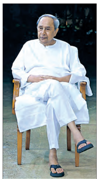
'୫-ଟି' ଅଧ୍ୟକ୍ଷ କାର୍ଯ୍ୟକ୍ରମ ପାଇଁ ଆନୁଷ୍ଠାନିକ ପ୍ରଣାଳୀ ଉପସ୍ଥିତ ସାଂସଦ, ବିଧାନସଭା, ଜିଲ୍ଲା ସଭାପତି, ପର୍ଯ୍ୟବେକ୍ଷକଙ୍କ ସହ ବରିଷ୍ଠ ନେତା ସାମିଲ

■ ଭୁବନେଶ୍ୱର, ୨୧ ମାର୍ଚ୍ଚ (ସମ୍ପାଦନା): ଆଗାମୀ ଲୋକସଭା ଓ ବିଧାନସଭା ନିର୍ବାଚନ ନିମନ୍ତେ ବିଜେଡି ଚଳେ ପୂର୍ବରୁ ପ୍ରସ୍ତୁତି ଆରମ୍ଭ କରି ସାରିଛି । ଦଳର ଜିଲ୍ଲା, ବ୍ଲକ୍, ପଞ୍ଚାୟତ ସଭାପତି ତଥା ଦଳୀୟ ପର୍ଯ୍ୟବେକ୍ଷକମାନେ ନିଜ ନିଜ କାର୍ଯ୍ୟରେ ଲାଗି ପଡ଼ିଛନ୍ତି । ଏହି କ୍ରମରେ ଦଳର ସଭାପତି ତଥା ମୁଖ୍ୟମନ୍ତ୍ରୀ ନବୀନ ପଟ୍ଟନାୟକ ବିଭିନ୍ନ ଲୋକସଭା ଓ ବିଧାନସଭା ନିର୍ବାଚନମଣ୍ଡଳରେ ନିର୍ବାଚନ ପ୍ରସ୍ତୁତିର ତନ୍ତନ୍ତ ସମାକ୍ଷୀ କରୁଛନ୍ତି । ଏହି କ୍ରମରେ ଗୁରୁବାର ୪ଟି ପର୍ଯ୍ୟାୟରେ ବୁଝପୁର, ଆସ୍ତା, ଭୁବନେଶ୍ୱର ଓ କନ୍ଧମାଳ ଲୋକସଭା କ୍ଷେତ୍ର, ଏହା ଅନ୍ତର୍ଗତ ୨୮ ବିଧାନସଭା ଆସନରେ ନିର୍ବାଚନ ପ୍ରସ୍ତୁତିର ଅନୁଧ୍ୟାନ କରିଛନ୍ତି ଦଳର ସଭାପତି ତଥା ମୁଖ୍ୟମନ୍ତ୍ରୀ ନବୀନ ପଟ୍ଟନାୟକ । ଆଜିର ୪ ଲୋକସଭା ଆସନକୁ ମିଶାଇ ୩ ଦିନରେ ୮ ଲୋକସଭା ଓ ୫୬ ବିଧାନସଭା କ୍ଷେତ୍ରର ସମାକ୍ଷୀ କରିଛନ୍ତି ମୁଖ୍ୟମନ୍ତ୍ରୀ ।