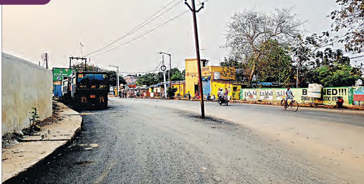
ବଡ଼ଗଡ଼ରୁ ଟଙ୍କପାଣି ରାସ୍ତା (୨)