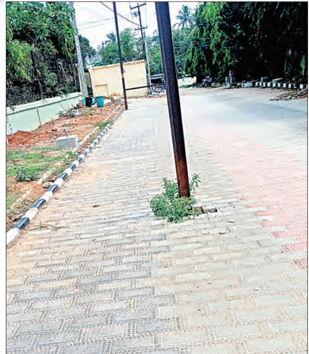
ଭୁବନେଶ୍ୱର-୩ ପିଏମ୍‌ସି ଅଫିସ୍ ରାସ୍ତା