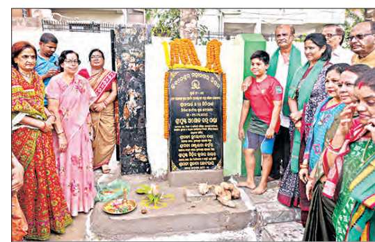
ବ୍ୟବସ୍ଥା କରାଯାଇଛି। ଉକ୍ତ ପାର୍କ ସହରବାସୀଙ୍କୁ ଆମୋଦପ୍ରମୋଦର ଏକ ଅଧିକର ଭେଟି ଦେବ ବୋଲି ଅଭିପ୍ରାୟରେ ମତଦାୟକ କରିଛନ୍ତି।