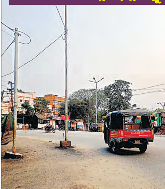
ବଡ଼ଗଡ଼ରୁ ଟଙ୍କପାଣି ରାସ୍ତା (୧)