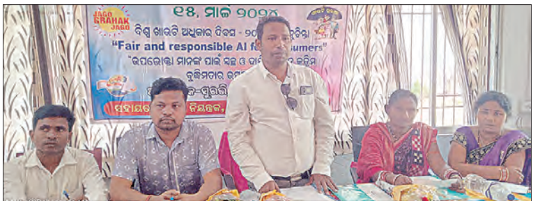
୧୫ ମାର୍ଚ୍ଚ ୨୦୨୪: ବିଶ୍ୱ ଉପଭୋକ୍ତା ଅଧିକାର ଦିବସ ପାଳିତ ହୋଇଛି। ଉପଭୋକ୍ତା ଅଧିକାର ଦିବସ ପାଳିତ ହୋଇଛି। ଉପଭୋକ୍ତା ଅଧିକାର ଦିବସ ପାଳିତ ହୋଇଛି।

ବୌଦ୍ଧ ବିଶ୍ୱ ବିଜ୍ଞାନ କାର୍ଯ୍ୟାଳୟର ସହାୟତାରେ ବାଉଁଶୁଣୀ ସ୍ଥିତିରେ ଉପଭୋକ୍ତା ଅଧିକାର ଦିବସ ପାଳିତ ହୋଇଛି। ବୌଦ୍ଧ ବିଶ୍ୱ ବିଜ୍ଞାନ କାର୍ଯ୍ୟାଳୟର ସହାୟତାରେ ବାଉଁଶୁଣୀ ସ୍ଥିତିରେ ଉପଭୋକ୍ତା ଅଧିକାର ଦିବସ ପାଳିତ ହୋଇଛି।