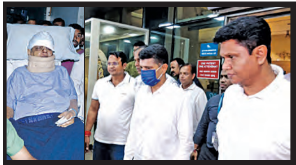
ରେଡ୍‌କ୍ରୋସ୍‌ରେ ଲୁହାପକ ଛକରେ ଚ୍ୟାକର୍-କାର୍‌ଧକ୍ ସମ୍ବଲପୁରରୁ ଏୟାରଲିଫ୍ଟରେ ଅଣାଗଲା ଭୁବନେଶ୍ୱର ପ୍ରସନ୍ନ ଆଚାର୍ଯ୍ୟ ଆରୋଗ୍ୟ କାମନା କଲେ ମୁଖ୍ୟମନ୍ତ୍ରୀ ଡାକ୍ତରଖାନାରେ ଭେଟିଲେ ପାଣ୍ଡିଆନ ଓ ପ୍ରଶଂସା ପ୍ରକାଶ

ଅପରାହ୍ନରେ ଏହି ଦୁର୍ଘଟଣାରେ କାର୍ତ୍ତବୀର ସମ୍ବଲପୁର-ଅନୁଗୋଳ ଜାତୀୟ ରାଜପଥର ରେଡ୍‌କ୍ରୋସ୍‌ରେ ଲୁହାପକ ଲୋକେସନରେ ଏକ ଦୁର୍ଘଟଣାରେ ପ୍ରସନ୍ନ ଆଚାର୍ଯ୍ୟ ଗୁରୁତର ହୋଇଛନ୍ତି । ଗୁରୁତର ହୋଇଥିବା ଆଚାର୍ଯ୍ୟଙ୍କୁ ସମ୍ବଲପୁର ଡାକ୍ତରଖାନାରେ ଭର୍ତ୍ତିକରାଯାଇଛି ।