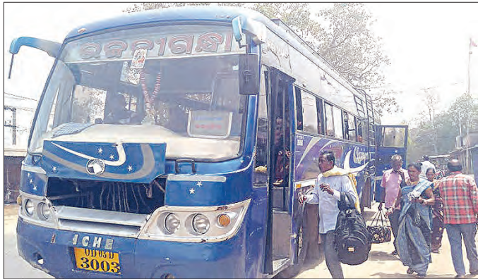
ବିଭିନ୍ନ ସ୍ଥାନକୁ ଯାତ୍ରାରେ ବସରେ ସୋନପୁରର ରୁକ୍ ଛକରେ ପ୍ରବଳ ଭିଡ୍ ହେଉଛି। ଏଠାରେ ଯାତ୍ରୀ ପ୍ରତୀକ୍ଷାଳୟ ନିର୍ମାଣ ହୋଇ ପାରୁ ନାହିଁ।

ସୋନପୁର ସହରରେ ଶତାଧିକ ଶୁକ୍ଳ ଟିଆରି ହୋଇଛି। ବହୁତଳ ବିଶିଷ୍ଟ ଅତିଥି ନିର୍ମାଣ ହୋଇ ପାରୁଛି। ତେବେ କନସ୍ଟ୍ରକ୍ସନ୍ ଆବଶ୍ୟକତାକୁ ଦୃଷ୍ଟିରେ ରଖି ଯାତ୍ରୀ ପ୍ରତୀକ୍ଷାଳୟ ନିର୍ମାଣ ହୋଇ ପାରୁନାହିଁ।