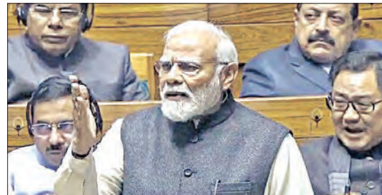
ନିର୍ବାଚନ ପରେ ନ ଥିବେ ବିରୋଧୀ; ଗ୍ୟାଲେରିରେ ବସିବେ ଦର୍ଶକ ବିରୋଧୀଙ୍କ ଆଜିର ସ୍ଥିତି ପାଇଁ କଂଗ୍ରେସ ଦାୟୀ

ପ୍ରଧାନମନ୍ତ୍ରୀ ନରେନ୍ଦ୍ର ମୋଦୀ ସୋମବାର ଲୋକସଭାରେ ରାଷ୍ଟ୍ରପତି ଡ୍ରୌପଦୀ ମୁର୍ମୁଙ୍କ ଅଭିବାଦନା ଉପରେ ଧନ୍ୟବାଦ ଦେଇଛନ୍ତି।