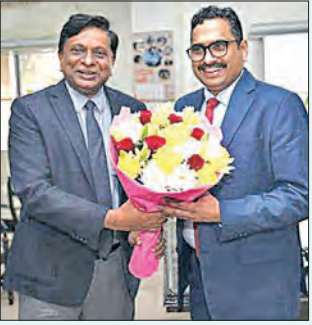
ନୂଆଦିଲ୍ଲୀ, ୫୧୨ (ଏକେଡି) : କେନ୍ଦ୍ର ସୂଚନା ଓ ପ୍ରସାରଣ ମନ୍ତ୍ରଣାଳୟର ସଚିବ ଭାବେ ଦାୟିତ୍ୱ ନେଲେ ସଞ୍ଜୟ ଜାଜୁ

ନୂଆଦିଲ୍ଲୀ, ୫୧୨ (ଏକେଡି) : କେନ୍ଦ୍ର ସୂଚନା ଓ ପ୍ରସାରଣ ମନ୍ତ୍ରଣାଳୟର ସଚିବ ଭାବେ ବରିଷ୍ଠ ସର୍ବ ଭାରତୀୟ ପ୍ରଶାସନିକ ଅଧିକାରୀ ସଞ୍ଜୟ ଜାଜୁ ସୋମବାର ଦାୟିତ୍ୱ ଗ୍ରହଣ କରିଛନ୍ତି।