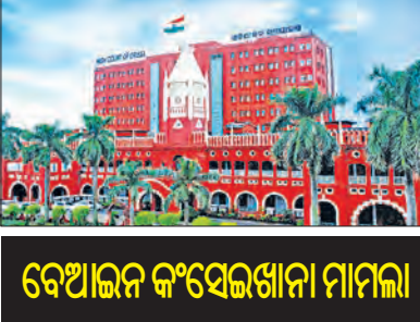
ବେଆଇନ କଂସେଇଖାନା ମାମଲା

ଅଭିଯୋଗିତା ତଥା ବେଆଇନ କଂସେଇଖାନା ଗୁଡିକକୁ ଦେହ ଲଗି କରାଯିବ ଆଦାୟ କରିଥିବା ଜଣାପଡିଛି। ପ୍ରକାଶପତ୍ରିକା ଓଡ଼ିଆ ବଜାର, ଦିୱାନ ବଜାର ଓ ହାତୀପୋଖରୀ ଆଦି କେତେକ ଅଞ୍ଚଳରେ ବେଆଇନ ଭାବେ ଗଢ଼ିଥିବା କଂସେଇଖାନାକୁ ସ୍ଥାନାନ୍ତର କରାଯାଇଛି। କଟକ ସହରରେ କଂସେଇଖାନା ଅଭାବ ଦୂର ପାଇଁ ଏଗୋଟି ନୂଆ କଂସେଇଖାନା ପ୍ରାମାଣ ପାଇଁ ଯୋଜନା ରହିଛି। ଏଥିପାଇଁ ସ୍ଥାନ ଚିହ୍ନଟ କରାଯାଇଛି ବୋଲି ହାଇକୋର୍ଟକୁ ସରକାରଙ୍କ ପକ୍ଷରୁ ଅବଗତ କରାଯାଇଛି। ଏହି ମାମଲାରେ କଟକ ମହାନଗର ନିଗମର ଡେପୁଟି ମ୍ୟାନିଜର ଓ ସାହାୟ ଅଧିକାରୀ ହାଇକୋର୍ଟରେ ଦାଖଲ କରାଯାଇଥିବା ହାଇକୋର୍ଟକୁ ସରକାରଙ୍କୁ ନିର୍ଦ୍ଦେଶ ଦେଇ ସିଏମସି ପକ୍ଷରୁ ପ୍ରକାଶ କରି