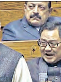
ନିର୍ବାଚନ ପରେ ନ ଥିବେ ବିରୋଧୀ; ଗ୍ୟାଲେରିରେ ବସିବେ ଦର୍ଶକ ବିରୋଧୀଙ୍କ ଆଜିର ସ୍ଥିତି ପାଇଁ କଂଗ୍ରେସ ଦାୟୀ

ପ୍ୟାନଟିଆରୋ, ୫୧୨ (ଏକେଡି) : ପୂର୍ବ ଆମେରିକାୟ ଦେଶ ଚିଲିରେ ଦକ୍ଷିଣ ଆମେରିକାୟ ଦେଶ ଚିଲିରେ କଟକଳ ହୁଡୁ ହୁଡୁ ହୋଇ କଳୁଛି।