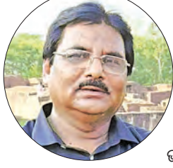
ବିଷୟ ଓଡ଼ିଆ ଭାଷା ସମ୍ବନ୍ଧୀୟ ସମସ୍ତ ଓଡ଼ିଆବାସୀଙ୍କ ସହିତ ମୁଁ ମଧ୍ୟ ଅନନ୍ତର ଓ ଗର୍ବ ଅନୁଭବ କରୁଛି ।