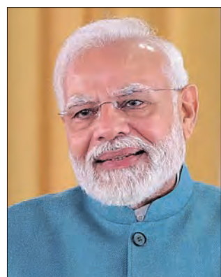
ଆଇଆଇଏମ୍ ସହ ଏକାଧିକ ପ୍ରକଳ୍ପର ହେବ ଲୋକାର୍ପଣ ଯୋଗଦେବେ ମୁଖ୍ୟମନ୍ତ୍ରୀ

■ ସମ୍ବଲପୁର/ଭୁବନେଶ୍ୱର, ୨୧ (ସମ୍ପାଦକ): ସମ୍ବଲପୁର ଆଇଆଇଏମ୍ ଶ୍ରୀ ଶ୍ରୀ କ୍ୟାମ୍ପସକୁ ଆସନ୍ତାକାଲି ପ୍ରଧାନମନ୍ତ୍ରୀ ନରେନ୍ଦ୍ର ମୋଦୀ ଆନୁଷ୍ଠାନିକ ଭାବେ ଲୋକାର୍ପଣ କରିବେ। ଏହି କାର୍ଯ୍ୟକ୍ରମରେ ରାଜ୍ୟପାଳ ରଘୁବର ଦାସ ଏବଂ ମୁଖ୍ୟମନ୍ତ୍ରୀ ନବୀନ ପଟ୍ଟନାୟକ ଯୋଗଦେବେ। ଶନିବାର ପୂର୍ବାହ୍ନରେ ଜନତା ମଇଦାନରେ ପ୍ରଥମ ବିଶ୍ୱ ଓଡ଼ିଆ ଭାଷା ସମ୍ମିଳନୀକୁ ଉଦ୍ଘାଟନ କରିବା ପରେ ମୁଖ୍ୟମନ୍ତ୍ରୀ ହେଲିକପ୍ଟର ଯୋଗେ ସମ୍ବଲପୁର ଅଭିମୁଖେ ଯାତ୍ରା କରିବେ। ଅପରାହ୍ନ ୧୪.୦୦ରେ ମୁଖ୍ୟମନ୍ତ୍ରୀ ସମ୍ବଲପୁରରେ ପ୍ରଧାନମନ୍ତ୍ରୀଙ୍କୁ ସ୍ୱାଗତ କରିବା ସହ ଆଇଆଇଏମ୍ ଉଦ୍ଘାଟନ ଏବଂ ଅନ୍ୟାନ୍ୟ କାର୍ଯ୍ୟକ୍ରମରେ ଯୋଗଦେବେ।