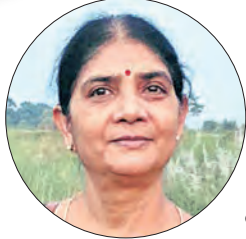
ପଦକ୍ଷେପ । ସମସ୍ତ ଓଡ଼ିଆବାସୀଙ୍କ ସହିତ ମୁଁ ମଧ୍ୟ ଅନନ୍ତର ଓ ଗର୍ବ ଅନୁଭବ କରୁଛି ।

ପ୍ରଥମ ବିଷୟ ଓଡ଼ିଆ ଭାଷା ସମ୍ବନ୍ଧୀୟ ଓଡ଼ିଆ ସରକାରଙ୍କ ପକ୍ଷରୁ ଏକ ଐତିହାସିକ ପଦକ୍ଷେପ । ସମସ୍ତ ଓଡ଼ିଆବାସୀଙ୍କ ସହିତ ମୁଁ ମଧ୍ୟ ଅନନ୍ତର ଓ ଗର୍ବ ଅନୁଭବ କରୁଛି । ବାସ୍ତବରେ ଏହା ଓଡ଼ିଆ ଭାଷାକୁ ସମ୍ମାନ ଦେବାରେ ଗୁରୁତ୍ୱପୂର୍ଣ୍ଣ କୁମ୍ଭୀର ଗ୍ରହଣ କରିବା ଜନସାଧାରଣଙ୍କ ମନରୁ ଅନନ୍ତରାଧିକାରୀ ଭାବେ ସ୍ୱୀକୃତି ଦେବା ପାଇଁ ଓ ସମ୍ମାନ ଦେବା ଆମ ସମସ୍ତଙ୍କର ନୈତିକ କର୍ତ୍ତବ୍ୟ । ଏହା ଏକାଦିକ୍ରମେ ସାହିତ୍ୟ ଓ ସଂସ୍କୃତିକୁ ସମୃଦ୍ଧ କରିବ ।