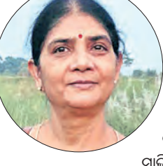
ପଦକ୍ଷେପ । ସମସ୍ତ ଓଡ଼ିଶାବାସୀଙ୍କ ସହିତ ମୁଁ ମଧ୍ୟ ଅନନ୍ଦିତ ଓ ଗର୍ବ ଅନୁଭବ କରୁଛି । ବାସ୍ତବରେ ଏହା ଓଡ଼ିଆ ଭାଷାକୁ ସମ୍ମାନ ଦେବାରେ ଗୁରୁତ୍ୱପୂର୍ଣ୍ଣ ଭୂମିକା ଗ୍ରହଣ କରିବ । ଜନସାଧାରଣଙ୍କ ମନରୁ ଅନିଚ୍ଛା ଦୂର କରିବା ସହିତ ସ୍ୱାଭିମାନ ଉତ୍ଥାପିତ କରିବ । ଓଡ଼ିଆ ଭାଷାକୁ ଭଲ ପାଇବା ଓ ସମ୍ମାନ ଦେବା ଆମ ସମସ୍ତଙ୍କର ନୈତିକ କର୍ତ୍ତବ୍ୟ । ଏହା ଏକାଦିକ୍ରମେ ସାହିତ୍ୟ ଓ ସଂସ୍କୃତିକୁ ସମୃଦ୍ଧ କରିବ ।