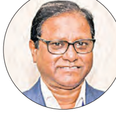
ଓଡ଼ିଆ ଭାଷା ଆମ ଅସ୍ଥିତ, ଆମ ପରିଚୟ । ଏହି ଭାଷା ଆମ ସଂସ୍କୃତି ଓ ପରମ୍ପରାର ଏକ ମୁଖ୍ୟ ଅଙ୍ଗ । ଦିନ ଥିଲା ଆମ କଳା-ଶିଳ୍ପ-ସ୍ଥାପତ୍ୟ

ମହା ବିଦ୍ୟାଳୟ ଏବଂ ବିଷୟ ବିଦ୍ୟାଳୟରେ ମାହା ଅନୁଷ୍ଠିତ ହେଉଛି ତାହା ଓଡ଼ିଆ ଭାଷା ସାହିତ୍ୟ ପାଇଁ ଏକ ସାମଗ୍ରୀୟ ପଦକ୍ଷେପ । ବିଶେଷତଃ ଓଡ଼ିଆ ଭାଷା ଏବଂ ସାହିତ୍ୟ କିପରି ଭାବରେ ବିଷୟ ପରିଚୟରେ ନିଜର ମାନ ରକ୍ଷା କରିପାରିବ ଏବଂ ତାର ପ୍ରଚାର ପ୍ରସାର ହୋଇପାରିବ ସେଥିପାଇଁ ଏହି ଉଦ୍ୟମ ଅତ୍ୟନ୍ତ ଉପକାରୀ ହେବ । ଓଡ଼ିଆ ଭାଷା ପ୍ରତି ଶିକ୍ଷିତ ସମ୍ପ୍ରଦାୟରେ ମଧ୍ୟେଷ ଆଗ୍ରହ, ପ୍ରୋତ୍ସାହନ ଏବଂ ତାର ବିକାଶ ପାଇଁ ଉଦ୍ୟମ ଲକ୍ଷ୍ୟ କର ନାହିଁ । ଆଜି ଏହି ଯୋଗ୍ୟ କାର୍ଯ୍ୟକ୍ରମକୁ ବିଭିନ୍ନ ଶିକ୍ଷାନୁଷ୍ଠାନ ମାନଙ୍କରେ ଅନୁଷ୍ଠିତ ହେଉଛି ତାହା ସମସ୍ତଙ୍କୁ ସଚେତନ କରିବ । ଓଡ଼ିଆ ଭାଷା ପରି ଏକ ଶାସ୍ତ୍ରୀୟ ଭାଷାର ମାନ୍ୟତା ସମଗ୍ର ବିଶ୍ୱବାସୀଙ୍କ ଆଗରେ ଉପସ୍ଥାପିତ କରିପାରିବ । ଓଡ଼ିଆର ସଂସ୍କୃତି ଓ ଓଡ଼ିଶାର ସାମାଜିକ ଅବିକଳତାକୁ ସମର୍ଥନ ଦେବା ପାଇଁ ବିଷୟରେ ପରିଚିତ ହାସଲ କରିଛି । ଓଡ଼ିଆ ଭାଷା ବିନେ ସମଗ୍ର ବିଷୟରେ ତାର ଯତ୍ନ ରଖିବ ଏହା ହିଁ ପୂର୍ଣ୍ଣ । ଓଡ଼ିଆ ଭାଷାର ସୁଦୀର୍ଘ ଐତିହ୍ୟକୁ ନିରାକ୍ଷଣ କଲେ ମନେ କାଣି ପାରିବ । ଓଡ଼ିଆ ଭାଷାର ବହୁ ପ୍ରାଚୀନ କାଳରୁ ସଂସ୍କୃତ ସାହିତ୍ୟରେ ମଧ୍ୟ ଓଡ଼ିଆ ଭାଷାରେ ମଧ୍ୟ ଅନୁପ୍ରବେଶ କରିଛି । ଉଚ୍ଚଶିକ୍ଷିତ ବ୍ୟକ୍ତିମାନେ ମଧ୍ୟ ବିଦେଶୀ ଭାଷା ଛାଡ଼ି ଓଡ଼ିଆ ଭାଷାକୁ ଆଦରକୁ ଏହାହିଁ କାମନା ।