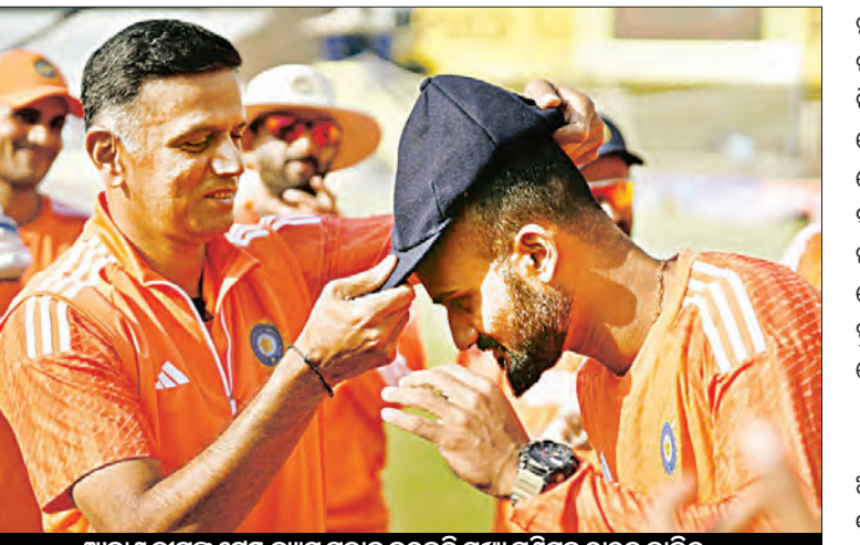
ଆକାଶ ଦାସଙ୍କୁ ଟେଷ୍ଟ କ୍ୟାପ୍ ପ୍ରଦାନ କରୁଛନ୍ତି ମୁଖ୍ୟ ପ୍ରଶିକ୍ଷକ ରାହୁଲ ଦ୍ରାବିଡ୍

ସେ କୁଲିଙ୍କୁ ବୋଲୁ କରିଥିଲେ ମଧ୍ୟ ତାହା ନୋ ବଲ୍ ଥିଲା । କିନ୍ତୁ ପରେ ତାଙ୍କୁ ପୁଣି ଥରେ ବୋଲୁ କରି ପ୍ୟାରଲିୟମ୍ ଫୋରାଏଥିଲେ । ଭାରତର ୩୩୯ତମ ଖେଳାଳି ଭାବେ ସେ ଟେଷ୍ଟ ଖେଳିଛନ୍ତି । ସେ ପଦାର୍ପଣ କରିବା ଅବସରରେ ତାଙ୍କ ମା' ଷ୍ଟାଡ଼ିୟମରେ ଉପସ୍ଥିତ ଥିଲେ । ମୁଖ୍ୟ କୋଚ୍ ରାହୁଲ ଦ୍ରାବିଡ୍ ମ୍ୟାଚ୍ ପୂର୍ବରୁ ତାଙ୍କୁ ଟେଷ୍ଟ କ୍ୟାପ୍ ପ୍ରଦାନ କରିଥିଲେ ।