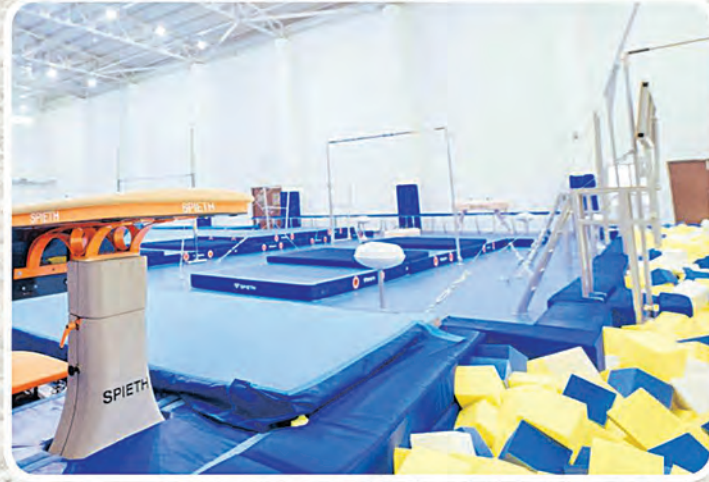
ଜିମ୍ନାଷ୍ଟିକ୍ ଏକାଡେମୀ, ରାଉରକେଲା