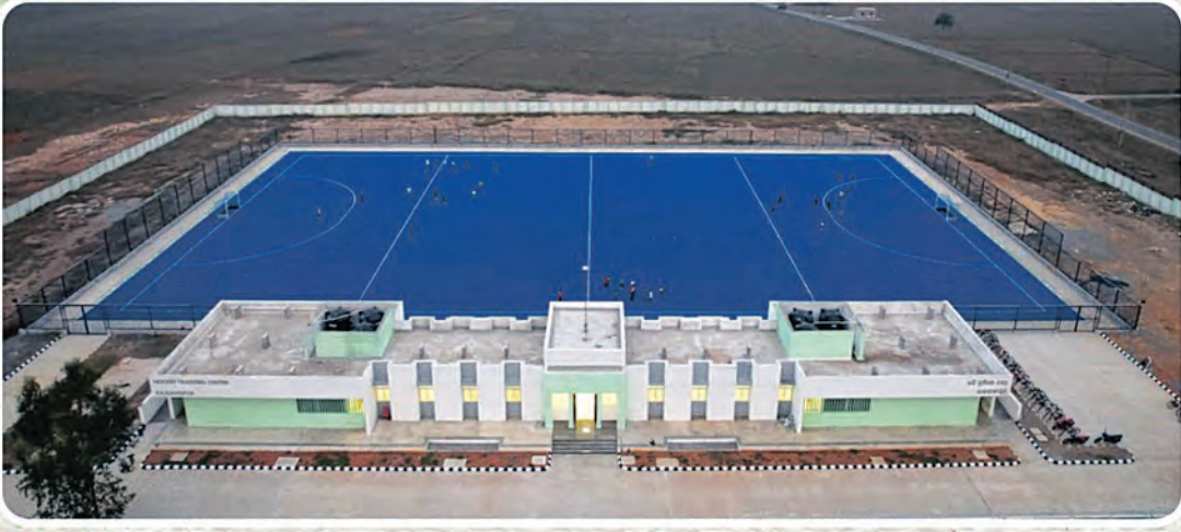
୧୨ଟି ହକି ପ୍ରଶିକ୍ଷଣ କେନ୍ଦ୍ର