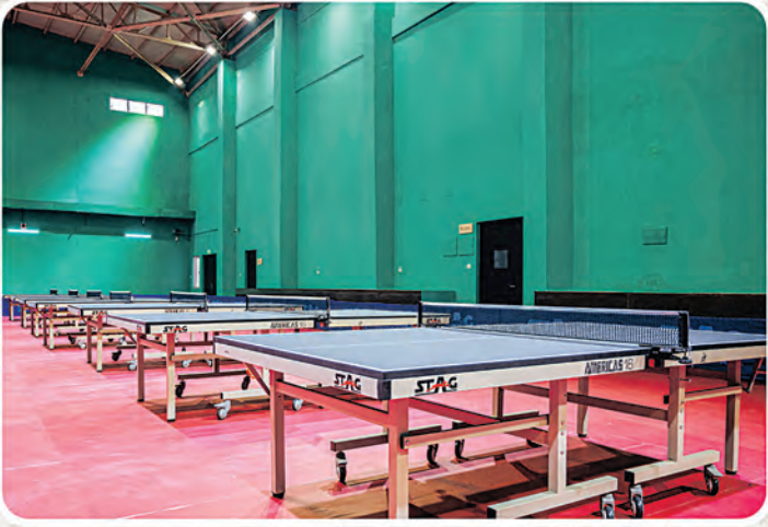
ଟେବୁଲ ଟେନିସ୍ ଏକାଡେମୀ, କଟକ