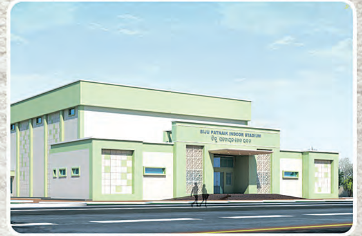
ବହୁମୁଖୀ ଇନ୍ଡୋର ଷ୍ଟାଡ଼ିୟମ ରେମୁଣା, ବାଲିଗୁଡ଼ା, କରଞ୍ଜିଆ ଓ ଚିଟିଲାଗଡ଼