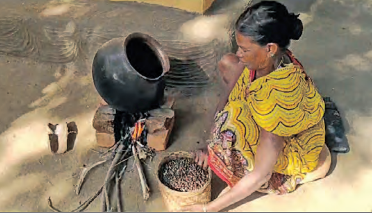
ଲୋକ ଏହି ବ୍ୟବସାୟ କରିବେ ବୋଲି ତେଲ ପାରମ୍ପରିକ ପଦ୍ଧତିରେ ପ୍ରସ୍ତୁତ କରାଯାଇଥିବା ଅସଲି ଜଡ଼ା ତେଲ ମଣିଷର ପ୍ରସ୍ତୁତ କରୁଥିବା ମହିଳା କହିଛନ୍ତି ।

ତେଲ ଅଳଗା ହୋଇ ଉପରେ ଭାସିଯାଇ ଥିବା ପାଣି ପକ୍ଷୀ ଥଣ୍ଡା ହେବା ପରେ ହାତରେ ତେଲକୁ ଅନ୍ୟ ଏକ ପତ୍ରରେ ବାହାର କରାଯାଏ । ପରେ ପୁଣି ସେହି ତେଲର ପାଣି ଅଂଶ ଶୁଖିବା ପାଇଁ ନିଆଁରେ ଅଳ୍ପ ସମୟ ପୁଟାଇ ଦିଆଯାଏ ।