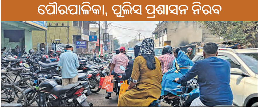
ପୌରପାଳିକା, ପୁଲିସ ପ୍ରଶାସନ ନିରବ

ଅନୁଗୋଳ ଜିଲ୍ଲା ତାଳଚେର ସହରକୁ ସ୍କୁଲ ଓ ସ୍କୁଲର ଚାଳକମାନେ ପାର୍କିଂ ସ୍ଥଳରେ ଯୋଗାଣ କରିବା ପାଇଁ ଚାହୁଁଛନ୍ତି।