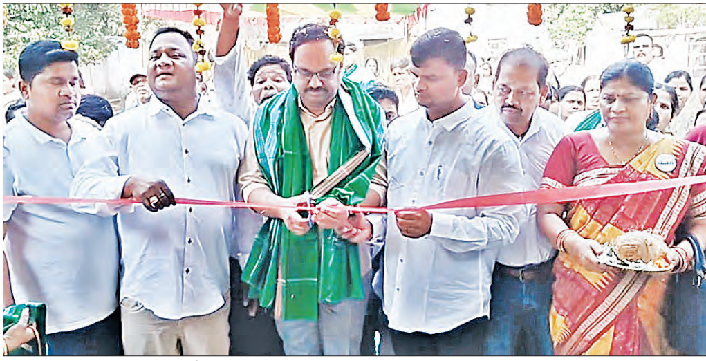
ବାଣପୁର, ୧୭ 1୨