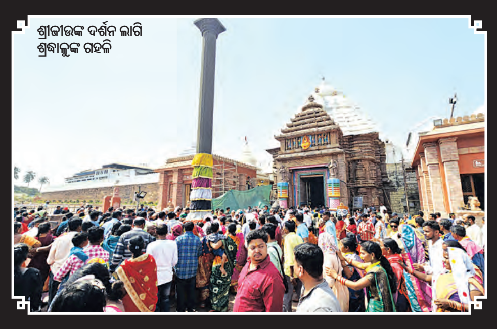
ଶ୍ରୀଜଗନ୍ନାଥଙ୍କୁ ଦର୍ଶନ କରିବା ପାଇଁ ଶ୍ରଦ୍ଧାଳୁଙ୍କ ଗହଳ

ରାଜି ଚଳନ୍ତି ପ୍ରତିମା ରାଧାକୃଷ୍ଣ, ମହାଲକ୍ଷ୍ମୀ ଓ ନାରାୟଣଙ୍କ ଅଷ୍ଟାଧାର ମୂର୍ଚ୍ଛି ଚୋରି ହୋଇଥିଲା। ସେହିପରି ନୂଆସୋମେଶ୍ୱରପୁର ଗ୍ରାମର ଆରାଧ୍ୟ ଶ୍ରୀ ଶ୍ରୀଗୋପାଳଦେବଙ୍କ ମନ୍ଦିରରୁ ହୁସୈନ୍‌ମାନେ ଗ୍ରାମର ଲକ୍ଷ୍ମଦେବୀ ମା' ଦୁର୍ଗାଙ୍କ ସମେତ ୭ଟି ଅଷ୍ଟାଧାର ମୂର୍ଚ୍ଛି ଚୋରି କରି ନେଇଛନ୍ତି। ଏ ପର୍ଯ୍ୟନ୍ତ ପ୍ରାୟ ସବୁ ମୂର୍ଚ୍ଛି ଚୋରି ଘଟଣାର ପର୍ଯ୍ୟାୟ ହୋଇ ନ ଥିବାବେଳେ ଦୀର୍ଘଦିନ ବ୍ୟବଧାନ ପରେ ପୁଣି ପୁରୀ ସହରରୁ ଲୁଚେରା ଲୁଚେରା।