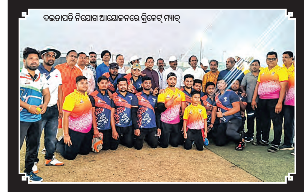
ଦଇତାପତି ନିଯୋଗ ଆୟୋଜନରେ କ୍ରିକେଟ୍ ମ୍ୟାଚ୍