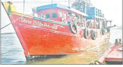
ଟ୍ରଲର ୮ ଆଇ ଏନ ଡି ଓ ଆର ୦୪-ଏମ ଏମ ୨୩୪ ଥିବା ବେଳେ ଏହାର ନାମ ପବନପୁତ୍ର-୩ ଏବଂ ଏଥିରେ ଥିବା ୮ ଜଣ କର୍ମଚାରୀ ଅଟକ ଥିବା ବନବିଭାଗ

ବିରଳ ଅଲିଭ୍ ରିଡଲେ କଲିକଟ୍ ସୁରକ୍ଷା ନିମନ୍ତେ ସମୁଦ୍ର ଉପକୂଳରୁ ୨୦କିଲୋମିଟର ପର୍ଯ୍ୟନ୍ତ ଯନ୍ତ୍ର ଚାଳିତ ଟ୍ରଲର ଜବତ କରାଯାଇଛି।