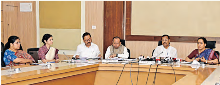
ଆହୁରି ପ୍ରଚାରପ୍ରସାର ହେବ ଓଡ଼ିଆ ଭାଷା, କଳା, ସାହିତ୍ୟ ଓ ସଂସ୍କୃତି ନିୟମିତ ମାନ୍ୟତା ପାଇବେ ବିଭିନ୍ନ ସ୍କୁଲର ୭୩ ବହୁଭାଷୀ ଶିକ୍ଷକ କାର୍ଯ୍ୟକ୍ରମ ଓ ପର୍ଯ୍ୟଟନସ୍ଥଳୀ ଉନ୍ନୟନ ଯୋଜନା ୨୦୨୬ ଯାଏ ସମ୍ପ୍ରସାରିତ ନୂଆ-ଓ ଛାତ୍ରବୃତ୍ତି, ବୁଣାକାର ଓ କାରିଗର ସହାୟତା ଯୋଜନାକୁ ମୋହର

ଭୁବନେଶ୍ୱର, ୧୬/୨ (ସମ୍ବିଧ): ଓଡ଼ିଆ ଭାଷା, ସାହିତ୍ୟ ଓ ସଂସ୍କୃତିର ପ୍ରଚାର ଓ ପ୍ରସାର; କଳା, ଭାଷା ଓ ଐତିହାସିକତାକୁ ଫରଷଣ ଏବଂ ବିଭାଗର କାର୍ଯ୍ୟକ୍ରମର ସୁପରିଚାଳନା ପାଇଁ ଜିଲ୍ଲା ସଂସ୍କୃତି ଅଧିକାରୀଙ୍କ କ୍ୟାଡର ପୁନର୍ଗଠନ ହେବ। ଏଥିପାଇଁ 'ଓଡ଼ିଶା ସଂସ୍କୃତି ଉନ୍ନୟନ ସେବା' ନାମରେ ଏକ ନୂଆ କ୍ୟାଡର ସୃଷ୍ଟି କରାଯିବ। ମୁଖ୍ୟମନ୍ତ୍ରୀଙ୍କ ଅଧିକାରୀଙ୍କ ଅନୁମୋଦନ କ୍ୟାବିନେଟ ବୈଠକରେ ଉପରୋକ୍ତ ପ୍ରସ୍ତାବ ସହ ୧୦ଟି ବିଭାଗର ମୋଟ ୧୨ଟି ପ୍ରସ୍ତାବ ଗୋଟିଏ ବାକି। ବୈଠକରେ ନିଷ୍ପତ୍ତି ସମ୍ପର୍କରେ ମନ୍ତ୍ରୀ ପ୍ରତ୍ୟାପ କ୍ରମରେ ଅମାତ, ମୁଖ୍ୟ ସଚିବ ପ୍ରତ୍ୟାପ କ୍ରମରେ କେନା ବିଶେଷ ସୂଚନା ପ୍ରଦାନ କରିଛନ୍ତି।