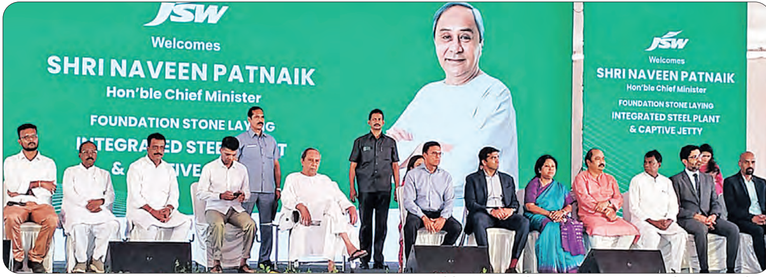
ପାରାଦୀପ ଜିଲ୍ଲାରେ ବୃହତ୍ ମହାଶିଳାଧାନୀ (ଜେଏସ୍‌ସିଆଇ) ର ଶିଳାଧାନୀ ସମୟରେ ମୁଖ୍ୟମନ୍ତ୍ରୀ ନବୀନ ପଟ୍ଟନାୟକ