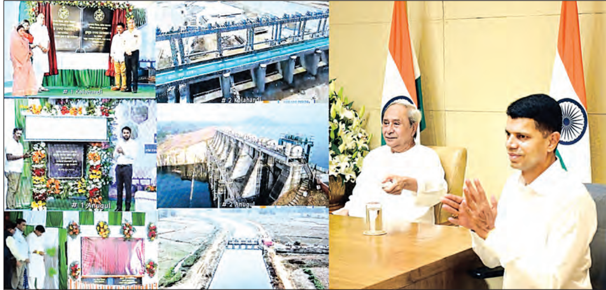
କଳାହାଣ୍ଡି, କଟକ, ଡେଙ୍କାନାଳ ଓ ଅନୁଗୋଳ ଜିଲ୍ଲାର ଚାଷ ଜମିକୁ ଜଳସେଚନ ସୁବିଧା ଉପଲବ୍ଧ ହେବ।

କଳାହାଣ୍ଡି, କଟକ, ଡେଙ୍କାନାଳ ଓ ଅନୁଗୋଳ ଜିଲ୍ଲାର ଚାଷ ଜମିକୁ ଜଳସେଚନ ସୁବିଧା ଉପଲବ୍ଧ ହେବ। ରେଙ୍ଗାଳି ତ୍ୟାମ ଓ ସମଲ ବ୍ୟାରେଜ କେନାଲ ପ୍ରଣାଳୀ କାମ ଧାର୍ଯ୍ୟାୟକୁ ମୋକାମିତ କରିଛନ୍ତି। ଏହାପରେ ୧୫ ଲକ୍ଷ ଟଙ୍କା ଉଦ୍‌ଘାଟନ କରିବା ପାଇଁ ଉଦ୍‌ଘାଟନ କରିଥିଲେ। ଏହାପରେ ୧୫ ଲକ୍ଷ ଟଙ୍କା ଉଦ୍‌ଘାଟନ କରିବା ପାଇଁ ଉଦ୍‌ଘାଟନ କରିଥିଲେ। ଏହାପରେ ୧୫ ଲକ୍ଷ ଟଙ୍କା ଉଦ୍‌ଘାଟନ କରିବା ପାଇଁ ଉଦ୍‌ଘାଟନ କରିଥିଲେ।