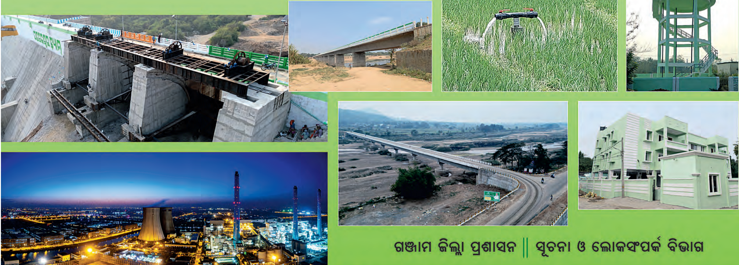
ଗଞ୍ଜାମ ଜିଲ୍ଲା ପ୍ରଶାସନ || ସୂଚନା ଓ ଲୋକସଂପର୍କ ବିଭାଗ