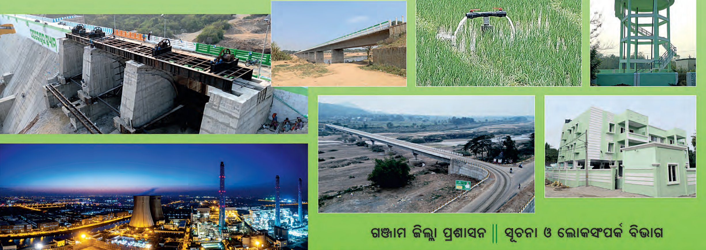
ଗଞ୍ଜାମ ଜିଲ୍ଲା ପ୍ରଶାସନ || ସୂଚନା ଓ ଲୋକସଂପର୍କ ବିଭାଗ