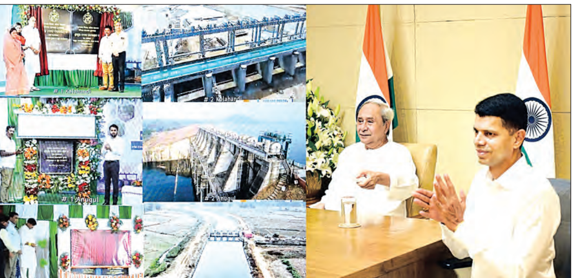
କଳାହାଣ୍ଡି, କଟକ, ଢେଙ୍କାନାଳ ଓ ଅନୁଗୋଳ ଜିଲ୍ଲାର ଚାଷ ଜମିକୁ ଜଳସେଚନ ସୁବିଧା ଉପଲବ୍ଧ କରିବା ପାଇଁ ମୁଖ୍ୟମନ୍ତ୍ରୀ ନବୀନ ପଟ୍ଟନାୟକଙ୍କ ସହ ଚାଷୀଙ୍କ ସମ୍ମିଳନୀରେ ସାହୁଲ ବ୍ୟାରେଜ କାମ ଧାର୍ଯ୍ୟ ସମୟର ୫ ମାସ ପୂର୍ବରୁ ଶେଷ ହେଲା

ଭୁବନେଶ୍ୱର, ୧୩/୧ (ସମ୍ପାଦକ): ରାଜ୍ୟର ସବୁ ଜମିରେ ସେତ ସାମର୍ଥ୍ୟ ସୃଷ୍ଟି ପାଇଁ ମୁଖ୍ୟମନ୍ତ୍ରୀ ନବୀନ ପଟ୍ଟନାୟକ ନିୟମିତ ଭାବେ ବ୍ୟାପକ ପଦକ୍ଷେପ ନେଇ ଆସୁଛନ୍ତି।