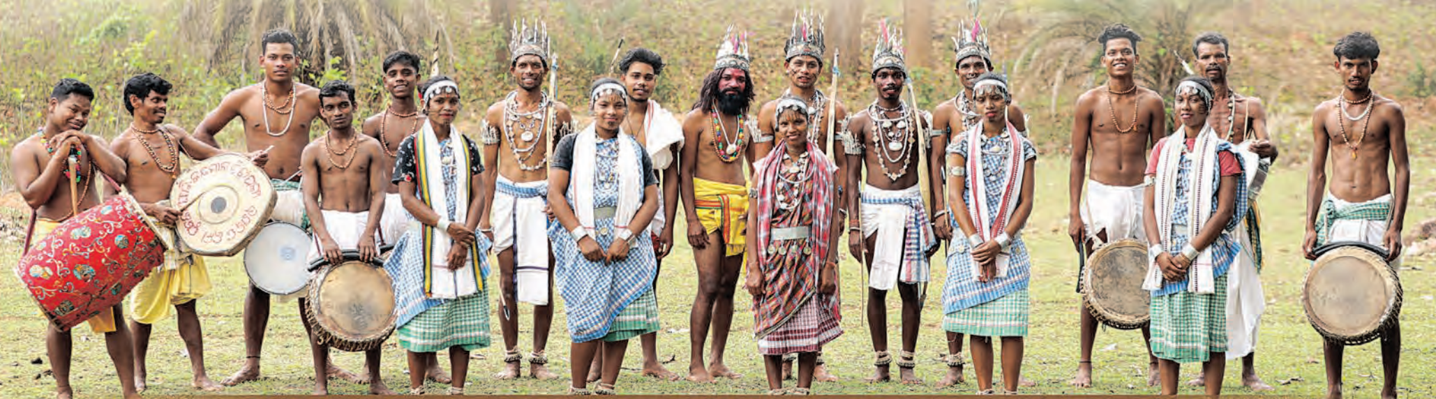
ଅନୁସୂଚିତ ଜନଜାତି ଓ ଅନୁସୂଚିତ ଜାତି ଉନ୍ନୟନ ତଥା ସଂଖ୍ୟାଲଘୁ ଓ ପଛୁଆ ବର୍ଗ କଲ୍ୟାଣ ବିଭାଗ