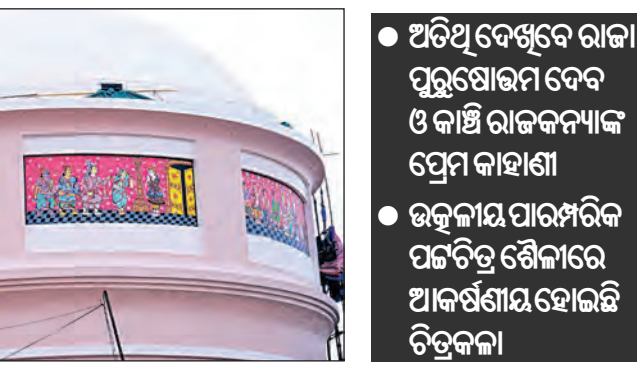
ଅତିଥି ଦେଖିବେ ରାଜା ପୁରୁଷୋତ୍ତମ ଦେବ ଓ କାଞ୍ଚି ରାଜକନ୍ୟାଙ୍କ ପ୍ରେମ କାହାଣୀ