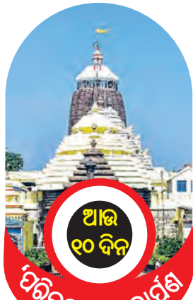
ଆଜି ୧୦ ଦିନ 'ପରିକ୍ରମା' ଲୋକାର୍ପଣ