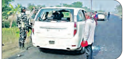
କୋଲକାତା, ୫୧ (ଏକେଡି)

ମମତାଙ୍କୁ ରାଜ୍ୟପାଳଙ୍କ ଚେତାବନୀ ବର୍ବରତା ବନ୍ଦ କରି, ନଚେତ୍ ଦୃଢ଼ କାର୍ଯ୍ୟାନୁଷ୍ଠାନ