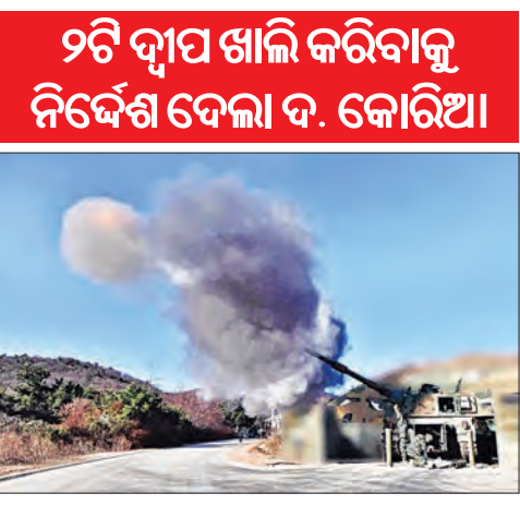
୨ଟି ଦ୍ୱୀପ ଖାଲି କରିବାକୁ ନିର୍ଦ୍ଦେଶ ଦେଲା ଦ. କୋରିଆ

ସିଂଗୁ, ୫୧ (ଏକେଡି) ପୃଥିବୀରେ ପୁଣି ଯୁଦ୍ଧ ଆଖ୍ୟା ବୃଦ୍ଧି ପାଇଛି। ରୁଷ-ୟୁକ୍ରେନ୍, ଇସ୍ରାଏଲ- ହମାସ୍ ପରେ ଉତ୍ତର କୋରିଆ- ଦକ୍ଷିଣ କୋରିଆ ମଧ୍ୟରେ ଉତ୍ତରକୋରିଆ ବୃଦ୍ଧି ପାଇଛି। ଚେତାବନୀ ପରେ ଦ.କୋରିଆର ଯୋନପୋଙ୍ଗ ଦ୍ୱୀପ ଅଭିଯୁକ୍ତ ଉତ୍ତର କୋରିଆ ଶୁକ୍ରବାର ୨୦୦ରୁ ଅଧିକ ଗୋଳା (ଆର୍ଟିଲାରୀ ସେଲ୍) ମାଡ଼ କରିଛି। ଏହା ଦେଖି ଦକ୍ଷିଣ କୋରିଆ ପ୍ରଶ୍ନାସନ ଦ୍ୱୀପ ଖାଲି କରିବାକୁ ନିର୍ଦ୍ଦେଶ ଦେଇଛି। ଏହା ବ୍ୟତୀତ ବିପଦ ଥିବାରୁ ନିକଟରେ ଥିବା ବେଙ୍ଗନିଓଙ୍ଗ ଦ୍ୱୀପକୁ