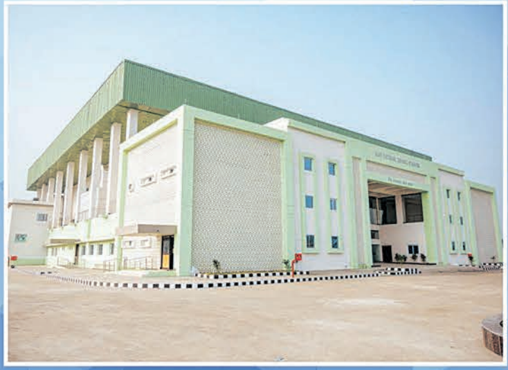
ବୁର୍ଲା ଇନଡୋର ଷ୍ଟାଡ଼ିୟମ

“ କ୍ରୀଡ଼ା ପାଇଁ ଯୁବଗୋଷ୍ଠୀ ଭବିଷ୍ୟତ ପାଇଁ ବଡ଼ ଶକ୍ତି ”