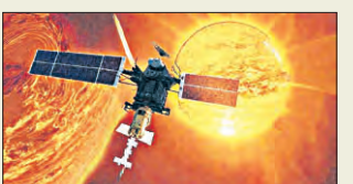
ଲକ୍ଷ କିମି ଦୂରରେ ଥିବା ଏଲ୍-୧ ପଏଣ୍ଟ ଅଭିଯୁକ୍ତ ଉପସ୍ଥର ହେଉଛି। ଏହି ପଏଣ୍ଟରେ ପୂର୍ବରୁ ଏବଂ ସୂର୍ଯ୍ୟର ମାଧ୍ୟକର୍ଷଣ ଶକ୍ତି ମଧ୍ୟରେ ସନ୍ତୁଳନ ରହିଥିଲା। ଏହା ପୂର୍ବରୁ ଏବଂ ସୂର୍ଯ୍ୟ ମଧ୍ୟରେ ଥିବା ଦୂରତାର ମାତ୍ର ଏକ ପ୍ରତିଶତ। ଆଦିତ୍ୟ ଏଠାରେ ରହି ସୂର୍ଯ୍ୟଙ୍କ ଉପରେ ଅଧ୍ୟୟନ କରିବା ଗଣିତଜ୍ଞ ଯୋସେଫ୍ ଲୁଇ ଲାଗରେଜଙ୍କ ନାମରେ ଏଲ୍-୧ ପଏଣ୍ଟର ନାମକରଣ ହୋଇଥିଲା। ସେହି ଏହାର ସମ୍ମାନ କରିଥିଲେ।

ବେଙ୍ଗାଳୁରୁ, ୫୧ (ଏକେଡି): ଚନ୍ଦ୍ର ଚକ୍ଷଣ ମେଳରେ ଚନ୍ଦ୍ରଯାନ-୩କୁ ସପକଟାର ସହ ଅବତରଣ କରିବା ପରେ ଭାରତ ନୂଆ ଇତିହାସ ରଚିବାକୁ ଯାଉଛି। ଚନ୍ଦ୍ର ପରେ ଇସ୍ରୋ ସୂର୍ଯ୍ୟରେ ବିଜୟ ଧୂଳି ଉଡ଼ାଇବାକୁ ଯାଉଛି। ଭାରତ ପ୍ରଥମ ଏବଂ ବିଶ୍ୱର ଦ୍ୱିତୀୟ ସୂର୍ଯ୍ୟ ଅଭିଯାନ ନିଜ ଲକ୍ଷ୍ୟପଥର ନିକଟତର ହେଉଛି। ଶନିବାର ଅପରାହ୍ଣ ୪ଟାରେ ଏହା ସୂର୍ଯ୍ୟଙ୍କ ଲାଗରେ ଚାପି ହେଲେ। ଅର୍ବିଟ୍ (ଏଲ୍-୧) ପଏଣ୍ଟରେ ପ୍ରବେଶ କରିବା ଇସ୍ରୋ ଅଧ୍ୟକ୍ଷ ଏସ୍ ସୋମନାଥ ଏହି ସୂଚନା ଦେଇଛନ୍ତି। ସେପ୍ଟେମ୍ବର ୨ରେ ଆଦିତ୍ୟର ଉତ୍ତରାଧିକାରୀ କରାଯାଇଥିଲା। ଏହା ପୂର୍ବରୁ ଚନ୍ଦ୍ର ଲକ୍ଷ କିମି ଦୂରରେ ଥିବା ଏଲ୍-୧ ପଏଣ୍ଟ ଅଭିଯୁକ୍ତ ଉପସ୍ଥର ହେଉଛି। ଏହି ପଏଣ୍ଟରେ ପୂର୍ବରୁ ଏବଂ ସୂର୍ଯ୍ୟର ମାଧ୍ୟକର୍ଷଣ ଶକ୍ତି ମଧ୍ୟରେ ସନ୍ତୁଳନ ରହିଥିଲା। ଏହା ପୂର୍ବରୁ ଏବଂ ସୂର୍ଯ୍ୟ ମଧ୍ୟରେ ଥିବା ଦୂରତାର ମାତ୍ର ଏକ ପ୍ରତିଶତ। ଆଦିତ୍ୟ ଏଠାରେ ରହି ସୂର୍ଯ୍ୟଙ୍କ ଉପରେ ଅଧ୍ୟୟନ କରିବା ଗଣିତଜ୍ଞ ଯୋସେଫ୍ ଲୁଇ ଲାଗରେଜଙ୍କ ନାମରେ ଏଲ୍-୧ ପଏଣ୍ଟର ନାମକରଣ ହୋଇଥିଲା। ସେହି ଏହାର ସମ୍ମାନ କରିଥିଲେ।