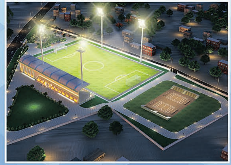
ପୁଟବଲ ଡାଲିମ କେନ୍ଦ୍ର ସମ୍ବଲପୁର

“କ୍ରୀଡ଼ା ଦୃଶ୍ୟପଙ୍କର ରୂପାନ୍ତରଣ, କ୍ରୀଡ଼ାବିତଙ୍କ ସଶକ୍ତିକରଣ”