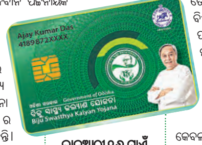
କାର୍ଡଧାରୀ ୧୬ ଯାଏଁ ଚାଲିବ ପଞ୍ଜୀକରଣ ପର୍ଯ୍ୟାୟକ୍ରମେ ସାମିଲ ହେବେ ସହରାଞ୍ଚଳ ବାସିନ୍ଦା ଓ ସରକାରୀ କର୍ମଚାରୀ ପାଣ୍ଡିଆନ

ଠାରୁ ଏଥିପାଇଁ ଅନୁଲାଇନ୍ରେ ପଞ୍ଜୀକରଣ ଆରମ୍ଭ ହେବ। ଏହି ପଞ୍ଜୀକରଣ ୬ ତାରିଖରୁ ୧୬ ତାରିଖ ପର୍ଯ୍ୟନ୍ତ କାରି ରହିବ। ତେଣୁ ପ୍ରତି ପଞ୍ଚାୟତରେ ବିଏସ୍କେଏଲର ବାବ୍ ପଡ଼ିଥିବା ଲୋକଙ୍କୁ ନବୀନ କାର୍ଡରେ ପଞ୍ଜୀକରଣ କରିବାରେ ସହଯୋଗ କରିବାକୁ ସେ ଆହ୍ୱାନ ଦେଇଛନ୍ତି। ବିଏସ୍କେଏଲରେ କେବଳ ରାସନ କାର୍ଡ ଧାରୀଙ୍କୁ ସାମିଲ କରାଯାଇ ଥିବା ବେଳେ ଉଭୟ ଗ୍ରାମାଞ୍ଚଳ ଏବଂ ସହରାଞ୍ଚଳର ବହୁ ଲୋକ ଏଥିରୁ ବାଦ୍ ପଡ଼ିଥିଲେ। ବିଏସ୍କେଏଲର ତୃତୀୟ ପର୍ଯ୍ୟାୟ ସମ୍ପର୍କରେ ଗ୍ରାମାଞ୍ଚଳରେ ରହିଥିବା ପ୍ରତ୍ୟେକ ପରିବାରକୁ (ସରକାରୀ କର୍ମଚାରୀ, ଯେନସନ୍ତୋଗୀ ଓ ଆୟକର ଦାତାଙ୍କୁ ବାଦ୍ ଦେଇ) ସାମିଲ କରିବା ପାଇଁ ମୁଖ୍ୟମନ୍ତ୍ରୀ ନିଶ୍ଚିତ ନେଇଥିଲେ। ନବୀନ କାର୍ଡଧାରୀଙ୍କୁ ଚଳିତ ବର୍ଷ ମେ ୧ ତାରିଖରୁ ନିଶ୍ଚିତ ସ୍ୱାସ୍ଥ୍ୟ ସେବା ମିଳିବ। ବିଏସ୍କେଏଲ ନବୀନ କାର୍ଡ ପାଇଁ ତତ୍ତ୍ୱଚକ୍ରୁତ (ଡଟ) ବିଏସ୍କେଏଲନବୀନ (ଡଟ) ଓଡ଼ିଶା (ଡଟ) ଇନ୍