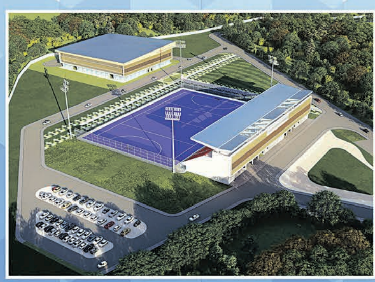
ସ୍ପୋର୍ଟ୍ସ କମ୍ପ୍ଲେକ୍ସ ସମ୍ବଲପୁର ଯୁନିଭରସିଟି