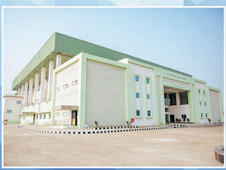
ବୁର୍ଲା ଇନଡୋର୍ ଷ୍ଟାଡ଼ିୟମ