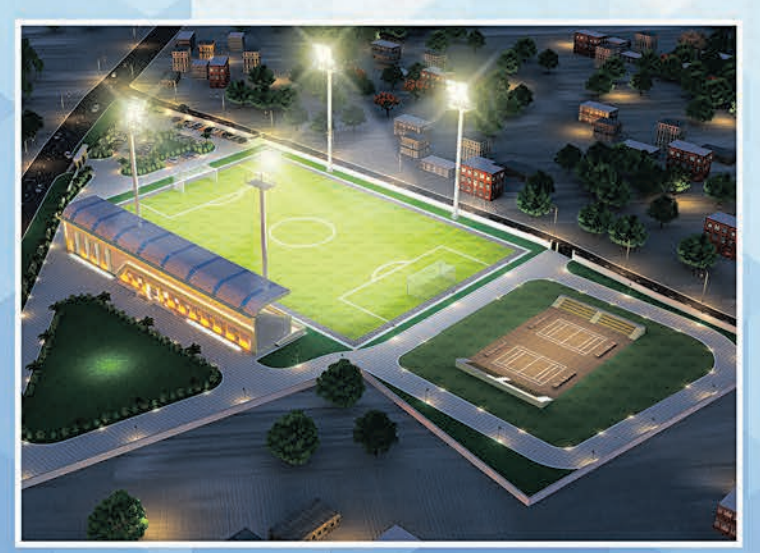
ଫୁଟବଲ ଡାଲିମ କେନ୍ଦ୍ର ସମ୍ବଲପୁର

“କ୍ରୀଡ଼ା ଦୃଶ୍ୟପଙ୍କର ରୂପାନ୍ତରଣ, କ୍ରୀଡ଼ାବିତଙ୍କ ସଶକ୍ତିକରଣ”