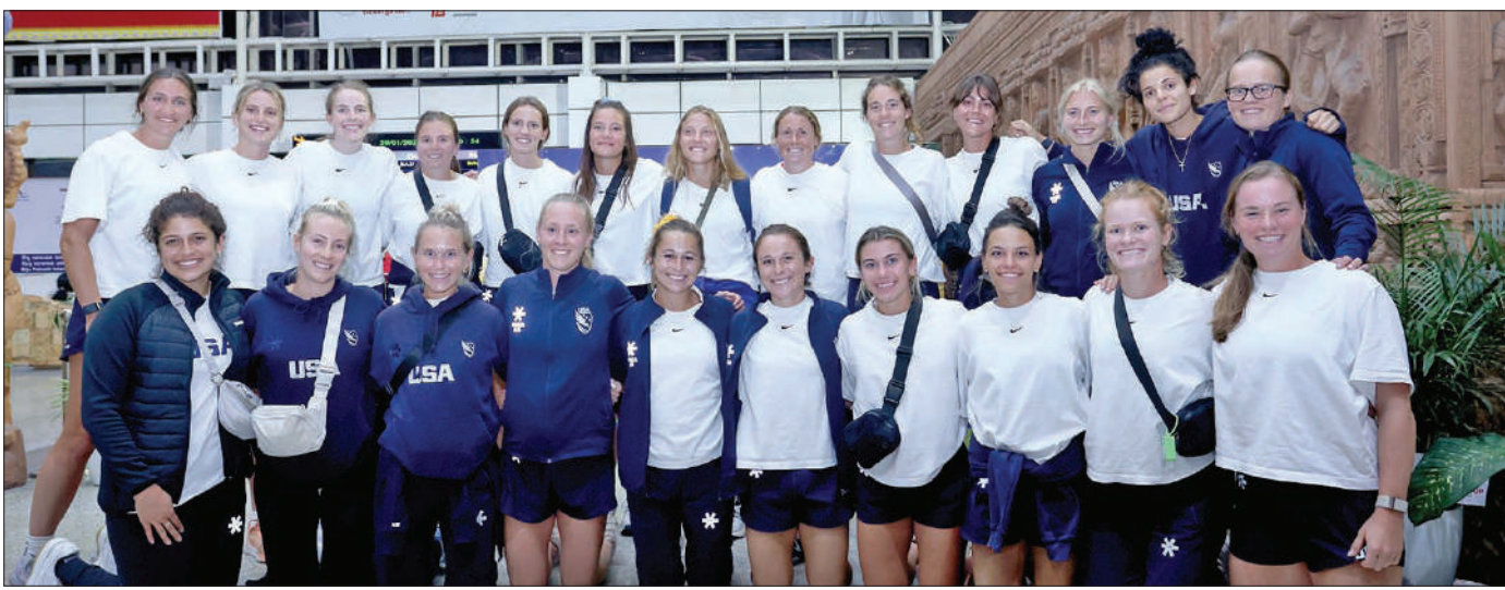
ଓଡ଼ିଶାରେ ଫେବୃଆରୀ ୩ରୁ ଖେଳାଯିବାକୁ ଥିବା ଏସ୍‌ଆଇଏଏସ୍ ମହିଳା ହକି ପ୍ରୋ ଲିଗ୍ ଲାଗି ସାମାଜିକ ଆନ୍ଦୋଳନ ଦଳ ଭୁବନେଶ୍ୱରରେ ପହଞ୍ଚିଛି।