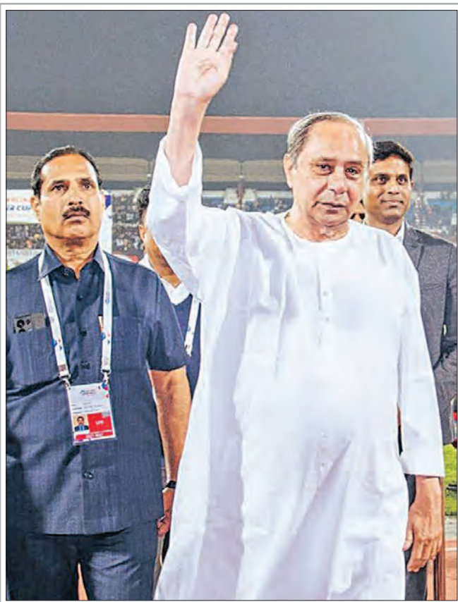
ରବିବାର କଳିଙ୍ଗ ଷ୍ଟାଡ଼ିୟମରେ ଓଡ଼ିଶା ଏପସି ଓ ଇଷ୍ଟ ବେଙ୍ଗଲ ମଧ୍ୟରେ ଖେଳାଯାଇଥିବା କଳିଙ୍ଗ ସୁପର କପ୍ ଫାଇନାଲ ଅବସରରେ ପୁଣ୍ୟମନ୍ତ୍ରୀ ନବୀନ ପଟ୍ଟନାୟକ ।

ଭୁବନେଶ୍ୱର, ୨୮।୧ (ସମ୍ପାଦକ): ସ୍ଥାନୀୟ କଳିଙ୍ଗ ଷ୍ଟାଡ଼ିୟମରେ ୩ ସପ୍ତାହ ଧରି ଚାଲିଥିବା କଳିଙ୍ଗ ସୁପର କପ୍ରେ ଇଷ୍ଟ ବେଙ୍ଗଲ ଚାମ୍ପିୟନ ହୋଇଛି । କଡ଼ା ଫିଲ୍ଡିଂ ପାଇଁ ପାଇନାଲରେ ଇଷ୍ଟ ବେଙ୍ଗଲ ଏପସି ୩-୨ ଗୋଲରେ ଡିଫେଣ୍ଡିଂ ଚାମ୍ପିୟନ ଓଡ଼ିଶା ଏପସିକୁ ପରାସ୍ତ ଟାଇଟଲ୍ ଜିତିବାରେ ସପକ ହୋଇଛି । ଫଳରେ କୁମାର ୨୫ର ଚାମ୍ପିୟନ ହେବା ଲକ୍ଷ୍ୟରେ ରହିଥିବା ଓଡ଼ିଶା ଏପସିର ସ୍ୱପ୍ନ ଭଙ୍ଗ ହୋଇଛି ।