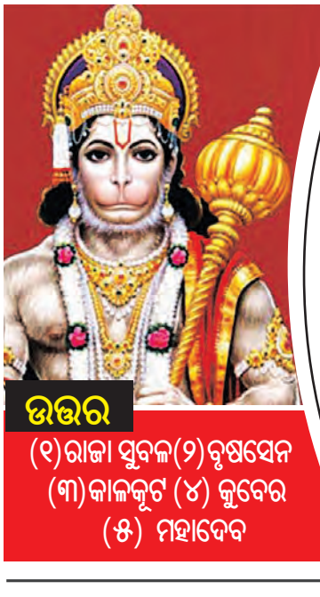
ଉତ୍ତର (୧)ରାଜା ସୁବଳ (୨)ବୃଷସେନ (୩)କାଳକୂଟ (୪) କୁବେର (୫) ମହାଦେବ

ସମାଜନ ଧର୍ମ ଏବଂ ଜ୍ୟୋତିଷ ଶାସ୍ତ୍ରରେ ଘରର ଏରୁଣ୍ଡି ବନ୍ଧର ବିଶେଷ ଗୁରୁତ୍ୱ ଅଛି । ଏରୁଣ୍ଡି ବନ୍ଧ ଘର ନକାରାତ୍ମକ ଶକ୍ତି ଦୂରରେ ରଖିବାରେ ସାହାଯ୍ୟ କରେ । ମୁଖ୍ୟଦ୍ୱାରରେ ଏରୁଣ୍ଡିବନ୍ଧରେ ନିତି ସଜ୍ଜା ସଲିତା ଜଳାଯାଏ । ● ଜ୍ୟୋତିଷ ଶାସ୍ତ୍ର ଅନୁସାରେ, ଏରୁଣ୍ଡି ବନ୍ଧରେ ରାହୁ ବାସ କରନ୍ତି । ଏହି ପୂଜା ଦ୍ୱାରା ରାହୁ ପ୍ରକୋପ କର୍ମ ହୁଏ । ଏହା ସହ ଘରେ ସକାରାତ୍ମକ ଶକ୍ତି ପ୍ରଦେଶ କରେ । ଏଣୁ ଏରୁଣ୍ଡି ବନ୍ଧକୁ ମା' ଲକ୍ଷ୍ମୀଙ୍କ ଆଗମନର ଦ୍ୱାର ବୋଲି କୁହାଯାଏ । ● ଏରୁଣ୍ଡି ବନ୍ଧ ପୂଜା ଦ୍ୱାରା ମା' ଲକ୍ଷ୍ମୀଙ୍କ କୃପା ପ୍ରାପ୍ତି ହୁଏ । ଏହାସହ ଜୀବନରେ ହସ ଖୁସି ଭରିଯାଏ । ଘରର ଲୌଣସି ପୂଜା ଉତ୍ସବରେ ଘରର ଦୁଆର ବନ୍ଧକୁ ପ୍ରଥମେ ସାଜସଜ୍ଜା କରାଯାଏ । ସେହିପରି ଦାପାବଳି ଅବସରରେ ଦାପ ଜଳାଯାଏ । ତା'ସହ ରଖେଇ ଦି କରାଯାଏ । ସେଥିପାଇଁ ଘରର ଏରୁଣ୍ଡି ବନ୍ଧକୁ ସବୁବେଳେ ସଫାସୁତୁରା ରଖିବା ଆବଶ୍ୟକ ।