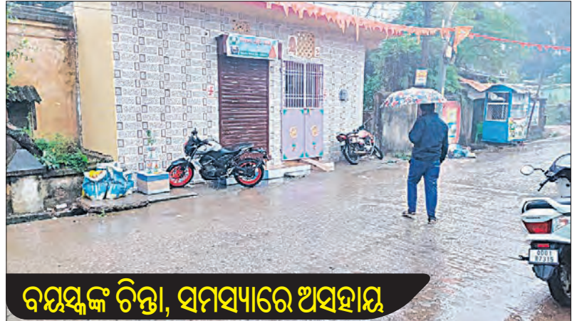
ବୟସ୍କଙ୍କ ଚିନ୍ତା, ସମସ୍ୟାରେ ଅସହାୟ

ଲଘୁତାପଜନିତ ବର୍ଷା ପାଇଁ ବାଲେଶ୍ୱର ଜିଲ୍ଲାରେ ଶୀତର ପ୍ରକୋପ ଧୀରେ ଧୀରେ ବଢ଼ିବାରେ ଲାଗିଛି। ଅତ୍ୟଧିକ ବର୍ଷା ଶୀତର ପ୍ରକୋପ। ଗତ କିଛି ଦିନ ହେଲାଣି ପାଗ କୋହଳ କରୁଥିବା ବେଳେ ବର୍ଷା ମଧ୍ୟ ହେଉଛି। ଏହା ଫଳରେ ସକାଳ ଠାରୁ ରାତି ପର୍ଯ୍ୟନ୍ତ ଶୀତର ପ୍ରକୋପ ଅଧିକ ବଢ଼ିବାରେ ଲାଗିଛି। ଏହି ବହୁଥିବା ଶୀତ ପାଇଁ ବୟସ୍କଙ୍କ ଚିନ୍ତା ବଢ଼ାଇ ଦେଇଥିବା ବେଳେ ରାସ୍ତା କଡ଼ରେ ଅସହାୟ ଭାବେ ପଡ଼ିରହିଥିବା ଲୋକଙ୍କ ସମସ୍ୟା ଅଧିକ ଦୃଶ୍ୟ ହୋଇଯାଇଛି। ଏପରିକି କୁହୁଡ଼ି ଓ କାକର ପଡ଼ୁଥିବା ବେଳେ ଏବେ ବର୍ଷା ଲୋକଙ୍କୁ ଅଧିକ ଭୟଭୀତ କରିଛି। ଫଳରେ ଆସନ୍ତା ମାସ ପର୍ଯ୍ୟନ୍ତ ଏହି ଶୀତର ପ୍ରକୋପ ରହିବ ବୋଲି ବାଲେଶ୍ୱର ପାଣିପାଗ ବିଭାଗ ପକ୍ଷରୁ ସୂଚନା ମିଳିଛି।