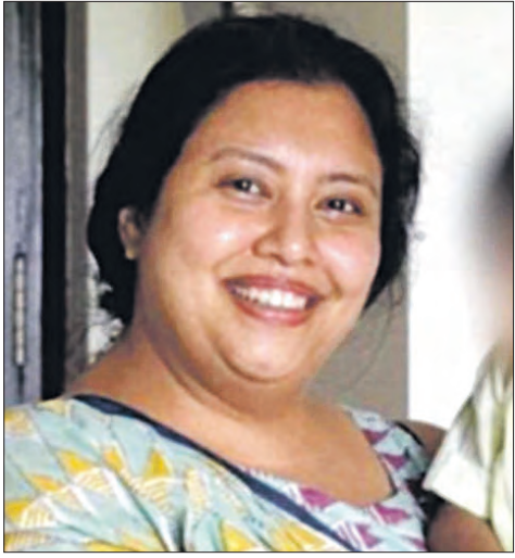
ଏଭଳି ଚର୍ଚ୍ଚାର ପରିଧିକୁ ଆସିଥିବା ମହିଳା ଜଣକ କୌଣସି ସାଧାରଣ ମହିଳା ନୁହେଁ, ବରଂ ଏକ ଖ୍ୟାତ ଅନୁଷ୍ଠାନୀୟ ମାଲିକା ଥିଲେ । ଏହାକୁ ନେଇ କେତେକ କୋଣସି ସାଧାରଣ ମହିଳା ନୁହେଁ, ବରଂ ଏକ ଖ୍ୟାତ ଅନୁଷ୍ଠାନୀୟ ମାଲିକା ଥିଲେ ।

ଉଗ୍ର ରୂପ ନେଲା ସ୍ୱାମୀ-ସ୍ତ୍ରୀ ବିବାହ । ଯେଉଁଥିପାଇଁ ସ୍ୱାମୀ ଉପରେ ରାଗ ଶୁଣିବାକୁ ଯାଇ ନିଜ ଜନ୍ମିତ ପୁତ୍ରକୁ ହତ୍ୟାକଲେ ଜଣେ ମହିଳା । ଏଭଳି ଘଟଣା ଘଟିଛି ଗୋଆର ଏକ ପଞ୍ଚତାରକା ହୋଟେଲରେ । ବେଙ୍ଗାଳୁରୁରୁ ଆର୍ଟିସିଆଲ ଇଣ୍ଡଷ୍ଟ୍ରିରେ ତଥା ଏକ ପ୍ରତିଷ୍ଠିତ କମ୍ପାନୀର ସିଇଓ ସ୍ୱତନ୍ତ୍ରୀ ସେଠାରେ ଉପାଧ୍ୟକ୍ଷ ଭାବେ କାର୍ଯ୍ୟ କରିବା ଉପରେ ସିଇଓ ସ୍ୱତନ୍ତ୍ରୀ ସେଠାରେ ଉପାଧ୍ୟକ୍ଷ ଭାବେ କାର୍ଯ୍ୟ କରିବା ଘଟଣା ସାରା ଦେଶରେ ଆଲୋଚନା ସୃଷ୍ଟି କରିଛି । (ରିପୋର୍ଟ-ସିଦ୍ଧାନ୍ତ)