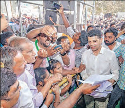
କାଶୀନଗରଠାରେ ଆୟୋଜିତ ସାଧାରଣ ସଭାକୁ ସମ୍ବୋଧିତ କରି '୫-ଟି' ଓ 'ନବୀନ ଓଡ଼ିଶା' ଅଧକ୍ଷ

■ ଗଜପତି, ୨୩।୧ (ସମ୍ବିଧା): ବିଜେଡି ସରକାର ହେଉଛି ଲୋକଙ୍କ ସରକାର। ଜନତାଙ୍କ ଇଚ୍ଛା ହିଁ ସରକାରଙ୍କ ପାଇଁ ସର୍ବମୁଖ୍ୟ। ଲୋକେ ଯାହା କହୁଛନ୍ତି, ମୁଖ୍ୟମନ୍ତ୍ରୀ ତାହା କରୁଛନ୍ତି। ଏହା ହେଉଛି ଉତ୍ତରଦାୟୀ ସରକାର। ତେଣୁ ଲୋକଙ୍କୁ କାମର ଗୋଟି ଗୋଟି ହିସାବ ଦିଆଯାଉଛି। ଅନ୍ୟ କୌଣସି ସ୍ଥାନରେ ଗଣତନ୍ତ୍ର ଏପରି ପରିଭାଷା ଦେଖିବାକୁ ମିଳେ ନାହିଁ। ତେଣୁ ଆପଣମାନଙ୍କ ସହଯୋଗରେ ମୁଖ୍ୟମନ୍ତ୍ରୀଙ୍କ ନୂଆ ଓଡ଼ିଶା ଗଠନ ସ୍ୱପ୍ନ ସାକାର ହେବ। ମଙ୍ଗଳବାର ଗଜପତି ଜିଲ୍ଲା ଗସ୍ତ ଅବସରରେ