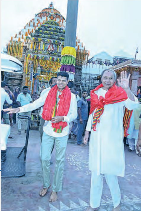
ଶ୍ରୀମନ୍ଦିର, ଶ୍ରୀକ୍ଷେତ୍ର ବିକାଶ ନେଇ ସେବାୟତଙ୍କ ସହ କଥାହେଲେ ପରିକ୍ରମା ପ୍ରକଳ୍ପର ଉଦ୍ଦେଶ୍ୟ ଓ ଆଧ୍ୟାତ୍ମିକ ପରିବେଶ ଦେଖି ଖୁସି ବ୍ୟକ୍ତକଲେ

■ ପୁରୀ, ୨୩।୧ (ସମ୍ବିଧା): ପରିକ୍ରମା ପ୍ରକଳ୍ପ ଲୋକାର୍ପଣର ସପ୍ତମ ଦିନରେ ଚତୁର୍ଦ୍ଧାବିଗ୍ରହଙ୍କୁ ଦର୍ଶନ କରିଛନ୍ତି ମୁଖ୍ୟମନ୍ତ୍ରୀ ନବୀନ ପଟ୍ଟନାୟକ। ଏହି ଅବସରରେ ମଙ୍ଗଳବାର ମହାପ୍ରଭୁଙ୍କ ଆଶୀର୍ବାଦ ଲୋଡ଼ିବା ସହ ରାଜ୍ୟବାସୀଙ୍କ ସୁଖ, ସମୃଦ୍ଧି କାମନା କରିଛନ୍ତି ମୁଖ୍ୟମନ୍ତ୍ରୀ। ଏଥିସହ ପରିକ୍ରମା ପ୍ରକଳ୍ପର ପୁନଃ ପ୍ରସଙ୍ଗ କରି ଅନୁଭୂତି ନେଇଛନ୍ତି।