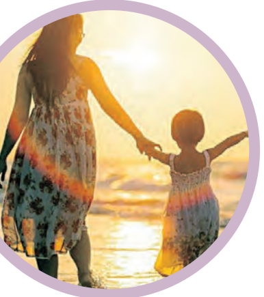
ଅର ପାଇଁ ଜାତୀୟ କନ୍ୟା ଦିବସ ପାଳନ ପାଇଁ ପଦକ୍ଷେପ ନିଆଯାଇଥିଲା । ଗୋଷ୍ଠି, ନିର୍ଯାତିତ ଶିଶୁକନ୍ୟାମାନଙ୍କୁ ଉଦ୍ଧାର କରି ସମାଜରେ ସଚେତନତା ସୃଷ୍ଟି କରାଇ ଶିକ୍ଷା, ସ୍ୱାସ୍ଥ୍ୟ, ସୁବିଧା ସୁଯୋଗ ଯୋଗାଇଦେବା ଏହି ଦିବସ ପାଳନର ଲକ୍ଷ୍ୟ ଓ ଉଦ୍ଦେଶ୍ୟ ।

କେଟି ବଚାଏ, ବେଟି ପଢ଼ାଏ, ସେଇ ଦି ଗାଳି ପରି ଅନେକ ଅଭିଯାନ ସତ୍ତ୍ୱେ ସମାଜରେ କନ୍ୟାସନ୍ତାନ ଅଲୋଡ଼ା ଅଖୋଜା ହୋଇରହିଛନ୍ତି । କନ୍ୟା ସନ୍ତାନର ସୁରକ୍ଷା ପାଇଁ ପ୍ରତ୍ୟେକ ବର୍ଷ ଜାନୁଆରୀ ୨୪ ତାରିଖକୁ ଜାତୀୟ କନ୍ୟା ଦିବସ ଭାବେ ପାଳନ କରାଯାଏ । କନ୍ୟା ସନ୍ତାନମାନଙ୍କ ସାମାଜିକ ଗୁରୁତ୍ୱ ସମ୍ପର୍କରେ ସଚେତନତା ସୃଷ୍ଟି ଓ ସେମାନେ ଏକ ସମ୍ମାନଜନକ ଜୀବନ ଜିଇବା ଦିଗରେ ଗୃହ, ଗୋଷ୍ଠୀ ଏବଂ ଅନୁଷ୍ଠାନମାନଙ୍କରେ ଅନୁକୂଳ ବାତାବରଣ ନିର୍ମାଣ କରିବା ନିମନ୍ତେ ପ୍ରୋତ୍ସାହିତ କରିବା ପାଇଁ ରାଜ୍ୟସ୍ତରରେ ଏବଂ ବିଭିନ୍ନ ଜିଲ୍ଲାସ୍ତରରେ ଏହି ଦିବସ ପାଳନ କରାଯାଏ । ଜାତୀୟ ମହିଳା ଓ ଶିଶୁ ବିକାଶ ମନ୍ତ୍ରଣାଳୟ ପକ୍ଷରୁ ୨୦୦୮ ମସିହାରେ ପ୍ରଥମ