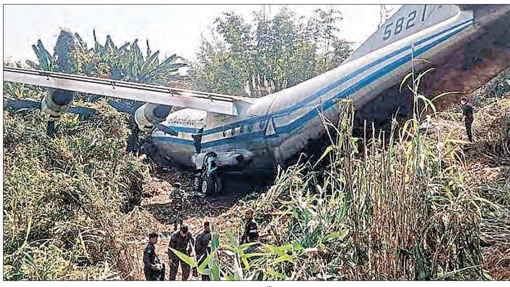
ନିଜ ସେନା ଅଧିକାରୀଙ୍କୁ ଫେରାଇ ନେବା ଲାଗି ଭାରତ ଆସିଥିବା ବିମାନର ଏକ ବାୟୁସେନା ବିମାନ ନିଜେରାମର ଲଙ୍ଘନ ବିମାନ ବନ୍ଦରେ ଅବତରଣ କରିବା ବେଳେ ଦୁର୍ଘଟଣାଗ୍ରସ୍ତ ହୋଇଛି । ଏଥିରେ ଥିବା ୧୪ ଯାତ୍ରୀଙ୍କ ମଧ୍ୟରୁ ୬ ଜଣ ଗୁରୁତର ଆହତ ହୋଇଛନ୍ତି ।

କମ୍ପ୍ୟୁଟର ପ୍ରଣାଳୀ-ଭିତ୍ତିତ ନେବା ମନା ନୂଆଦିଲ୍ଲୀ, ୨୩୧ (ଏକେଡି): ବଜେଟ୍ ଅଧିବେଶନ ଆରମ୍ଭ ହେବା ପୂର୍ବରୁ ସଂସଦ ଭବନର ସୁରକ୍ଷା ଦାୟିତ୍ୱ ସେଣ୍ଟ୍ରାଲ ଇଣ୍ଟିଗ୍ରେଟିଭ ସିଆଲସ୍‌ସ୍‌ସ୍‌ସ୍‌ ହାତକୁ ଯାଇଛି । ସିଆଲସ୍‌ସ୍‌ସ୍‌ସ୍‌ସ୍‌ ୧୪୦ ଯବାନ ସୋମବାର ଠାକୁ ସଂସଦ ଭବନରେ କାର୍ଯ୍ୟାରମ୍ଭ କରିଛନ୍ତି । ଏହି ଯବାନ ସଂସଦ ଅଧିବେଶନ ଦେଖିବାକୁ ଆସୁଥିବା ଦର୍ଶକ ଏବଂ ସେମାନେ ଆସୁଥିବା ସାମଗ୍ରୀ ଯାଞ୍ଚ କରିବେ । ଏହା ସହିତ ଅଗ୍ନିସୁରକ୍ଷା ବ୍ୟବସ୍ଥାର ମଧ୍ୟ ତଦାରଖ କରିବେ । ପୂର୍ବରୁ ସଂସଦ ସୁରକ୍ଷାରେ ମୁଖ୍ୟ ଭୂମିକା ଧରିଆଣ କରୁଥିବା ସିଆଲସ୍‌ସ୍‌ସ୍‌ସ୍‌ସ୍‌ କର୍ମୀଙ୍କୁ ସଂସଦ ପରିସରର ସ୍ଥିତି ବିଷୟରେ ବୁଝାଇଛନ୍ତି । ଏହା ପୂର୍ବରୁ ଗତ ବର୍ଷ ଡିସେମ୍ବର ୧୩ ତାରିଖରେ କିଛି ଲୋକ ସଂସଦରେ ଅନୁପ୍ରବେଶ କରି ହଙ୍ଗାମା କରିଥିଲେ । ଏହାକୁ ନିୟନ୍ତ୍ରଣ କରିବା ପାଇଁ ସୁରକ୍ଷା ମନ୍ତ୍ରାଳୟ ସଂସଦ ସୁରକ୍ଷା ସମାପ୍ତ କରିଥିଲା । ପରେ ସିଆଲସ୍‌ସ୍‌ସ୍‌ସ୍‌ସ୍‌ ମୁଖ୍ୟ ଭୂମିକା ଧରିଆଣ କରିଥିଲା । ରିପୋର୍ଟ ଅନୁଯାୟୀ ସିଆଲସ୍‌ସ୍‌ସ୍‌ସ୍‌ସ୍‌ ଯବାନ ଏବଂ ଡିପେଣ୍ଡେଣ୍ଟ ସିଆଲସ୍‌ସ୍‌ସ୍‌ସ୍‌ସ୍‌ସ୍‌ ଡିପେଣ୍ଡେଣ୍ଟ ସିଆଲସ୍‌ସ୍‌ସ୍‌ସ୍‌ସ୍‌ସ୍‌ ଦର୍ଶକ ଏବଂ ତାଙ୍କ ସାମଗ୍ରୀ ଯାଞ୍ଚ କରିବେ । ଏଥିର କୋଡାକୁ ମଧ୍ୟ ସ୍ଥାନ କରିବାକୁ ପଡ଼ିବ । ଭାରି କ୍ୟାକେଟ୍ ଏବଂ ବେଲୁକୁ ଏକ ଟ୍ରେରେ ରଖାଯାଇ ସ୍ଥାନ କରାଯିବ । ଅନ୍ୟପକ୍ଷରେ କମ୍ପ୍ୟୁଟର ଭିତ୍ତିତ ଏବଂ ପ୍ରଣାଳୀ ଉପରେ ନିର୍ଭର କରୁଥିବା ପାଇଁ ସଂସଦର କର୍ମଚାରୀଙ୍କୁ କୁହାଯାଇଛି ।