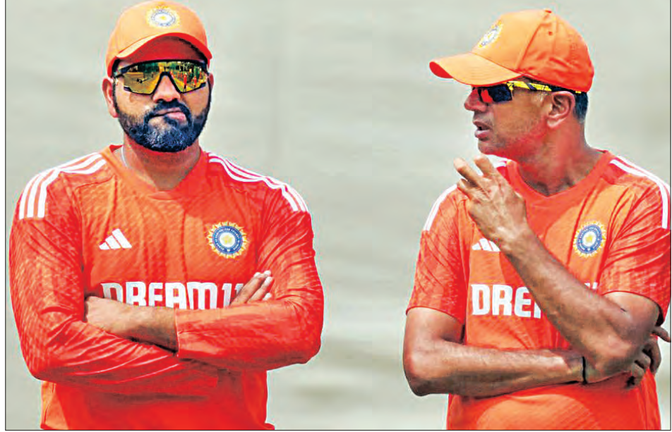
ଟେଷ୍ଟ ମାର୍ଚ୍ଚ ୨ରୁ ଧର୍ମଶାଳାରେ ଖେଳାଯିବ। ଉଭୟ ଦେଶ ଖେଳି କେତେ ସମୟ ବ୍ୟାଟର ଟିଷ୍ଟି ରହିବେ ତାହା ଖେଳ ମଧ୍ୟରେ ଟେଷ୍ଟ ମୁକାବିଲା ବେଶ ରୋମାଞ୍ଚକର ହୋଇଥାଏ। ହେଲେ ଜଣାପଡ଼ିବ। କିନ୍ତୁ 'ଆକ୍ରମଣ ହିଁ ଶ୍ରେଷ୍ଠ ପ୍ରତିରକ୍ଷା'