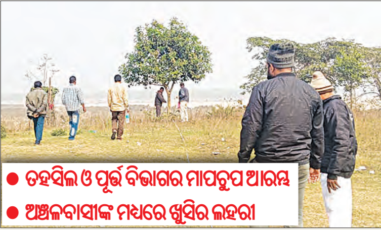
● ତହସିଲ ଓ ପୂର୍ବ ବିଭାଗର ମାପରୂପ ଆରମ୍ଭ ● ଅଧକ୍ଷବାସୀଙ୍କ ମଧ୍ୟରେ ଖୁସିର ଲହରୀ

ଗତ କୁନ ୧୨ତାରିଖ ୫-ଟି ଅଧକ୍ଷ କାର୍ଯ୍ୟକ୍ରମ ପାଳିତ ହୋଇଛି । ସେହି ସମୟରେ ମାଳିକିଆ ପଞ୍ଚାୟତ ବାସୀଙ୍କ ତରଫରୁ ସରକାରଙ୍କୁ ପତ୍ରିକା ଓ ସମସ୍ୟା ସୂଚକା ଯତ୍ନେ ଓଡ଼ିଶାରୁ ପଶ୍ଚିମବଙ୍ଗ ଯିବା ପାଇଁ ସୁବର୍ଣ୍ଣରେଖା ନଦୀ ମାଳିକିଆ ଘାଟ ଉପରେ ଏକ ସ୍ଥାୟୀ ପଲ୍ଲୀ ପୋଲ ନିର୍ମାଣ ପାଇଁ ଦାବିପତ୍ର ଦେଇଥିଲେ । ଏହି ପରିପେକ୍ଷାରେ ଆଜି ସକାଳ ୧୦ଘଟିକାରେ ଜଳେଶ୍ୱର ତହସିଲ ଓ ପୂର୍ବ ବିଭାଗର ମିଳିତ ସହଯୋଗରେ ମାପରୂପ ଆରମ୍ଭ ହେଇଛି । ଏଥିପାଇଁ ଅଧକ୍ଷବାସୀଙ୍କ