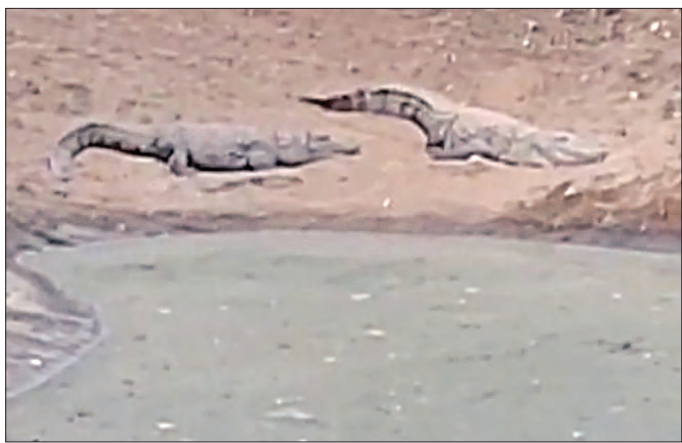
ରାମିଲନାଥରୁ ୨୪ଟି କୁମ୍ଭୀରକୁ ଅଣାଯାଇ ଗବେଷଣା ଆରମ୍ଭ ହୋଇଥିଲା। ପରେ ଗବେଷଣା ପାଇଁ ୧୯୮୮ ମସିହାରେ

କରଖିଆ, ୨୦୧୪(ସମ୍ପାଦକ): ମୟୂରଭଞ୍ଜ ଜିଲ୍ଲା ଯଶ୍ଵନ୍ତୀ ବଜାର ନିକଟରେ ଥିବା ରାମତୀର୍ଥ କୁମ୍ଭୀର ପ୍ରଜନନ ପ୍ରକଳ୍ପ ଦିନେ ସ୍ଵତନ୍ତ୍ର ପରିଚ୍ଛନ୍ନ ସୃଷ୍ଟି କରିଥିବା ବେଳେ ଆଜି ପ୍ରଶାସନିକ ଉଦାହରଣ ଯୋଗୁଁ ତାହା ଅବହେଳିତ ଅବସ୍ଥାରେ ରହି କରୁଛି। ଏହି ପ୍ରକଳ୍ପ ଓ ଗବେଷଣା କେନ୍ଦ୍ର ୧୯୭୯ ମସିହାରେ ରାମତୀର୍ଥଠାରେ ପ୍ରତିଷ୍ଠା କରାଯାଇଥିଲା। ଏବେ କିଛି ଏହି କେନ୍ଦ୍ର ବନ୍ଦ ରହିଛି। ଯେଉଁଠି ଦିନେ ଶହ ଶହ କୁମ୍ଭୀର ରହୁଥିଲେ, ଆଜି କେବଳ ୬ଟି କୁମ୍ଭୀର ରହିଛନ୍ତି। ବିଭିନ୍ନ ପ୍ରକାରର ଗୋମୁହାଁ କୁମ୍ଭୀର ଭାରତରେ ଲୋପ ପାଇଯିବାର ଆଶଙ୍କା କରି ସରକାର ବିଭିନ୍ନ ସ୍ଥାନରେ କୁମ୍ଭୀର ପ୍ରଜନନ କେନ୍ଦ୍ର ସ୍ଥାପନା କରିଛନ୍ତି। ରାମତୀର୍ଥ ସ୍ଥାନଟି ଶିମିଳିପାଳରୁ ବାହାରିଥିବା ଖଲି-ଖଲି ନଦୀ କୂଳରେ ଅବସ୍ଥିତ। ପ୍ରାକୃତିକ ପରିବେଶକୁ ଆଖି ଆଗରେ ରଖି ଏହି ସ୍ଥାନରେ କୁମ୍ଭୀର ପ୍ରକଳ୍ପ