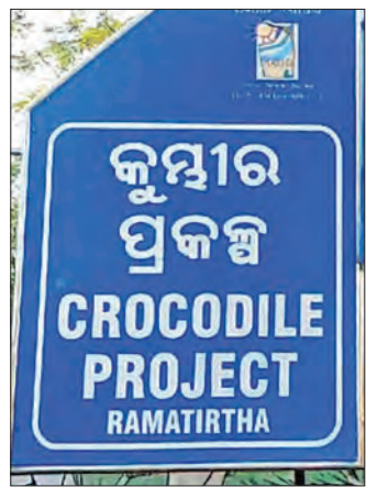
ଶିମିଳିପାଳର ବିଭିନ୍ନ ନଦୀରେ ୬୦୦ରୁ ଉର୍ଦ୍ଧ୍ୱ କୁମ୍ଭୀର ଛଡ଼ାଯାଇଥିଲା। ତେବେ ୨୦୨୦ କୁମ୍ଭୀର ଗଣନା ଅନୁଯାୟୀ ରାମତୀର୍ଥରେ

ଏଠାରେ ଗବେଷଣା କରାଯାଇଥିଲା। ପରବର୍ତ୍ତୀ ସମୟରେ ଏହି ଅଣୁ ଉପରେ ଗବେଷଣା କରି କୁମ୍ଭୀର ପ୍ରଜନନ ମଧ୍ୟ ହୋଇଥିଲା। ଏହି କେନ୍ଦ୍ରରୁ ୮ଟି କୁମ୍ଭୀର ଥିବାବେଳେ ୨୦୨୨ରେ ମାତ୍ର ୬ଟି ରହିଛି। ଏହି ପ୍ରକଳ୍ପ କେନ୍ଦ୍ରକୁ ଦେଖିବା ପାଇଁ ଦେଶ ବିଦେଶରୁ ବହୁ ପର୍ଯ୍ୟଟକଙ୍କ ସୁଅ ଛୁଟୁଥିଲା; କିନ୍ତୁ ଏବେ ଅଳ୍ପ ସଂଖ୍ୟକ କୁମ୍ଭୀର ଥିବାରୁ ପର୍ଯ୍ୟଟକଙ୍କ ସଂଖ୍ୟା ମଧ୍ୟ ଧୀରେ ଧୀରେ କମିବାରେ ଲାଗିଛି; ଯାହାର ସିଧାସଳଖ ପ୍ରଭାବ ପଡ଼ିଛି ପର୍ଯ୍ୟଟନ ଉପରେ। ଏଥିପ୍ରତି ସରକାର ଦୃଷ୍ଟି ଦେଇ ପୁନର୍ବାର ଗବେଷଣା ଓ ପ୍ରଜନନ କେନ୍ଦ୍ର ଆରମ୍ଭ କରାଗଲେ ରାମତୀର୍ଥ ପୂର୍ବ ଗାରିମା ରଖିପାରନ୍ତା ବୋଲି ପର୍ଯ୍ୟଟକମାନେ ମତପ୍ରକାଶ କରିଛନ୍ତି। ତେବେ ରାମତୀର୍ଥ ଏକ ପର୍ଯ୍ୟଟନ କ୍ଷେତ୍ରଭାବରେ ପରିଗଣିତ ହେଉଥିବା ବେଳେ ଏବେ ପ୍ରଶାସନର ଦୃଷ୍ଟିଆଡ଼ୁଆଳରେ ରହିଛି। ଏହାର ପାରିପାର୍ଶ୍ଵିକ ବିକାଶ ସହ ବନ୍ଦ ରହିଥିବା କୁମ୍ଭୀର ପ୍ରକଳ୍ପ ଏବଂ ଗବେଷଣାକୁ ହରମ୍ଭ ଖୋଲିବାକୁ ଦାବି କୋର ଧରିଲାଣି। ତେଣୁ ପ୍ରଶାସନ ଦୃଷ୍ଟି ଦେବାକୁ ଦାବି ହେଉଛି।