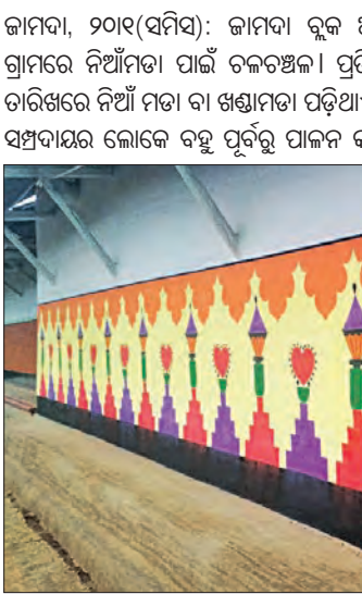
ଏହାକୁ ଆଦିବାସୀ ଭାଷାରେ ସେକେଇ ଲେବେଦ କୁହାଯାଏ। ଭଲ କୁଣ୍ଠି, ଠିକ୍ ସମୟରେ ବର୍ଷା, ଗ୍ରାମର ମଙ୍ଗଳ କାମନା ପୂର୍ବକ ଏହି ନିଆଁମଡ଼ା ପାଳନ ହୋଇଥାଏ। ଗ୍ରାମ ଦେବାଦେବୀକୁ

ଆବାହନ କରିବା ସହିତ ଭକ୍ତମାନେ ଉପାସ ରହି ଅଙ୍ଗା ନିଆଁ ଉପରେ ଚାଲିଥାନ୍ତି। ଏହି ଅବସରରେ ଗ୍ରାମରେ ବିଭିନ୍ନ ପ୍ରକାର କଳାକୃତି ଚିତ୍ର ଅଙ୍କନ କରି ନିଜ ଘରର କାନ୍ଥକୁ ସଜାଇଥାନ୍ତି। ଏଥିସହିତ ଗ୍ରାମ ଦେବତାଙ୍କୁ ସାଗତ କରିବା ପାଇଁ ସମଗ୍ର ଗ୍ରାମକୁ ବିଭିନ୍ନ ରଙ୍ଗରେ ସଜେଇଥାନ୍ତି। ଏହା ଆଦିବାସୀମାନଙ୍କ ଗ୍ରାମ ଦେବତା ଏବଂ ଅନ୍ୟ ଦେବତାଙ୍କ ପ୍ରତି ଥିବା ଭକ୍ତପାଇବା, ବିଶ୍ଵାସ, ନିଷ୍ଠା ଏବଂ ଆଦିବାସୀ କଳାକୃତି, ଚିତ୍ର ଶୈଳୀରେ ଥିବା ଆଗ୍ରହ ଏବଂ ନିପୁଣତାକୁ ମଧ୍ୟ ଦର୍ଶାଇଥାଏ। ଏହାସହ ଗ୍ରାମର ଲୋକ ଯିଏ ଯେଉଁଠି ରହୁଥିଲେ ମଧ୍ୟ ଏହିଦିନ ସମସ୍ତେ ଗ୍ରାମବାହୁଡ଼ା ହୋଇଥାଆନ୍ତି। ଏକାଠି ହୋଇ ଗାଁର ଆନନ୍ଦ ଉଠାନ୍ତି। ଘରେ ଘରେ ବହୁବାନ୍ଧବ ଭର୍ତ୍ତି। ନିଆଁରା ଭଙ୍ଗରେ ଗ୍ରାମବାସୀ ଏକାଠି