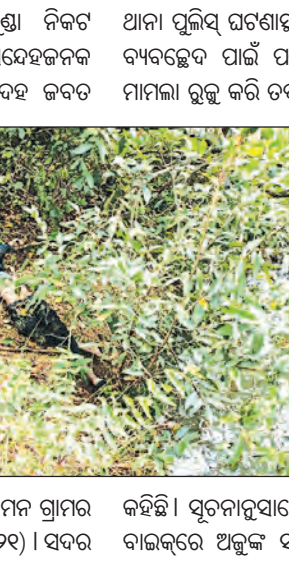
ଘଟଣାସ୍ଥଳରେ ଯୁବକଙ୍କ ଶବ ଉଦ୍ଧାର କରାଯାଇଛି।