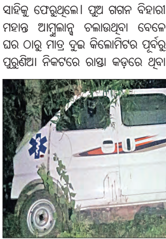
ଶିଶୁ ମୃତ୍ୟୁ ଘଟଣାର ସ୍ଥଳରେ ଉଦ୍ଧାର କରାଯାଇଥିବା ଆମ୍ବୁଲାନ୍ସର ଚାକିରୀ ଥିବା ଅଞ୍ଚଳର ଏକ ଦୃଶ୍ୟ।