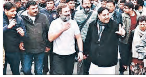
ରାହୁଲ, ୧୪/୧ (ଏକେନ୍ଦ୍ରି)

ପ୍ରାୟ ବର୍ଷକ ପରେ ଭାରତ ଯୋଡ଼ୋ ଯାତ୍ରାର ଦ୍ଵିତୀୟ ଫେରାଉ ଭାବେ କଂଗ୍ରେସ ନେତା ରାହୁଲ ଗାନ୍ଧୀ ରବିବାର ମଣିପୁରକୁ ଭାରତ ଯୋଡ଼ୋ ନ୍ୟାୟ ଯାତ୍ରା ଆରମ୍ଭ କରିଛନ୍ତି । ଦଳର ବହୁ ବରିଷ୍ଠ ନେତାଙ୍କ ସହ ରାହୁଲ ରବିବାର ସକାଳେ ଏକ ଘରୋଇ ବିମାନରେ ଇମ୍ଫାଲରେ ପହଞ୍ଚିବା ପରେ ଖୋଜକୋମ୍ ଠାରେ ୧୮ ଓ ୧୯ ଆଜିଲୋ-ମଣିପୁର ଯୁଦ୍ଧ ସହିଦମାନଙ୍କ ଉଦ୍‌ଘୋଷଣା ଦେଇଥିଲେ । ଏହାପରେ ସେ ଏଠାରେ ଆୟୋଜିତ ଏକ ରାଲିରେ ଯୋଗ ଦେଇ ଜନସଭାକୁ ସମ୍ବୋଧିତ କରିଥିଲେ । ଏହି ଅବସରରେ ଉତ୍ତରୀ ମେ 'ମାସକୁ ମଣିପୁରରେ ଆରମ୍ଭ ହୋଇଥିବା ସାମ୍ବାଦିକ ହିଂସା ଏବଂ ଏଥିରେ ହଜାର ହଜାର ପାଠିତଙ୍କ ବେଦନାର କଥା କହିଥିଲେ । ବର୍ତ୍ତମାନ ସୁଦ୍ଧା ରାଜ୍ୟର ହଜାର ହଜାର ନିର୍ଦ୍ଦାୟୀ ପ୍ରାପିତ ଲୋକ ଦୁର୍ଦ୍ଦଶା ମଧ୍ୟକୁ ନେଇ ହୋଇଯାଇଥିଲା ବେଳେ ମୋଦୀ ସରକାରଙ୍କ ଏଥିପାଇଁ ଚିତ୍କେ ମାତ୍ର ଶୋଚନା ନାହିଁ ବୋଲି ରାହୁଲ କହିଥିଲେ । ପ୍ରଧାନମନ୍ତ୍ରୀ ମୋଦୀ