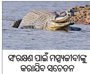
ସଂରକ୍ଷଣ ପାଇଁ ମୟୂଜୀବାକୁ କରାଯିବ ସଚେତନ

■ ଭୁବନେଶ୍ୱର, ୧୪।୧ (ସମ୍ବିଧା): ରାଜ୍ୟରେ ଘଡ଼ିଆଳ କୁମ୍ଭୀରଙ୍କ ସୁରକ୍ଷା ଓ ସଂରକ୍ଷଣ ସୁନିଶ୍ଚିତ କରିବେ 'କୁମ୍ଭୀର ବନ୍ଧୁ'। ବର୍ତ୍ତମାନ କୁମ୍ଭୀରଙ୍କ ସଂଖ୍ୟା ଓ ସଂରକ୍ଷଣ ଦୃଷ୍ଟିରେ ଭିତରକନିକା ବର୍ତ୍ତମାନ ଦେଶ ବିଦେଶରେ ପରିଚିତ ପାଇଛି। କୁମ୍ଭୀରଙ୍କ ଅନ୍ୟ ଏକ ପ୍ରକାରି ମରଗଜ ସଂଖ୍ୟା ମଧ୍ୟ ଓଡ଼ିଶାରେ ବେଶ୍ ଭଲ ରହିଛି। ଏହି ଦୁଇ ପ୍ରକାରିକ ଭଳି ଘଡ଼ିଆଳଙ୍କ ସଂଖ୍ୟା କିପରି ବୃଦ୍ଧି ପାଇବ ତାକୁ ବନ ବିଭାଗ ଗୁରୁତ୍ୱ ଦେଉଛି। ଏଥିପାଇଁ 'ଗଜ ସାଥୀ' ଢାଆଁରେ 'କୁମ୍ଭୀର ବନ୍ଧୁ' ନାମରେ ଏକ ଯୋଜନା ପ୍ରସ୍ତୁତ କରିଛି ବନ ବିଭାଗ। ଘଡ଼ିଆଳଙ୍କ ସଂରକ୍ଷଣ ଓ ସଂଖ୍ୟା ବୃଦ୍ଧି ପାଇଁ ଏହି 'କୁମ୍ଭୀରବନ୍ଧୁ' ନାମରେ