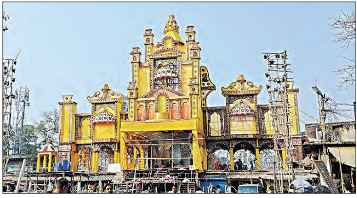
ତଥା ଦେବକୀ-ବସୁଦେବଙ୍କୁ କାରାଗାର ପ୍ରେରଣ ଦୃଶ୍ୟ ଅଭିନୀତ ହେବ । ବରଗଡ଼ରେ କୋଣାର୍କ ପାଣ୍ଡୁଲିପି ନ ଥିବା ବେଳେ ମହାଭାରତ, ହରିବଂଶ ପୁରାଣ,

ଧନୁଯାତ୍ରା ଅବସରରେ ବରଗଡ଼ ସହର ମଥୁରା ନଗରୀ, ଅମ୍ବାପାଳି ଗୋପପୁର ଏବଂ ଜାଣା ନଦୀ ପୁରାଣବର୍ଣ୍ଣିତ ମୁଖ୍ୟ ନଦୀ ଭାବରେ ଉପାନ୍ତରୀତ ହୋଇଥିବ । ସହର ସମସ୍ତ ଜନସାଧାରଣ ମଥୁରା ନଗରୀର ଜଣେ ଜଣେ ପ୍ରଜା ଭାବରେ ପରିଗଣିତ ହେବେ । ଏହି ଧନୁଯାତ୍ରା ଉପଯୋଗୀ ସହ ମଥୁରା ନଗରୀ (ପରିବର୍ତ୍ତିତ ବରଗଡ଼)ର ଶାସନଭାର ମହାରାଜ କଂସଙ୍କ ହାତକୁ ଚାଲିଯିବ । ଉତ୍ତୁସେନଙ୍କ ନିର୍ଦ୍ଦେଶରେ ଦେବକୀ ବସୁଦେବଙ୍କ ବିବାହ, ଦୈବବାଣୀ, ଉତ୍ତୁସେନଙ୍କୁ ଗାଦିତ୍ୟୁତ କରି ଯୁଦ୍ଧରାଜ କଂସଙ୍କ ଦିହାସନ ଆରୋହଣ