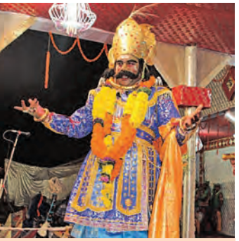
ପର୍ବହତ ପୁରୀକାଶ ରଙ୍ଗମଞ୍ଚରେ ୧୧ ଦିନ ଧରି ଚାଲିବ ଅଭିନୟ ବରଗଡ଼ ସହରରେ ମଥୁରାନଗରୀ, ଅନୁପାଳି ପାଳିବ ଗୋପପୁର ଜାଗା ନଦୀ ସାହିବ ଯମୁନା

■ ବରଗଡ଼, ୧୪।୧ (ସମ୍ବିଧା): ସୋମବାରଠାରୁ ଆନୁଷ୍ଠାନିକ ଭାବେ ଆରମ୍ଭ ହେବ ବିଶ୍ୱ ପର୍ବହତ ପୁରୀକାଶ ରଙ୍ଗମଞ୍ଚ। ବରଗଡ଼ରେ ହୋଇଥିବା ପୁରୀକାଶ ଏହି ବିଶ୍ୱପ୍ରସିଦ୍ଧ ଧନୁଯାତ୍ରା ମହୋତ୍ସବ ୧୧ ଦିନ ଧରି ଚାଲିବ। ଏହି ସମୟରେ ବରଗଡ଼ ସହର, ମଥୁରାନଗରୀ ଏବଂ ଉପକଣ୍ଠରେ ଥିବା ଅନୁପାଳି ଗାଁ ଗୋପପୁର ପରିଗଣିତ ହୁଏ। ଏହା ମଝିରେ ପ୍ରବାହିତ ହେଉଥିବା ଜାଗା ନଦୀ, ଯମୁନା ନଳରେ ପରିଗଣିତ ହେବ। ବରଗଡ଼ ସହରର ଜନସାଧାରଣ ମଥୁରାନଗରୀର ପ୍ରଜା ଏବଂ ଅନୁପାଳିରେ ସମସ୍ତେ ଗୋପପୁରବାସୀ ଭାବେ ଏହି ବର୍ଷାଦି ଅଭିନୟ ପରମ୍ପରାରେ ସାମିଲ ହେବେ। ଚଳିତବର୍ଷ ୭୬ ବର୍ଷରେ ପଦାର୍ପଣ କରୁଛି ଏହି ମହୋତ୍ସବ। ଏଥିପାଇଁ ସହରସାରା ଉତ୍ସାହ ଆଲୋକମାଳାରେ