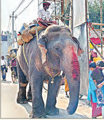
ଏହାକୁ ନେଇ ବରଗଡ଼ ସହର ଚଳଚଞ୍ଚଳ ହୋଇପଡ଼ିଛି । ରବିବାର ମହାରାଜା କଂସ, ପରେ ମଥୁରା ନଗରୀର ଅଧିବାସୀଙ୍କ ପାତ୍ରମନ୍ତ୍ରାଳୟ ପାଇଁ ହାତୀ, ଘୋଡ଼ା ଗାଡ଼ି, ବ୍ୟାପାର ହୋଇ ଗଲାଣି । ହାତୀ ପହଞ୍ଚିବା ପରେ ମଥୁରା ନଗରୀର ଅଧିବାସୀଙ୍କ ମନରେ ନୂତନ ଉତ୍ସାହ ଜାରି ଉଠିଛି ।

ବରଗଡ଼, ୧୪୧୨(ସମ୍ପାଦକ) : ବିଶ୍ୱପ୍ରସିଦ୍ଧ ଓଟ୍ ସାଙ୍କୁ ଅନ୍ୟାନ୍ୟ ରାଜକାୟ ବାହନ ବରଗଡ଼ ଧନୁଯାତ୍ରା ମହୋତ୍ସବ ଚଳିତ ପହଞ୍ଚିଛି । ଆଜି ମହାରାଜା କଂସଙ୍କ ହାତୀ ବର୍ଷ ୭୭ ବର୍ଷରେ ପଦାର୍ପଣ କରିଛି ।