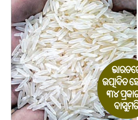
ଭାରତରେ ଉତ୍ପାଦିତ ହେଉଛି ୩୪ ପ୍ରକାରର ବାସୁମତି

■ ନୂଆଦିଲ୍ଲୀ, ୧୪।୧ (ଏକ୍ସପ୍ରେସ୍): ଭାରତୀୟ ବାସୁମତି ଚାଉଳକୁ ବିଶ୍ୱ ଶ୍ରେଷ୍ଠ ଚାଉଳ ମାନ୍ୟତା ମିଳିଛି। ଲୋକପ୍ରିୟ ଖାଦ୍ୟ ବିଶ୍ୱାସକାରୀଙ୍କ ଦ୍ୱାରା 'ଟେଣ୍ଡ ଆରଲାସ୍' ପକ୍ଷରୁ ବାସୁମତି ଚାଉଳକୁ ବର୍ଷ ୨୦୨୩-୨୪ ପାଇଁ ବିଶ୍ୱର ସର୍ବୋତ୍ତମ ଚାଉଳ ମାନ୍ୟତା ପ୍ରଦାନ କରାଯାଇଛି। ନିକଟରେ ଏହି ସଂସ୍ଥା ବିଶ୍ୱର ୧୦୦ ଶ୍ରେଷ୍ଠ ବ୍ୟଞ୍ଜନ ତାଲିକାରେ ଭାରତକୁ ୧୧ ତମ ସ୍ଥାନରେ ରଖିଥିଲା। ଏବେ ଭାରତର ବାସୁମତି ଚାଉଳକୁ 'ଟେଣ୍ଡ ଆରଲାସ୍' ହୁନିଆର ସବୁଠାରୁ ଭଲ ଚାଉଳ ବୋଲି କହିଛି। ସୁଗନ୍ଧିତ ବାସୁମତି ଚାଉଳ ଶତାବ୍ଦୀ ଧରି ଭାରତୀୟ ଉପମହାଦେଶୀୟ ହିମାଳୟ ପାଦଦେଶର ନିର୍ଦ୍ଦିଷ୍ଟ କେତେକ ଅଞ୍ଚଳରେ ଉତ୍ପାଦନ ହୋଇ ଆସୁଛି। ଭାରତ ସମେତ ପାକିସ୍ତାନରେ ମଧ୍ୟ ଏହି