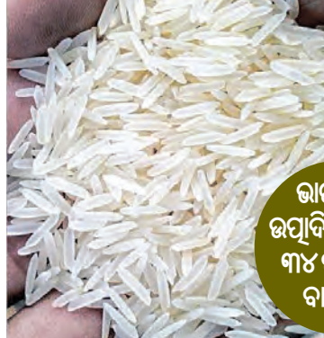
ଭାରତରେ ଉତ୍ପାଦିତ ହେଉଛି ୩୪ ପ୍ରକାରର ବାସୁମତି

■ ନୂଆଦିଲ୍ଲୀ, ୧୪/୧ (ଏକେପ୍ଟିଭ): ଭାରତୀୟ ବାସୁମତି ଚାଉଳକୁ ବିଶ୍ଵ ଶ୍ରେଷ୍ଠ ଚାଉଳ ମାନ୍ୟତା ମିଳିଛି। ଲୋକପ୍ରିୟ ଖାଦ୍ୟ ବିଶ୍ଵାସକାରୀଙ୍କ ଦ୍ଵାରା 'ଚେଷ୍ଟା ଆରମ୍ଭ' ପକ୍ଷରୁ ବାସୁମତି ଚାଉଳକୁ ବର୍ଷ ୨୦୧୩-୧୪ ପାଇଁ ବିଶ୍ଵ ସର୍ବୋତ୍ତମ ଚାଉଳ ମାନ୍ୟତା ପ୍ରଦାନ କରାଯାଇଛି। ନିକଟରେ ଏହି ସମ୍ମାନ ବିଶ୍ଵର ୧୦୦ ଶ୍ରେଷ୍ଠ ବ୍ୟଞ୍ଜନ ତାଲିକାରେ ଭାରତକୁ ୧୧ ତମ ସ୍ଥାନରେ ରଖିଥିଲା। ଏବେ ଭାରତର ବାସୁମତି ଚାଉଳକୁ 'ଚେଷ୍ଟା ଆରମ୍ଭ' ଦ୍ଵାରା ସମୁଦାୟରୁ ଭଲ ଚାଉଳ ବୋଲି କହିଛି। ସୁଗନ୍ଧିତ ବାସୁମତି ଚାଉଳ ଶତାଧିକ ଧରି ଭାରତୀୟ ଉପମହାଦେଶୀୟ ହିମାଳୟ ପାଦଦେଶର ନିର୍ଦ୍ଦିଷ୍ଟ କେତେକ ଅଞ୍ଚଳରେ ଉତ୍ପାଦନ ହୋଇ ଆସୁଛି। ଭାରତ ସମେତ ପାକିସ୍ତାନରେ ମଧ୍ୟ ଏହି