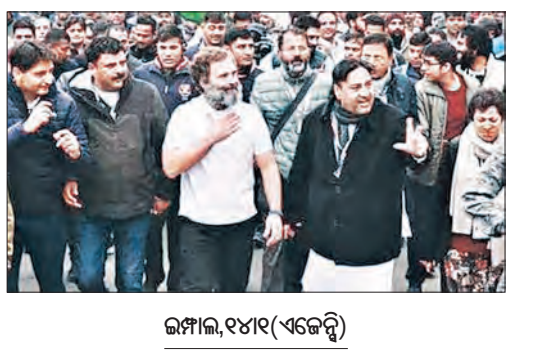
ରାହୁଲ, ୧୪/୧ (ଏକେନ୍ଦ୍ରି)

ପ୍ରାୟ ବର୍ଷକ ପରେ ଭାରତ ଯୋଡ଼ୋ ଯାତ୍ରାର ଦ୍ଵିତୀୟ ଫେରାଉ ଭାବେ କଂଗ୍ରେସ ନେତା ରାହୁଲ ଗାନ୍ଧୀ ରବିବାର ମଣିପୁରରୁ ଭାରତ ଯୋଡ଼ୋ ନ୍ୟାୟ ଯାତ୍ରା ଆରମ୍ଭ କରିଛନ୍ତି । ଦଳର ବହୁ ବିରକ୍ଷ ନେତାଙ୍କ ସହ ରାହୁଲ ରବିବାର ସକାଳେ ଏକ ଘରୋଇ ବିମାନରେ ଉଡ଼ାଣରେ ପହଞ୍ଚିବା ପରେ ଖୋର୍ଦ୍ଧାକୋମ୍ ଠାରେ ୧୮ ଓ ୧୯ ଆଳୋଚନା-ମଣିପୁର ଯୁଦ୍ଧ ସହିଦମାନଙ୍କ ଉଦ୍‌ଦେଶ୍ୟରେ ଶ୍ରଦ୍ଧାଞ୍ଜଳି ଦେଇଥିଲେ । ଏହାପରେ ସେ ଏଠାରେ ଆୟୋଜିତ ଏକ ରାଲିରେ ଯୋଗ ଦେଇ ଜନସଭାକୁ ସମ୍ବୋଧିତ କରିଥିଲେ । ଏହି ଅବସରରେ ଉତ୍ତରଣେ 'ମେ 'ମାସକୁ ମଣିପୁରରେ ଆରମ୍ଭ ହୋଇଥିବା ସାମ୍ବାଦିକ ହିଂସା ଏବଂ ଏଥିରେ ହଜାର ହଜାର ପାଠିକଙ୍କ ବେଦନାର କଥା କହିଥିଲେ । ବର୍ତ୍ତମାନ ଯୁଦ୍ଧା ରାଜ୍ୟର ହଜାର ହଜାର ନିର୍ଦ୍ଦୀୟ ପ୍ରାପାଦିତ ଲୋକ ଦୁର୍ଦ୍ଦଶା ମଧ୍ୟକୁ ନେଇ ହୋଇଯାଇଥିଲା ବେଳେ ମୋଦୀ ସରକାରଙ୍କ ଏଥିପାଇଁ ଚିତେ ମାତ୍ର ଶୋଚନା ନାହିଁ ବୋଲି ରାହୁଲ କହିଥିଲେ । ପ୍ରଧାନମନ୍ତ୍ରୀ ମୋଦୀ