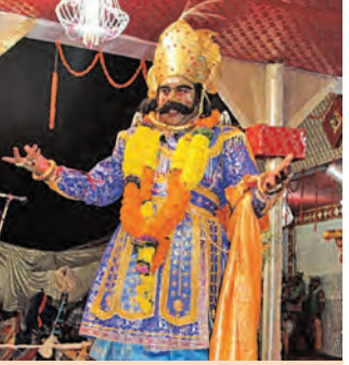
ସର୍ବବୃହତ୍ ମୁକ୍ତାକାଶ ରଙ୍ଗମଞ୍ଚରେ ୧୧ ଦିନ ଧରି ଚାଲିବ ଅଭିନୟ ବରଗଡ଼ ସହର ହେବ ମଥୁରାନଗର, ଅନୁପାଳି ପାଲଟିବ ଗୋପପୁର ଜାଗା ନଦୀ ସାହିବ ଯମୁନା

■ ବରଗଡ଼, ୧୪/୧ (ସମ୍ପାଦକ): ସୋମବାରଠାରୁ ଆନୁଷ୍ଠାନିକ ଭାବେ ଆରମ୍ଭ ହେବ ବିଶ୍ଵ ସର୍ବବୃହତ୍ ମୁକ୍ତାକାଶ ରଙ୍ଗମଞ୍ଚ। ବରଗଡ଼ରେ ହୋଇଥିବା ଧନୁଯାତ୍ରା ଏହି ବିଶ୍ଵପ୍ରସିଦ୍ଧ ଧନୁଯାତ୍ରା ମହୋତ୍ସବ ୧୧ ଦିନ ଧରି ଚାଲିବ। ଏହି ସମୟରେ ବରଗଡ଼ ସହର, ମଥୁରାନଗର ଏବଂ ଉପକଣ୍ଠରେ ଥିବା ଅନୁପାଳି ଗାଁ ଗୋପପୁର ପରିଗଣିତ ହୁଏ। ଏହା ମଝିରେ ପ୍ରବାହିତ ହେଉଥିବା ଜାଗା ନଦୀ, ଯମୁନା ନଳରେ ପରିଗଣିତ ହେବ। ବରଗଡ଼ ସହରର ଜନସାଧାରଣ ମଥୁରାନଗରର ପ୍ରଜା ଏବଂ ଅନୁପାଳିରେ ସମସ୍ତେ ଗୋପପୁରବାସୀ ଭାବେ ଏହି ବର୍ଷାନ୍ତ ଆନନ୍ଦ ପରମ୍ପରାରେ ସାମିଲ ହେବେ। ଚଳିତବର୍ଷ ୭୬ ବର୍ଷରେ ପଦାର୍ପଣ କରୁଛି ଏହି ମହୋତ୍ସବ। ଏଥିପାଇଁ ସହରସାରା ଉତ୍ସୁକ ଆଲୋକମାଳାରେ