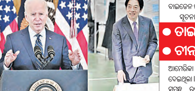
ଖାଣ୍ଟିଚନ, ୧୪/୧ (ଏକେନ୍ଦ୍ରି)

ଆମେରିକା କୁଟନୀ କୂଟନୀତିର ଆଉ ଏକ ଉଦାହରଣ ସାମ୍ବାକୁ ଆସିଛି । ତାଇଝାନ ରାଷ୍ଟ୍ରପତି ନିର୍ବାଚନରେ ଚାନ୍ ବିରୋଧୀ ନେତା ଖିଲିୟନ ଲାଭ ଚିଙ୍ଗ-ତେକ ବିଜୟ ପରେ ଆମେରିକା ନିଜ ନୀତିରେ ବିରାଟ ପରିବର୍ତ୍ତନ କରିଛି । ଏହି ଦେଶ ତାଇଝାନକୁ ସବୁଠାରୁ ବଡ଼ ଧୋକା ଦେଇଛି । ତାଇଝାନ ସ୍ଵାଧୀନତାକୁ ଆମେରିକା ସମର୍ଥନ କରୁନାହିଁ ବୋଲି ରାଷ୍ଟ୍ରପତି ଜୋ ବାଇଡେନ କହିଛନ୍ତି । ଏହା ପୂର୍ବରୁ ବାଇଡେନ ଅନେକ ଥର ତାଇଝାନ ସମର୍ଥନରେ ମନ୍ଦବ୍ୟ ଦେଇଥିଲେ । ସେ ୨୦୨୦ରେ ଏହାର ବାପିତ ଘୋଷଣା କରିଥିଲେ । ଚାନ୍ ଆକ୍ରମଣ କଲେ ଆମେରିକା ତାଇଝାନର ସ୍ଵାଧୀନତାକୁ ସୁରକ୍ଷା ଦେବ ବୋଲି କହିଥିଲେ । ଏବେ ଚାନ୍ ଚାପରେ ଆମେରିକା ନିଜ