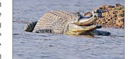
ସଂରକ୍ଷଣ ପାଇଁ ମାୟାଜୀବାକୁ କରାଯିବ ସଚେତନ

■ ଭୁବନେଶ୍ଵର, ୧୪/୧ (ସମ୍ପାଦକ): ରାଜ୍ୟରେ ଘଡ଼ିଆଳ କୁମ୍ଭୀରଙ୍କ ସୁରକ୍ଷା ଓ ସଂରକ୍ଷଣ ସୁନିଶ୍ଚିତ କରିବେ 'କୁମ୍ଭୀର ବନ୍ଧୁ'। ବର୍ତ୍ତମାନ କୁମ୍ଭୀରଙ୍କ ସଂଖ୍ୟା ଓ ସଂରକ୍ଷଣ ଦୃଷ୍ଟିରେ ଭିତରକନିକା ବର୍ଗମାନ ଦେଶ ବିଦେଶରେ ପରିତ୍ୟକ୍ତ ପାଇଛି। କୁମ୍ଭୀରଙ୍କ ଅନ୍ୟ ଏକ ପ୍ରକାରି ମଗରଙ୍କ ସଂଖ୍ୟା ମଧ୍ୟ ଓଡ଼ିଶାରେ ବେଶ୍ ଭଲ ରହିଛି। ଏହି ଦୁଇ ପ୍ରକାରୀକ ଭଳି ଘଡ଼ିଆଳଙ୍କ ସଂଖ୍ୟା କିପରି ବୃଦ୍ଧି ପାଇବ ତାକୁ ବନ ବିଭାଗ ଗୁରୁତ୍ଵ ଦେଉଛି। ଏଥିପାଇଁ 'ଗଜ ସାଥୀ' ଜାଆଁରେ 'କୁମ୍ଭୀର ବନ୍ଧୁ' ନାମରେ ଏକ ଯୋଜନା ପ୍ରସ୍ତୁତ କରିଛି ବନ ବିଭାଗ। ଘଡ଼ିଆଳଙ୍କ ସଂରକ୍ଷଣ ଓ ସଂଖ୍ୟା ବୃଦ୍ଧି ପାଇଁ ଏହି 'କୁମ୍ଭୀରବନ୍ଧୁ' ନାମରେ