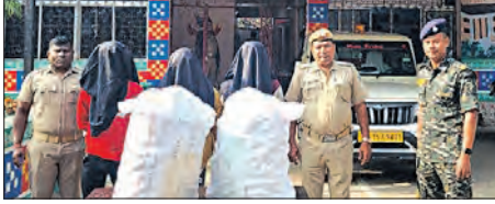
ସମ୍ବଲପୁରରେ କୋରେକ୍ସ ମାଫିଆକୁ ବିଚାର କରିବା ପାଇଁ ଆନ୍ଧ୍ରଜିଲ୍ଲା ପଦକ୍ଷେପ ନେଇଛି।