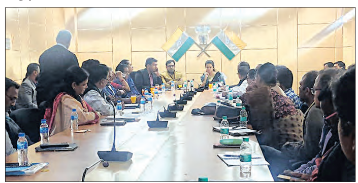
ସମ୍ବଲପୁରରେ କୋରେକ୍ସ ମାଫିଆକୁ ବିଚାର କରିବା ପାଇଁ ଆନ୍ଧ୍ରଜିଲ୍ଲା ପଦକ୍ଷେପ ନେଇଛି।