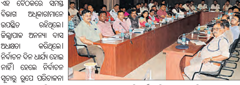
ସମ୍ବଲପୁର ନିର୍ବାଚନକୁ ନେଇ ପ୍ରଶାସନର ସମନ୍ୱୟ ବୈଠକ ଅନୁଷ୍ଠାନ କରାଯାଇଛି।