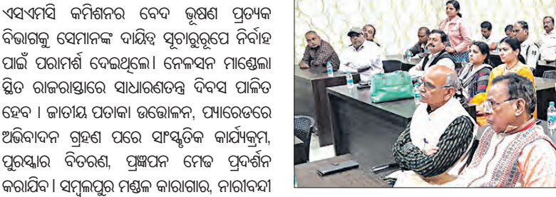
ସମ୍ବଲପୁର ନିର୍ବାଚନକୁ ନେଇ ପ୍ରଶାସନର ସମନ୍ୱୟ ବୈଠକ ଅନୁଷ୍ଠାନ କରାଯାଇଛି।