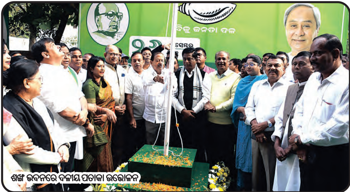
ଶର୍ମା ଭବନରେ ଦଳୀୟ ପତାକା ଉତ୍ତୋଳନ