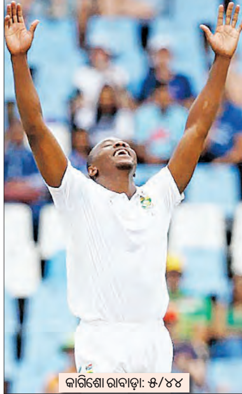
କାରିସୋ ରାବାଡା: ୫/୪୪

ଶୁଭମାନ ଗିଲ୍ ୨ ଓ ଯଶସୀ ଜୟସାଲ ୧୬ ରନ୍ କରିଥିଲେ। ବିରାଟ କୋହଲି ଓ ଶ୍ରେୟସ ଆୟର ପାଇଥିବା ଗୋଟିଏ ଲେଖାଏଁ କାବନବାନରୁ ଫାଇଦା ଉଠାଇ ଭଲ ବ୍ୟାଟ୍ କରିବା ଫଳରେ ମଧ୍ୟାହ୍ନ ଭୋଜନ ସୁଦ୍ଧା ଭାରତ ୩ ଡିକେଟରେ ୯୯ ରନ୍ କରିଥିଲା।