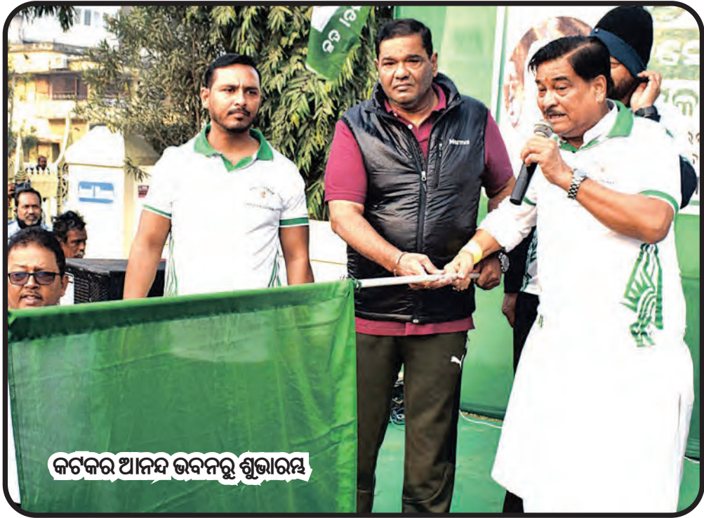
କଟକର ଆନନ୍ଦ ଭବନରୁ ଶୁଭାରମ୍ଭ