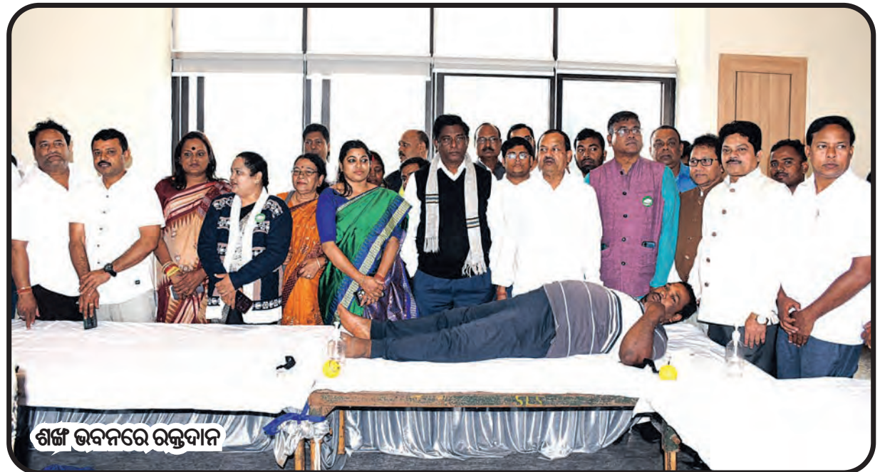
ଶର୍ମା ଭବନରେ ରକ୍ତଦାନ