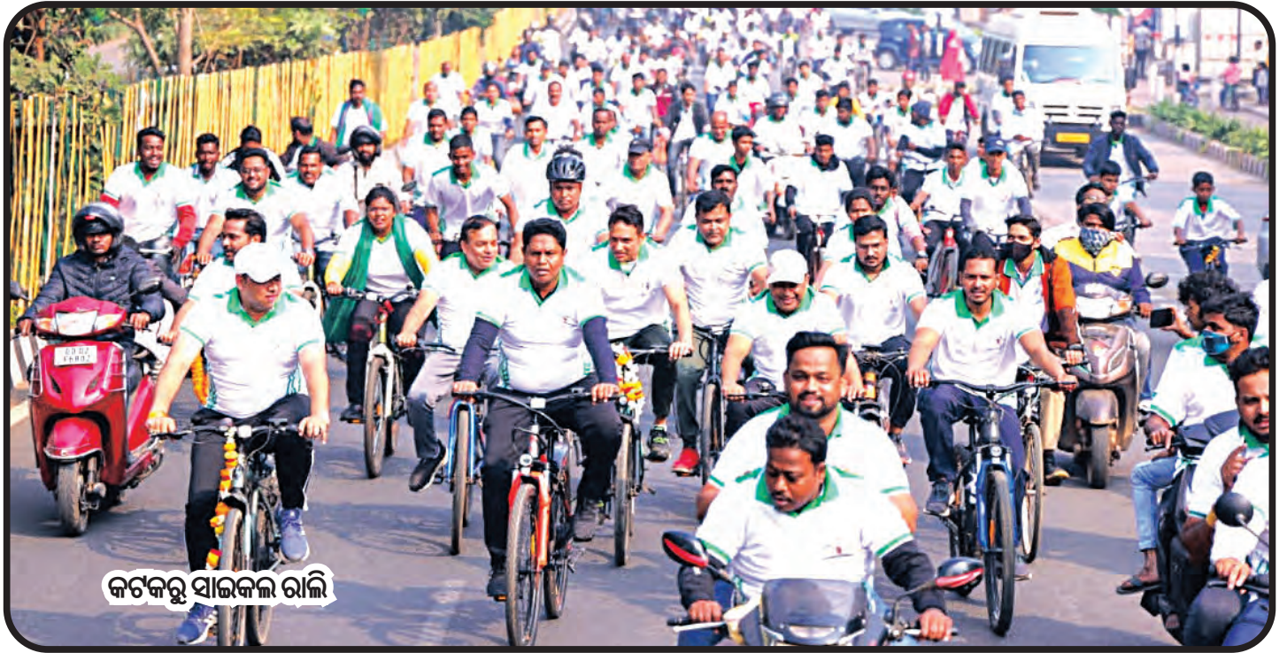
କଟକରୁ ସାଇକଲ ରାଲି