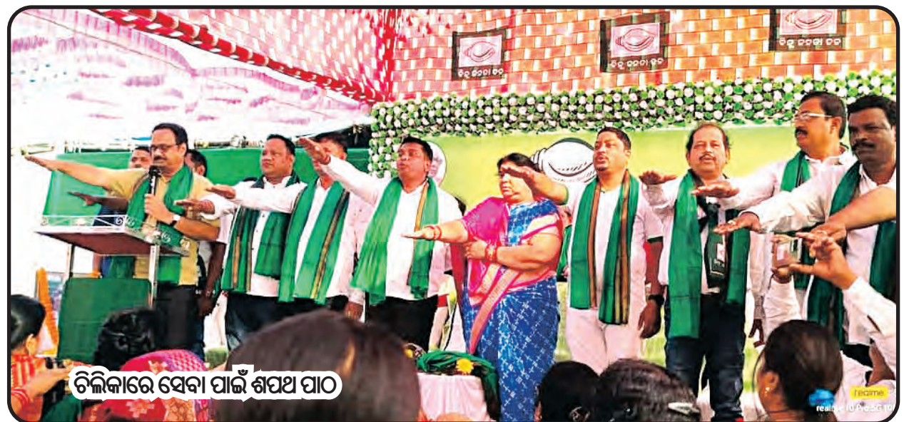
ଚିଲିକାରେ ସେବା ପାଇଁ ଶପଥ ପାଠ