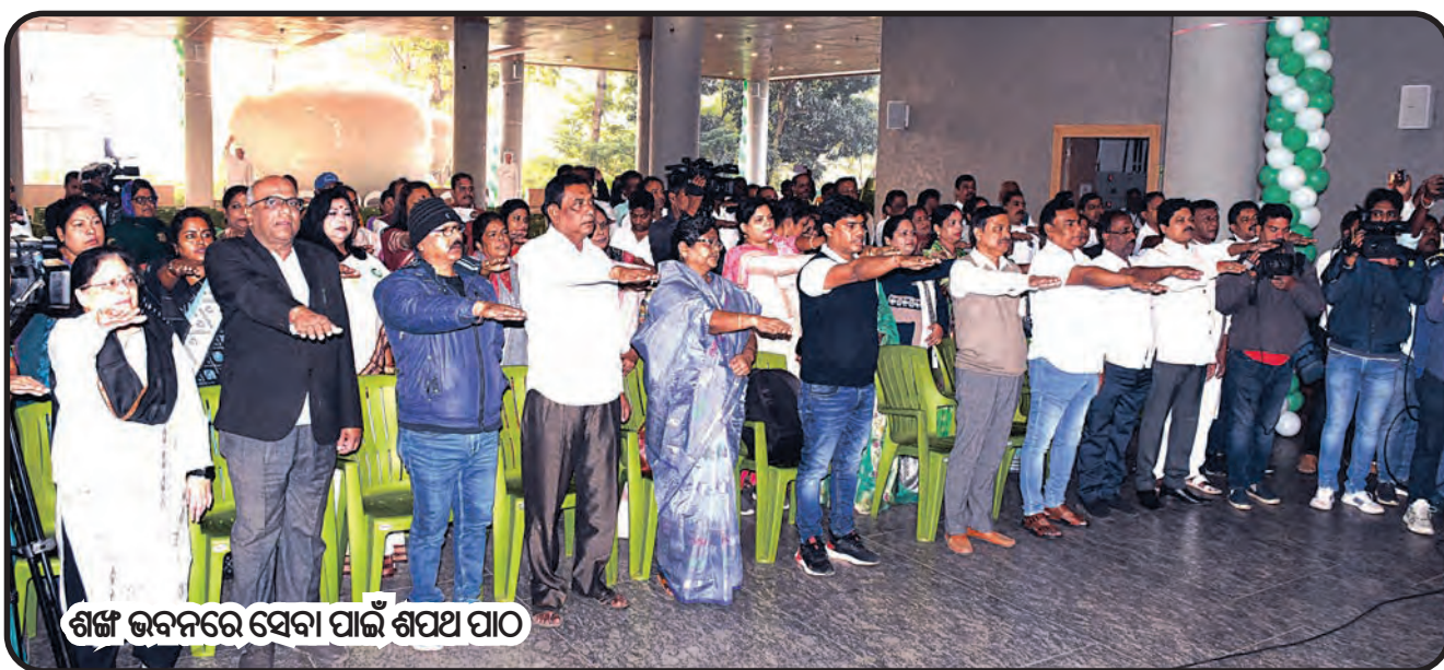
ଶର୍ମା ଭବନରେ ସେବା ପାଇଁ ଶପଥ ପାଠ