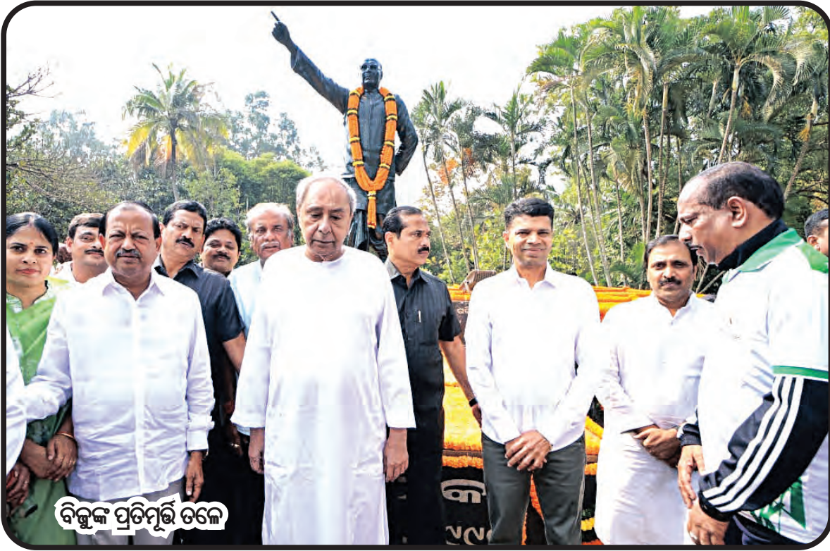
ବିଜୁଙ୍କ ପ୍ରତିମୂର୍ତ୍ତି ତଳେ