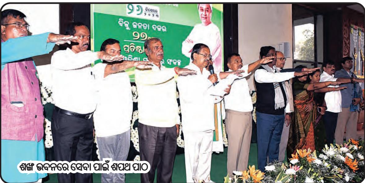
ଶର୍ମା ଭବନରେ ସେବା ପାଇଁ ଶପଥ ପାଠ