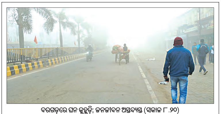
ବରଗଡ଼ରେ ଘନ କୁହୁଡ଼ି; ଜନଜୀବନ ଅସ୍ତବ୍ୟସ୍ତ (ସକାଳ ୮.୨୦)