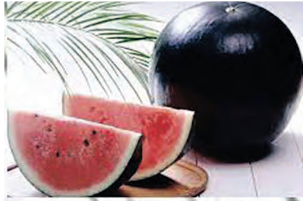
କମିଥିଲେ ମଧ୍ୟ ରାହିଦା କମି ନ ଥିଲା । ବହୁ ଦେଶରୁ ଏହାକୁ କିଣିବା ପାଇଁ ଅର୍ଡର ଆସୁଥିଲେ ମଧ୍ୟ ଏହା ସମସ୍ତଙ୍କୁ ମିଳିପାରେ ନାହିଁ । ପ୍ରଥମ ଥର ପାଇଁ ଏହାକୁ ୨୦୦୮ ମସିହାରେ ଚାଷ କରାଯାଇଥିଲା । ସେତେବେଳେ ଏହି ତରଭୁଜକୁ ଚାରିଲକ୍ଷ ଟଙ୍କାରେ ବିକ୍ରି କରାଯାଇଥିଲା ।

ଆମ ଦେଶରେ ଖରାଦିନେ ଲୋକେ ଅଧିକ ତରଭୁଜ ଖାଇଥାନ୍ତି । ଏହି ଉପାଦାନ ପକଟି ଲୋକଶୋଷ ମୋକ୍ଷାଇଥାଏ । ତରଭୁଜ କିଲୋ ପିଛା ବିକ୍ରି ହୁଏ, ଯାହାର ଦର ଗ୍ରାହକ ସହଗାମୀ । କିନ୍ତୁ ବିଶ୍ୱରେ ଏମିତି ଗୋଟିଏ ତରଭୁଜ ଅଛି ଯାହାକୁ ନିଲାମ ମାଧ୍ୟମରେ ବିକ୍ରି କରାଯାଏ । ଏହାର ଦାମ୍ ବି ଲକ୍ଷଧିକ ଟଙ୍କା । ଡେନ୍ମାର୍କରେ ତରଭୁଜକୁ ବିଶ୍ୱର ସବୁଠୁ ଦାମୀ ତରଭୁଜ କୁହାଯାଏ । ଏହା 'ଗ୍ଲୋବ୍ ଖାଟେନେଲନ୍' ଭାବେ ମଧ୍ୟ ଜଣାଶୁଣା । ଜାପାନର ହୋକାଇଡୋ ଦ୍ୱୀପରେ ଏହା ଚାଷ କରାଯାଏ । ଏହା ବେଶ୍ କମ୍ ଫଳୁଥିବା କାରଣରୁ ଏହାର ଦାମ୍ ଅଧିକ ହୋଇଥାଏ । ବର୍ଷକୁ କେବଳ ୧୦୦ଟି ଏଭଳି ତରଭୁଜ ଉତ୍ପାଦନ ହୋଇଥାଏ । ସେଥିପାଇଁ ଏହାକୁ ନିଲାମ ମାଧ୍ୟମରେ ବିକ୍ରି କରାଯାଏ । ଏଭଳି ତରଭୁଜର ଦାମ୍ ଯୁନିଟ୍ ପ୍ରତି ହଜାରରେ ଲକ୍ଷେ ଟଙ୍କା ଯାଏଁ ହୋଇଥାଏ । ୨୦୧୯ ମସିହାରେ ଏହାକୁ ଏକ ନିଲାମବେଳେ ସାଢ଼େ ଚାରି ଲକ୍ଷ ଟଙ୍କାରେ ବିକ୍ରି କରାଯାଇଥିଲା । ତେବେ ଏହି ତରଭୁଜ ସମ୍ପର୍କରେ ଖାସ୍ କଥାଟି ହେଉଛି, ଅଧ୍ୟୟନ କରାଯାଇଛି ଯେ ଏହା ଅଧିକ ମିଠା ହୋଇଥାଏ । ଏହା ସହ ଏଥିରେ କମ୍ ମଞ୍ଜି ଥାଏ । କରୋନା ମହାମାରୀ ସମୟରେ ଏହାର ଦାମ୍