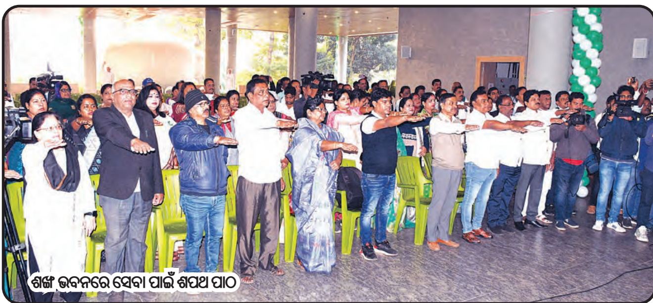
ଶଙ୍ଖ ଭବନରେ ସେବା ପାଇଁ ଶପଥ ପାଠ