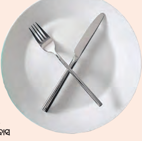
ବିଭିନ୍ନ ପର୍ଯ୍ୟବର୍ତ୍ତନରେ ମହିଳାମାନେ ଉପବାସ

ରଖିଥାନ୍ତି । ସାଧାରଣତଃ ଉପବାସକୁ ଭକ୍ତିଭାବ ସହ ଯୋଡ଼ା ଯାଇଥାଏ । ତେବେ ଉପବାସ ଦ୍ୱାରା ଓକନ ହାସ ପାଇଥାଏ ବୋଲି କିଛି ଲୋକ ମନେ କରିଥାନ୍ତି । ବିଜ୍ଞାନ ଓ ଆଧ୍ୟାତ୍ମିକ ଦୃଷ୍ଟିରୁ ଉପବାସ କରିବା ସ୍ୱାସ୍ଥ୍ୟପକ୍ଷେ ଭଲ ବୋଲି କୁହାଯାଏ । କିନ୍ତୁ ଉପବାସ ସମୟରେ ଏମିତି କିଛି ଖାଦ୍ୟପେୟ ରହିଛି, ଯାହାକୁ ଖାଇବା ଦ୍ୱାରା ଗ୍ୟାସ୍, ଏସିଡିଟି, ପୁଣ୍ଡୁରିକା, ବାନ୍ତି ଆଦି ସମସ୍ୟା ଦେଖାଯାଏ । ତେବେ ତାଳକୁ ଜାଣିବା, ଉପବାସ ସମୟରେ କେଉଁସବୁ ଖାଦ୍ୟ ଶରୀର ପକ୍ଷେ ହାନିକାରକ ହୋଇଥାଏ ।