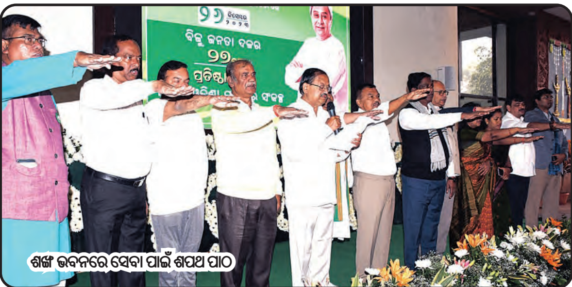
ଶଙ୍ଖ ଭବନରେ ସେବା ପାଇଁ ଶପଥ ପାଠ