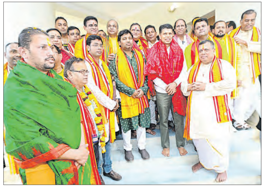
ଶ୍ରୀମନ୍ଦିର ପରିକ୍ରମା ପ୍ରକଳ୍ପର ଲୋକାର୍ପଣ ପାଇଁ ନିମନ୍ତ୍ରଣ ନେଇ ଆସିଥିବା ସେବାୟତମାନେ ନବୀନ ନିବାସରେ ମୁଖ୍ୟମନ୍ତ୍ରୀ ନବୀନ ପଟ୍ଟନାୟକ ଓ '୫-ଟି' ଅଧ୍ୟକ୍ଷ କାର୍ଯ୍ୟକ୍ରମ ପାଣ୍ଡିଆନଙ୍କୁ ନିମନ୍ତ୍ରଣ କରୁଛନ୍ତି