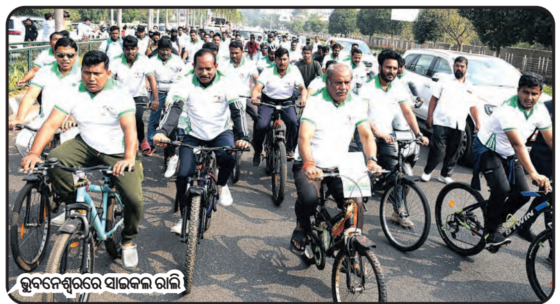
ଭୁବନେଶ୍ୱରରେ ସାଇକଲ ରାଲି