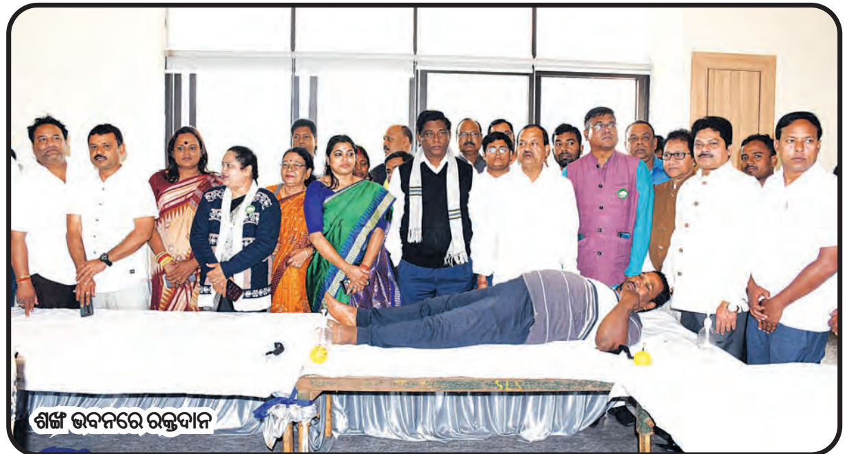
ଶଙ୍ଖ ଭବନରେ ରକ୍ତଦାନ