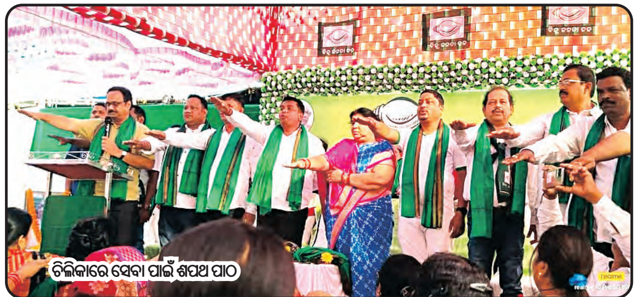
ଚିଲିକାରେ ସେବା ପାଇଁ ଶପଥ ପାଠ