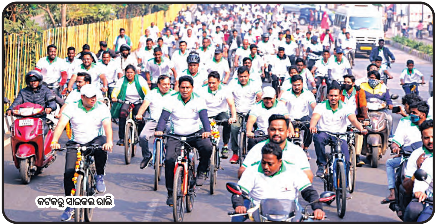
କଟକରୁ ସାଇକଲ ରାଲି