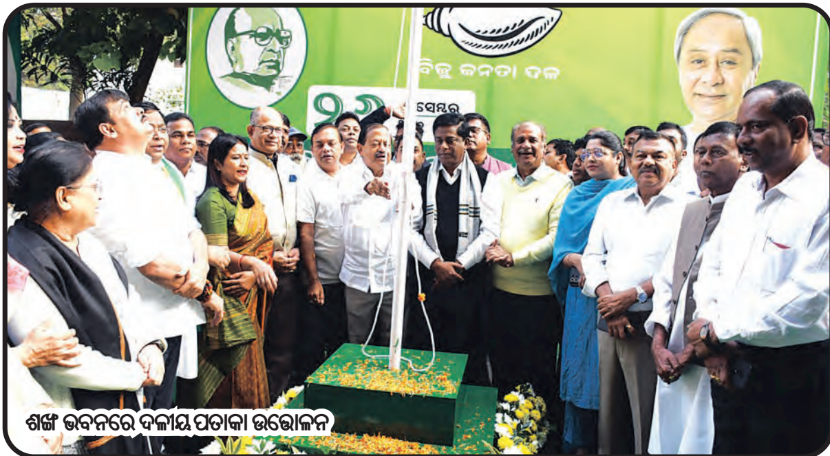
ଶଙ୍ଖ ଭବନରେ ଦଳୀୟ ପତାକା ଉତ୍ତୋଳନ