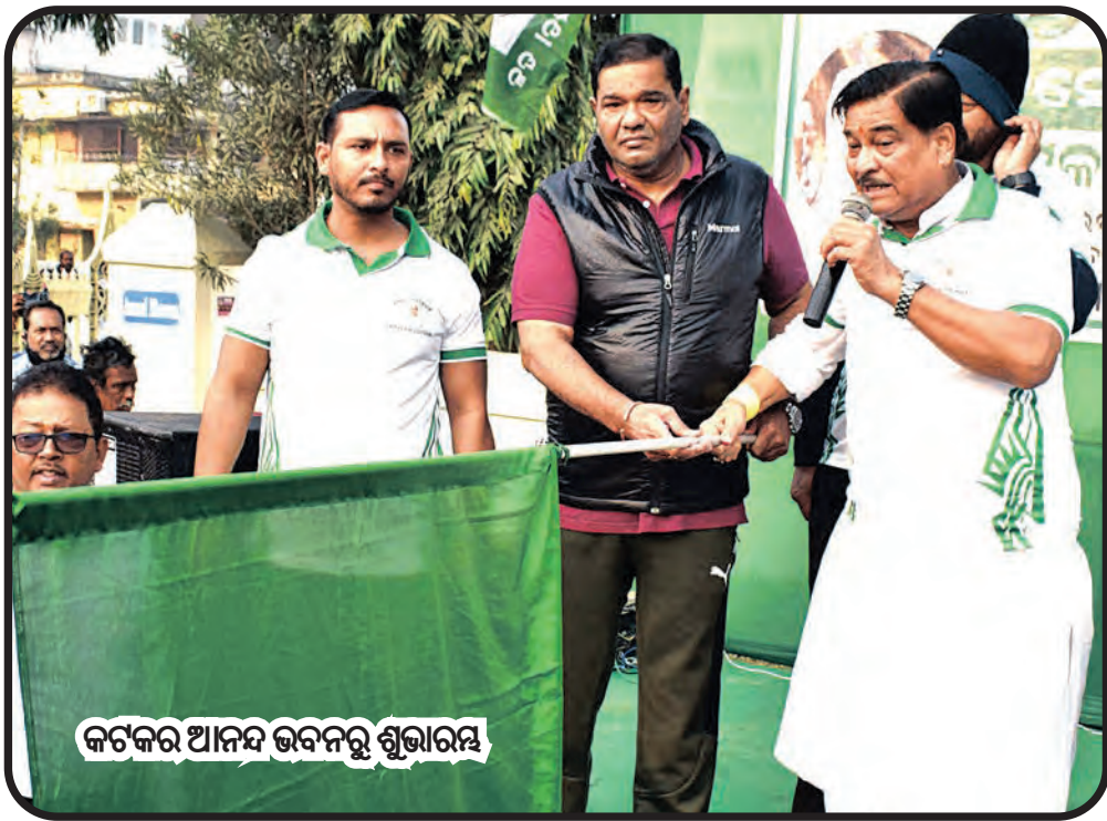
କଟକର ଆନନ୍ଦ ଭବନରୁ ଶୁଭାରମ୍ଭ