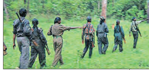
ମାଓବାଦୀମାନେ ମାଟି ତଳେ ଅସ୍ତ୍ରଶସ୍ତ୍ର ଲୁଚାଇ ରଖୁଥିଲେ।

କିନ୍ତୁ ପୁଲିସ୍ ଗଣନାରେ ଏହା ଖରାବ ପଡ଼ିଥିଲା। ଗଣନା କରିବା ପାଇଁ ମାଟି ଖୋଳିବା ପରେ ବହୁଳ ସଫଳତା ସାଧନ କରିଛନ୍ତି।