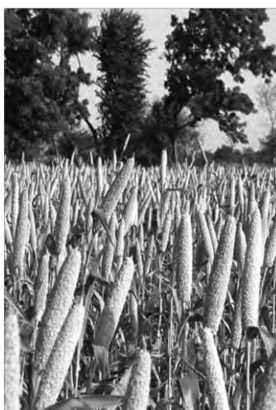
ଏବଂ ବାଜରାକୁ ୩୫୦ ମିମି, ଜହାକୁ ୪୦୦ ମିମି ଜଳରେ ମଧ୍ୟ ଚାଷ କରାଯାଇପାରିବ। ସେହିପରି ଧାନଚାଷ ଓ ଅମଳ ନିମନ୍ତେ ୧୦୦ ରୁ ୧୪୦ ଦିନ ଆବଶ୍ୟକ ହେଲାବେଳେ ଏହି ପୁଷ୍ଟିଶାସ୍ୟର ଉତ୍ପାଦନ ନିମନ୍ତେ ମାତ୍ର ୬୦ ରୁ ୮୦ ଦିନ ସମୟ ଆବଶ୍ୟକ ହୋଇଥାଏ।

୯୦ ନିୟୁତରୁ ଅଧିକ ଲୋକ ସେମାନଙ୍କ ଖାଦ୍ୟ ଆବଶ୍ୟକତା ମେଣ୍ଟାଇବା ପାଇଁ ମିଳେଟ୍ ଉପରେ ହିଁ ନିର୍ଭର କରିଥାନ୍ତି। ଏହି ଶାସ୍ୟ ୬୪ ଡିଗ୍ରୀ ସେଲସିୟସ୍ ତାପମାତ୍ରା ସହନ କରିପାରୁଥିବା ବେଳେ ସ୍ଵଳ୍ପଜଳ ଏବଂ ଶୁଷ୍କ ପରିବେଶରେ ମଧ୍ୟ ଚାଷ କରାଯାଇପାରେ। ଧାନଚାଷ ପାଇଁ ଯେତିକି ପରିମାଣ ଜଳ, କୀଟନାଶକ, ସାର ଇତ୍ୟାଦି ଆବଶ୍ୟକ ପଡ଼େ, ତାହା ମିଳେଟ୍ ଚାଷ ପାଇଁ ଆବଶ୍ୟକ ହୋଇନାଥାଏ। ତେଣୁ ବର୍ତ୍ତମାନର ଜନସଂଖ୍ୟା ବୃଦ୍ଧି, ବିଶ୍ଵ ତାପମାତ୍ରା ବୃଦ୍ଧି, ଜଙ୍ଗଲ କ୍ଷୟ, ବନ୍ୟା, ବାତ୍ୟା, ମନୁଡ଼ି ଇତ୍ୟାଦି ଜଳବାୟୁର ଅସାଧାରଣ ପରିବର୍ତ୍ତନ ଜନିତ ପ୍ରାକୃତିକ ଦୁର୍ଘଟାକ୍ରମରେ ଏହି ପୁଷ୍ଟିଶାସ୍ୟ ଖାଦ୍ୟ ହିଁ ପୁଷ୍ଟି ଭୂମିକା ଗ୍ରହଣ କରିବ। ଆଖିତାପ ନିମନ୍ତେ ୨୧୦୦ ମିମି, ଧାନଚାଷ ନିମନ୍ତେ ୧୨୫୦ ମିମି ଜଳ ଆବଶ୍ୟକ ହେଲା ବେଳେ ପୁଷ୍ଟିଶାସ୍ୟ ଚାଷ ନିମନ୍ତେ ମାତ୍ର ୫୦୦ ମିମିଠାରୁ କମ୍ ଜଳ ଆବଶ୍ୟକ। ସେହିପରି ମାଣ୍ଡିଆ