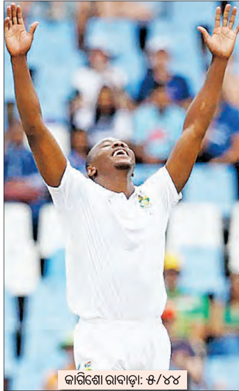
କାରିସୋ ରାବାଡା: ୫/୪୪

ଶୁଭମାନ ବିଲ୍ ୨ ଓ ଯଶସୀ ଜୟସାଲ ୧୬ ରନ୍ କରିଥିଲେ। ବିରାଟ କୋହଲି ଓ ଶ୍ରେୟସ ଆୟର ପାଇଥିବା ଗୋଟିଏ ଲେଖାଏଁ କାବନବାନରୁ ପାଇବା ଉଠାଇ ଭଲ ବ୍ୟାଟିଂ କରିବା ପକ୍ଷରେ ମଧ୍ୟାହ୍ନ ଭୋଜନ ସୁଦ୍ଧା ଭାରତ ୩ ଡିକେଟରେ ୯୯ ରନ୍ କରିଥିଲା।