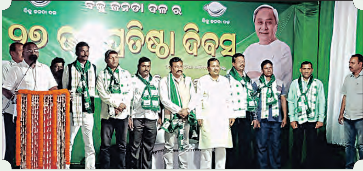
ବୌଦ୍ଧ, ୨୬/୧୨ (ସମିପ)

ସ୍ଥାନୀୟ ଚାନ୍ଦନହଳଠାରେ ଆଜି ବୌଦ୍ଧ ନିର୍ବାଚନ ମଣ୍ଡଳୀ ବିଜୁ ଜନତା ଦଳର ୨୭ତମ ପ୍ରତିଷ୍ଠା ଦିବସ ପାଳିତ ହୋଇଯାଇଛି। ପ୍ରତିଷ୍ଠା ଦିବସରେ ମୁଖ୍ୟଅତିଥି ଭାବେ ଜଙ୍ଗଲ ପରିବେଶ, ଜଳବାୟୁ ପରିବର୍ତ୍ତନ, ସୂଚନା ଓ ଲୋକସଂପର୍କ ବିଭାଗ ମନ୍ତ୍ରୀ ପ୍ରଦୀପ କୁମାର ଅମାତ ଯୋଗଦେଇ ପ୍ରଭୁ ଶ୍ରୀକରନାଥ ଓ ସ୍ୱର୍ଗତ ବିଜୁବାବୁଙ୍କ ପଦୋତ୍ତରରେ ପୁଷ୍ପମାଲ୍ୟ ଅର୍ପଣ କରି କାର୍ଯ୍ୟକ୍ରମ ଶୁଭାରମ୍ଭ କରିଥିଲେ।