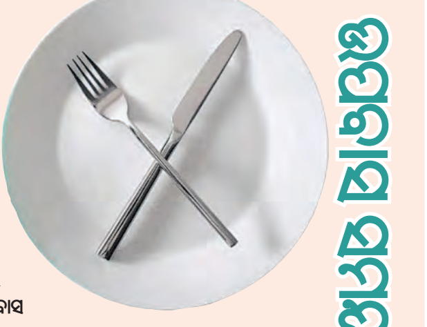
ବିଭିନ୍ନ ପର୍ଯ୍ୟବର୍ତ୍ତନରେ ମହିଳାମାନେ ଉପବାସ

ରଖିଥାନ୍ତି । ସାଧାରଣତଃ ଉପବାସକୁ ଭକ୍ତିଭାବ ସହ ଯୋଡ଼ା ଯାଇଥାଏ । ତେବେ ଉପବାସ ଦ୍ୱାରା ଓକନ ହାସ ପାଇଥାଏ ବୋଲି କିଛି ଲୋକ ମନେ କରିଥାନ୍ତି । ବିଜ୍ଞାନ ଓ ଆଧ୍ୟାତ୍ମିକ ଦୃଷ୍ଟିରୁ ଉପବାସ କରିବା ସ୍ୱାସ୍ଥ୍ୟପକ୍ଷେ ଭଲ ବୋଲି କୁହାଯାଏ । କିନ୍ତୁ ଉପବାସ ସମୟରେ ଏମିତି କିଛି ଖାଦ୍ୟପେୟ ରହିଛି, ଯାହାକୁ ଖାଇବା ଦ୍ୱାରା ଗ୍ୟାସ୍, ଏସିଡିଟି, ପୁଣ୍ଡୁରିକା, ବାନ୍ତି ଆଦି ସମସ୍ୟା ଦେଖାଯାଏ । ତେବେ ତାଳକୁ ଜାଣିବା, ଉପବାସ ସମୟରେ କେଉଁସବୁ ଖାଦ୍ୟ ଶରୀର ପକ୍ଷେ ହାନିକାରକ ହୋଇଥାଏ ।