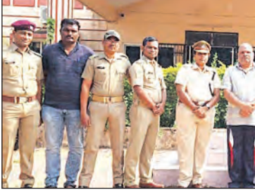
ମାମଲା ରୁକ୍ତ ହୋଇଥିଲା। ଘଟଣା ପରଠାରୁ ହରିହର ଓଡ଼ିଶାରେ ବିଭିନ୍ନ ସ୍ଥାନ ସମେତ ସୁନ୍ଦରଗଡ଼େ ଆତ୍ମଗୋପନ କରିଥିଲେ।

୨୮ ବର୍ଷ ପରେ ବ୍ରହ୍ମପୁରରୁ ଅଭିଯୁକ୍ତ ଡାଇଁ ଗିରଫ ହେଲାଣି। ପୁରୀ ଜିଲ୍ଲାରେ ମାଓବାଦୀଙ୍କ ଗତିବିଧି ଯୋଗୁଁ ବାଘ ଗଣନା ପ୍ରଭାବିତ ହେବାର ଆଶଙ୍କା ବୃଦ୍ଧି ହୋଇଛି।