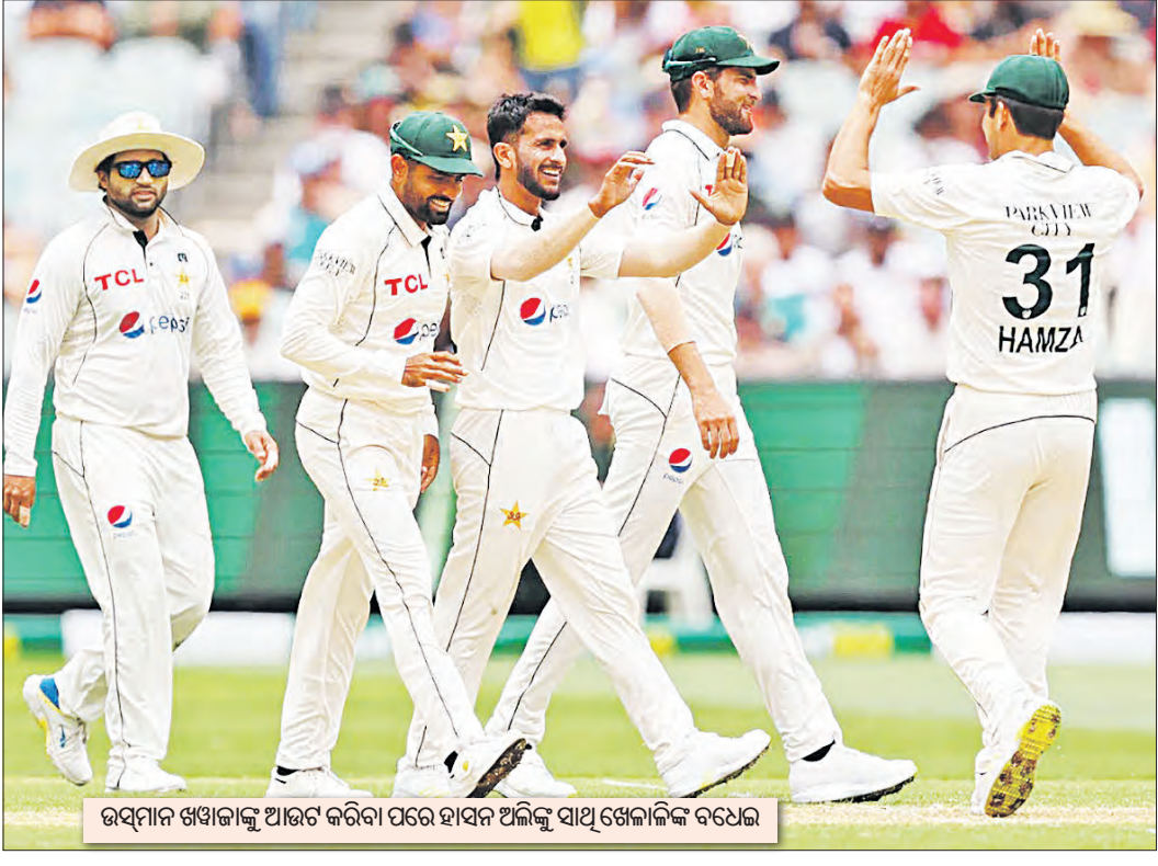
ଉପସାହର ଶ୍ରୀମନ୍ତ୍ରୀ ଯୁକ୍ତ ଦଳର ଅଧିକାରୀ...